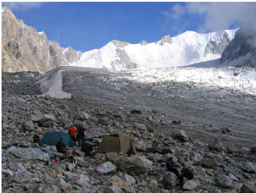
Фото 9. Ночевка на лед. Тютюргу. Начало подъема к пер. Шаурту Вост. (2А). ↓ - пер. Джорашты (3А).