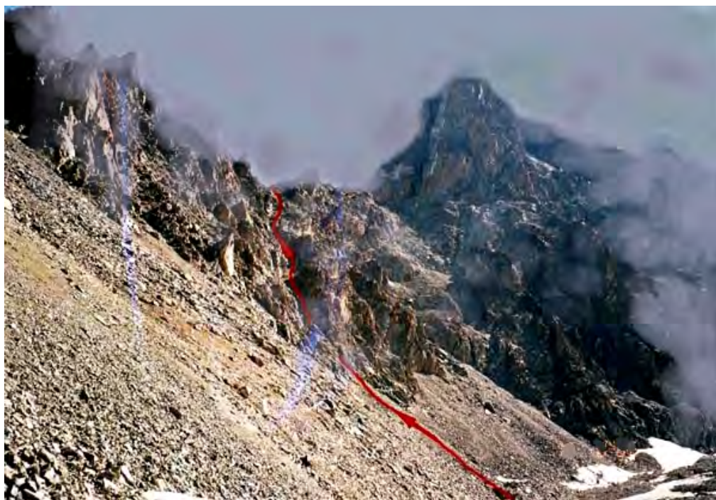
Фото 52. Перевальный взлет.