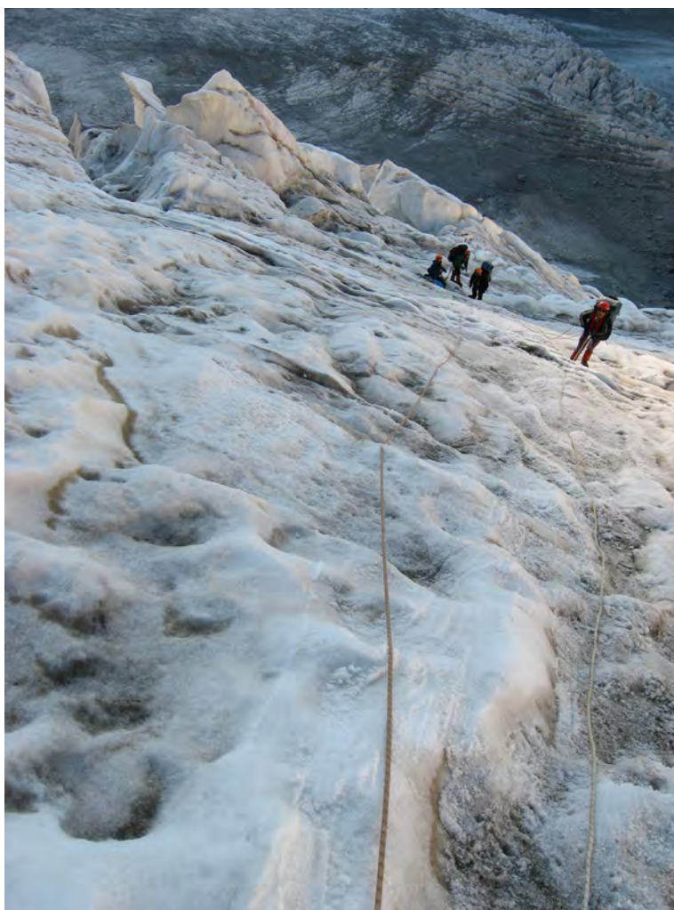
Фото 58. Участок перил при прохождении ледопада.