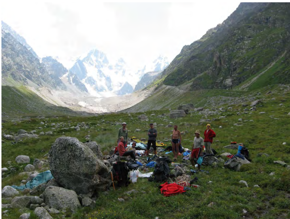
Фото 71. Место обеда у слияния рек Суган и Псыгансу. Левый борт долины. На фоне цирка Нахашбита.