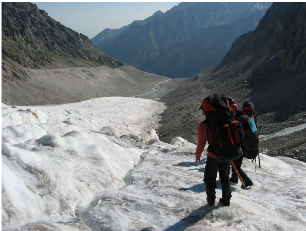
Фото 69. Путь спуска с лед. Суган Сев. в д.р. Псыгансу.