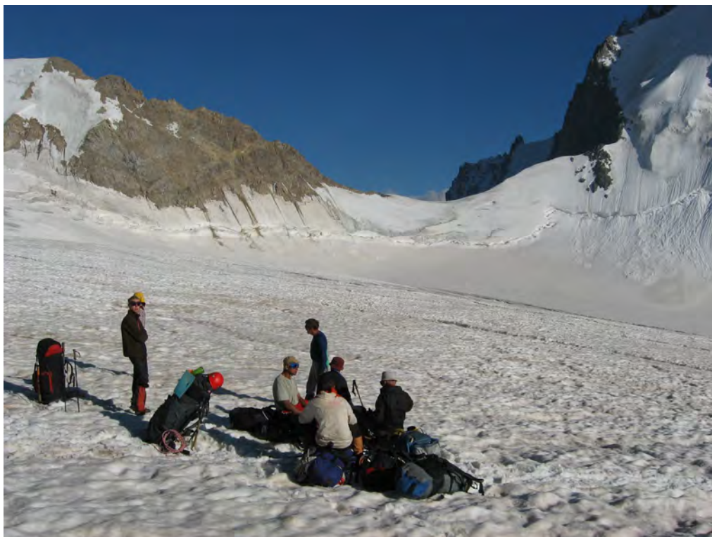
Фото 35. Верховья лед. Безенги. Пер. Дыхниауш (2Б).