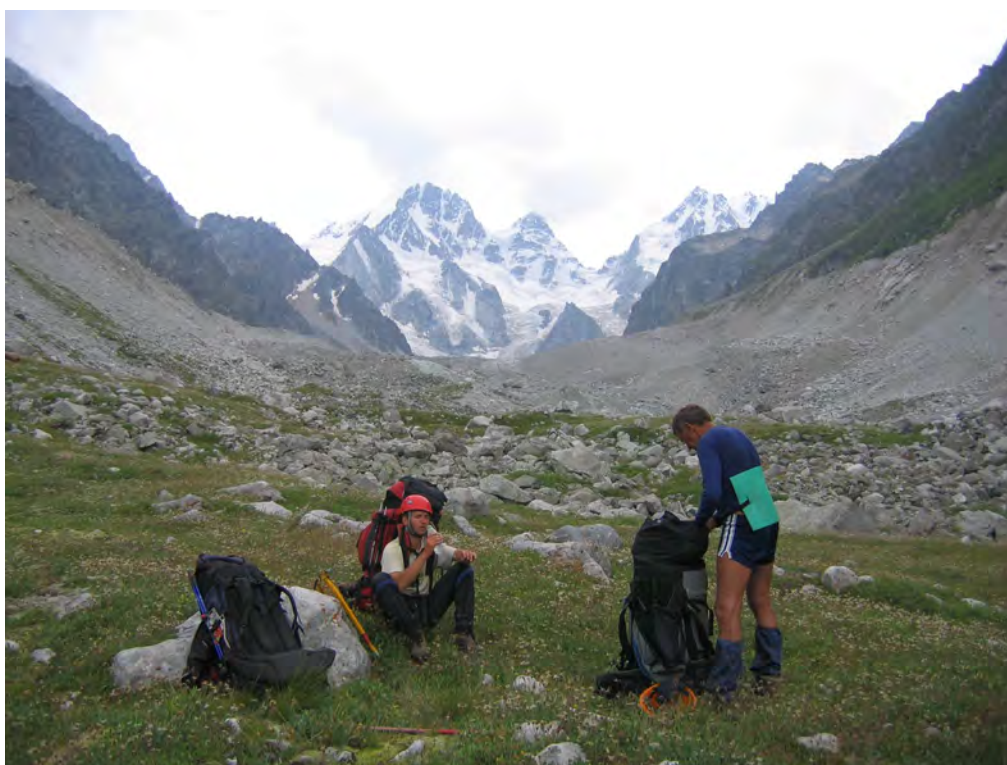
Фото 72. В д.р. Псыганс, правый берег. На фоне цирка Нахашбита.