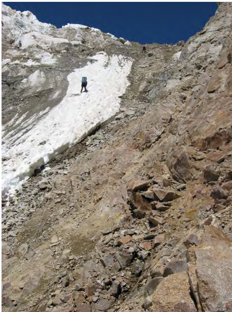
Фото 39. Участок спуска с пер. Камнепадный (2Б).