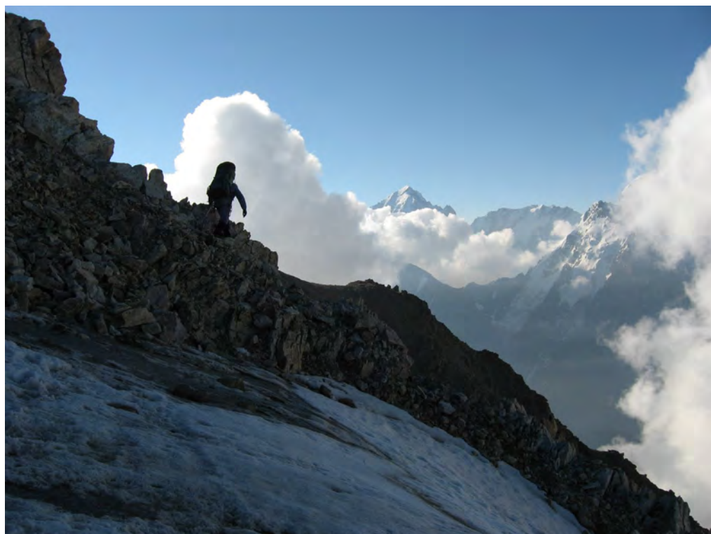
Фото 22. Пер. Спортивной Дружбы. Начало спуска с седловины.