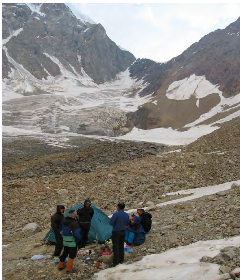
Фото 44. Ночевка на лед. Дыхсу. ↓ - пер. Дыхниауш (2Б).