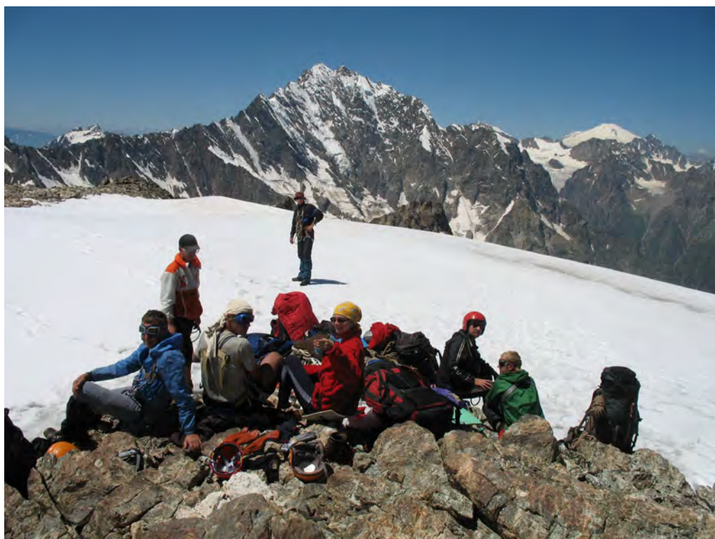
Фото 14. Место обеда на отроге. ↓ - вер. Тихтинген.