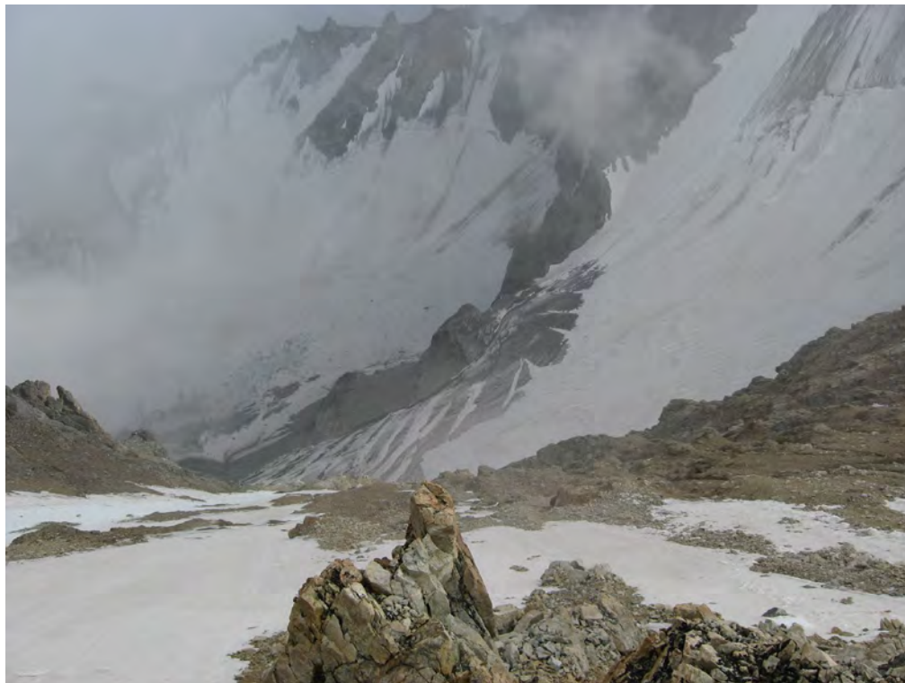
Фото 23. Путь спуска с пер. Спортивной Дружбы (2Б*) к лед. Безенги. 1 – начало спуска по скалам, 2 – место сбора на каровом леднике, 3 – место обеда. Фото с седловины (см. фото 22)