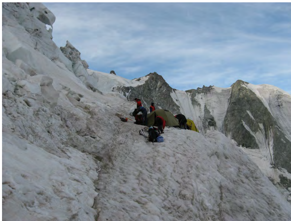
Фото 60. Ночевка в ледопаде.