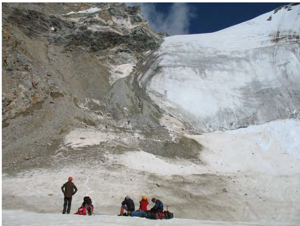
Фото 18. Спуск на лед. Шаургу с пер. Шаургу Вост. (2А). ↓ - пер. Спортивной Дружбы (2Б*). 1-2 – участок перил. – зона падения камней. Фото с места ночевки.