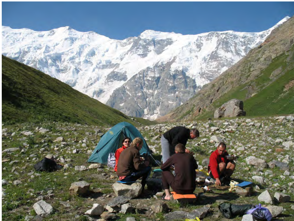
Фото 31. На Баранкоше.