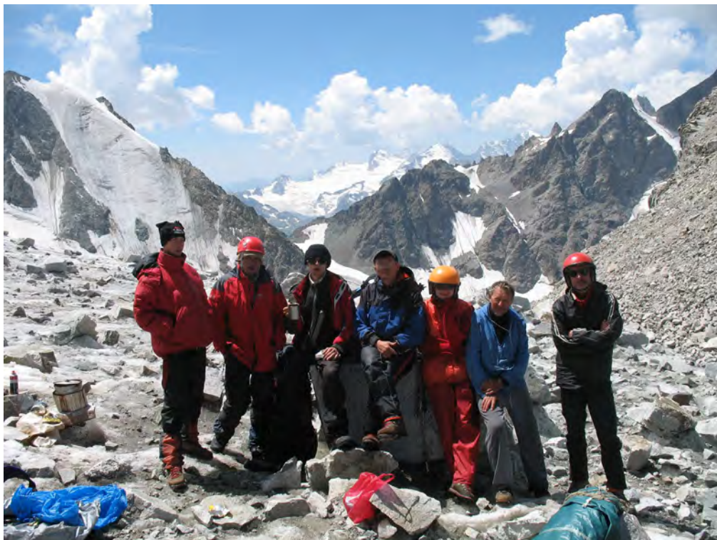
Фото 65. Группа на пер. Шести (2А, 3700).