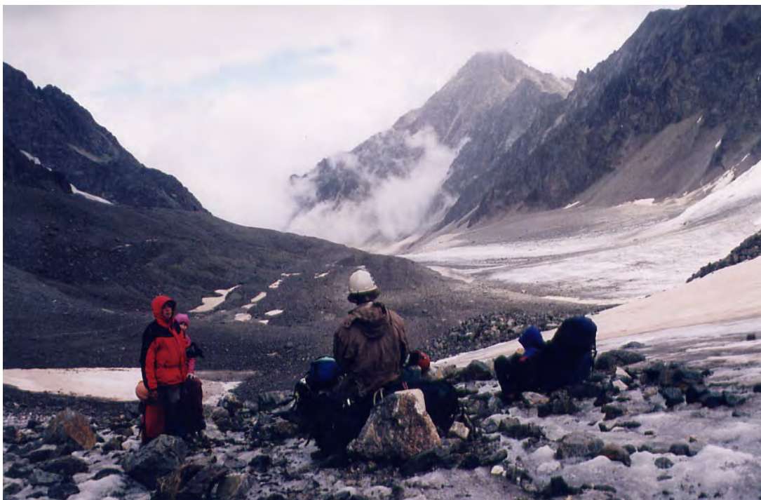
Фото 54. Долина Рцывашки.