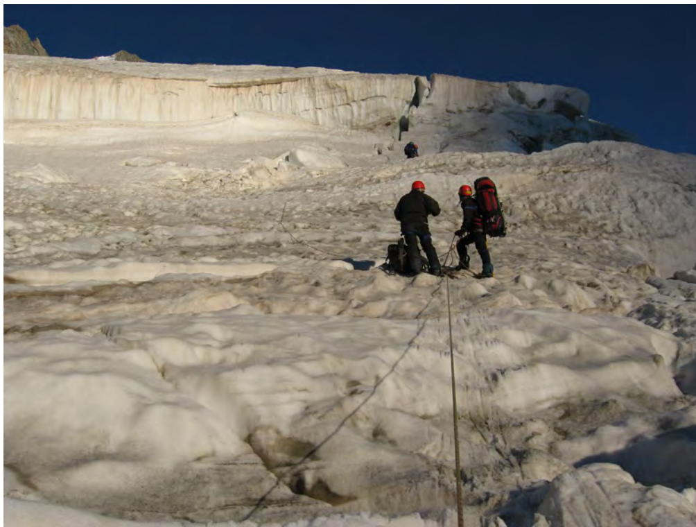
Фото 59. В ледопаде.