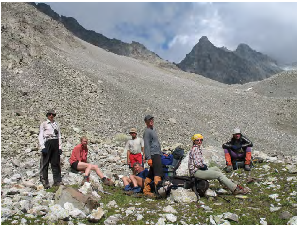
Фото 51. При подъеме к пер. Рцывашки (1Б) ( ); т. 2 – см. фото 50.