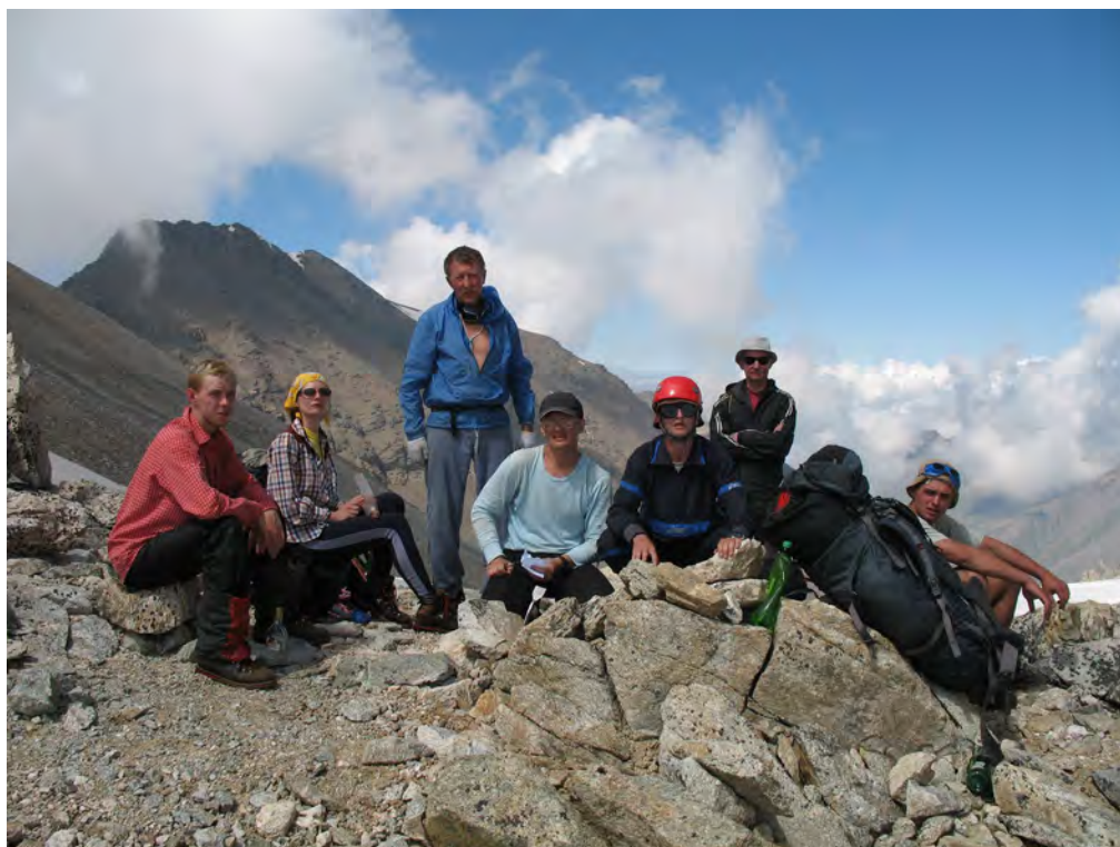
Фото 6. Группа на пер. Тютюргу Вост. (1Б, 3800).