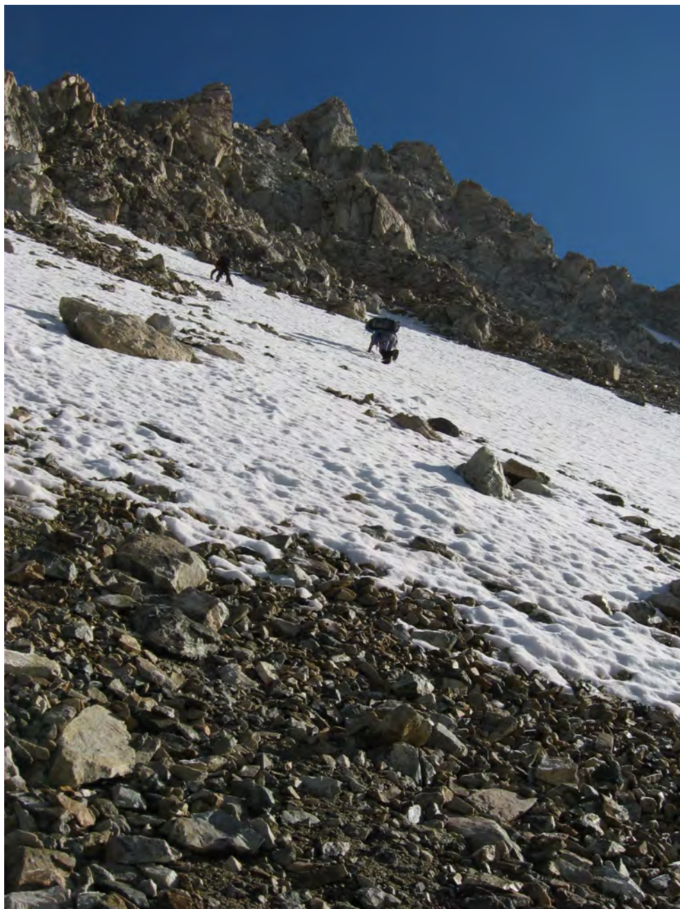
Фото 24. Спуск к скалам. Фото с точки 1 (см. фото 23).