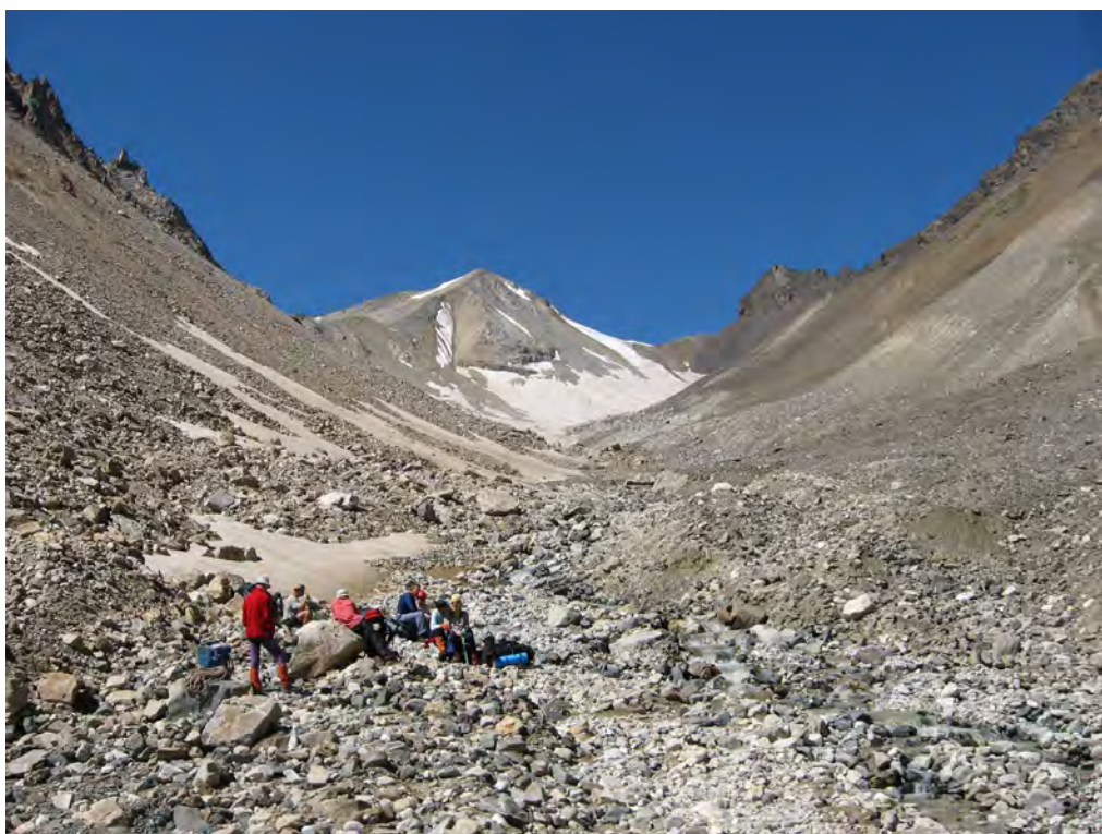
Фото 2. На леднике Булунгу. 1 – к пер. Тютюргу Вост. (1Б), 2 – пер. Тютюргу Зап. (1А).