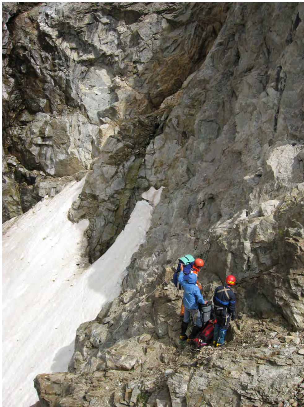
Фото 28. Станция на скалах перед выходом на ледник.