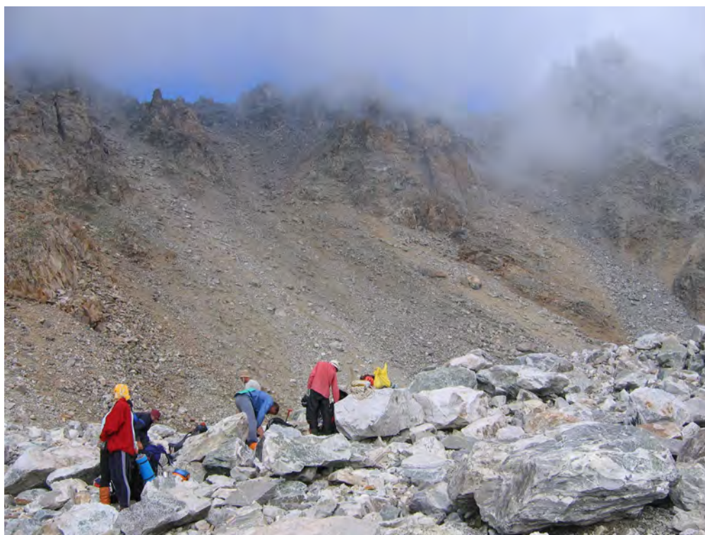
Фото 8. Спуск с пер. Тютюргу Вост. (1Б) на лед. Тютюргу. Фото с места ночевки.