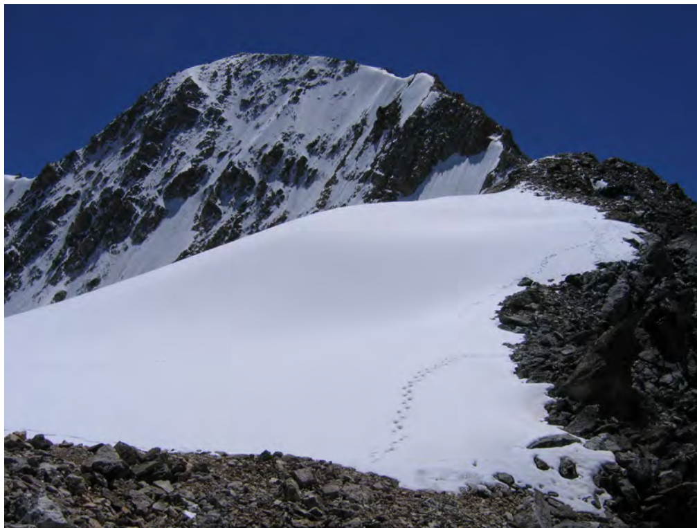
Фото 15. Выход по гребню хребта Тютюргу к пер. Шаурту Вост. (2А).