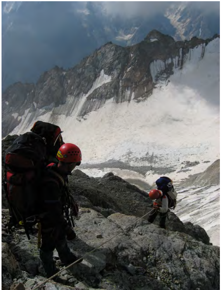
Фото 26. Прохождение скального участка.