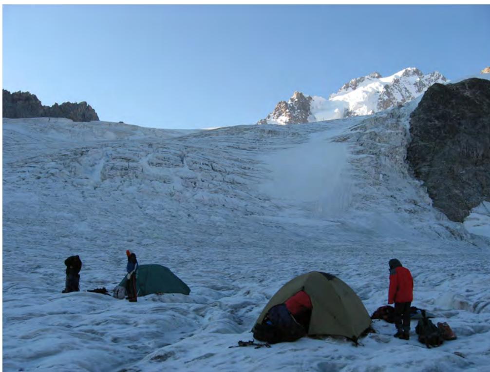
Фото 67. Ночевка на лед. Суган Сев. Подъем в верхний цирк к пер. 50 лет ВЛКСМ (3А) и к пер. М. Тореза (2Б).