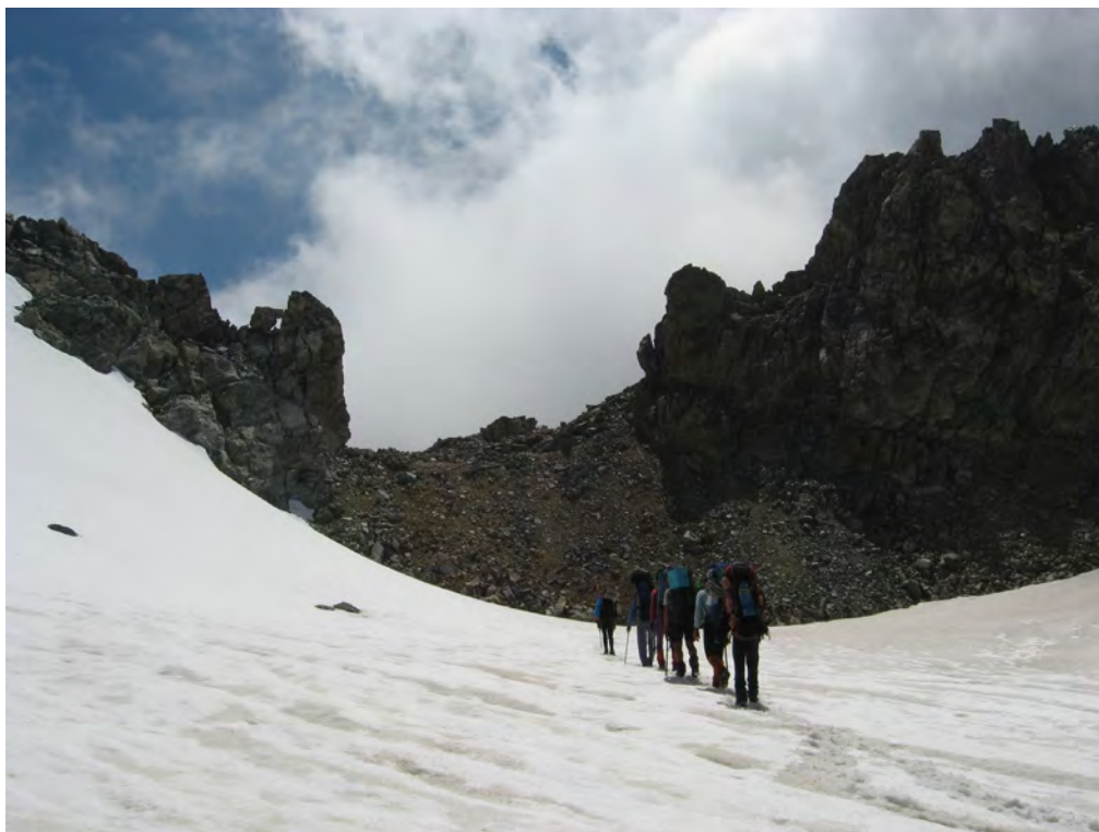
Фото 5. Перевальный взлет пер. Тютюргу Вост. (1Б).