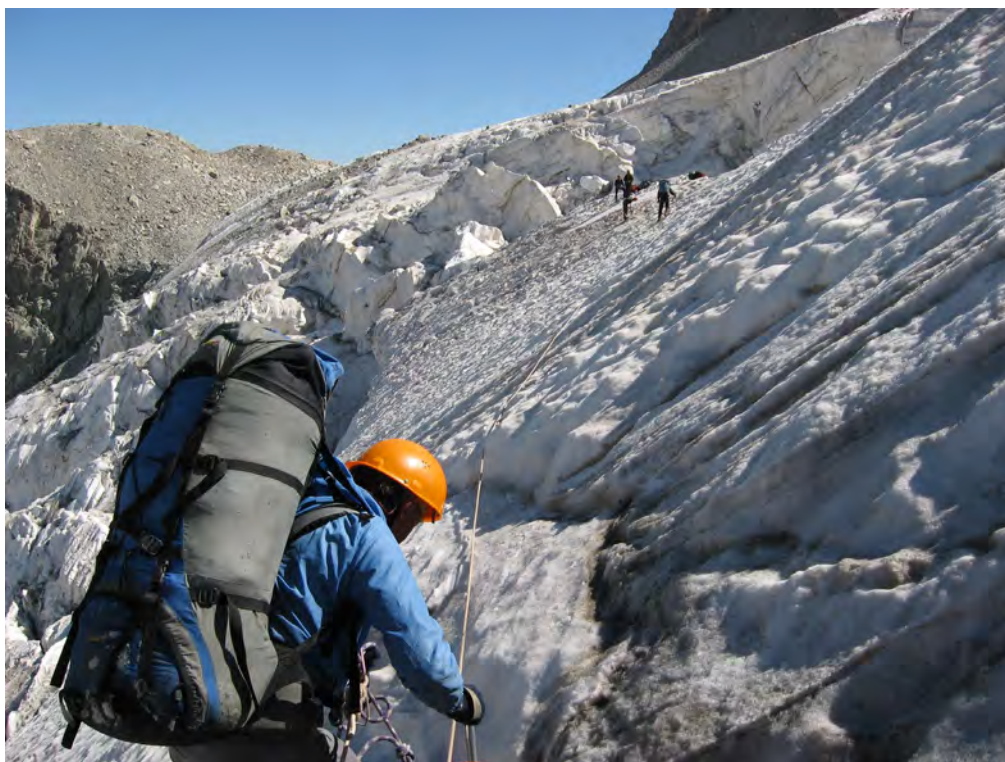
Фото 63. Выход из ледопада к пер. Шести (2А) (↓).