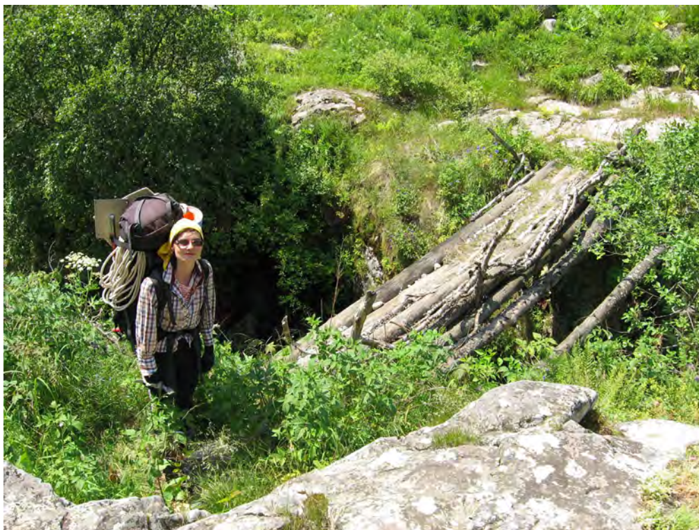
Фото 47. Мост через р. Дыхсу выше слияния с р. Карасу.