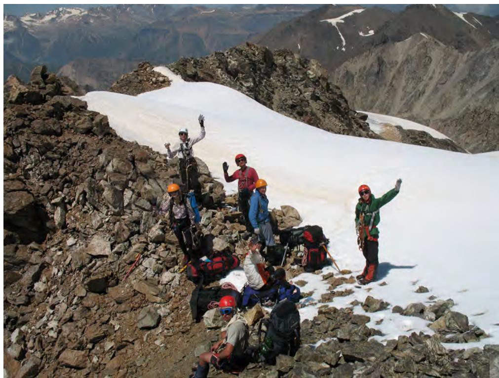
Фото 16. Группа на пер. Шаурту Вост. (2А, 3800).