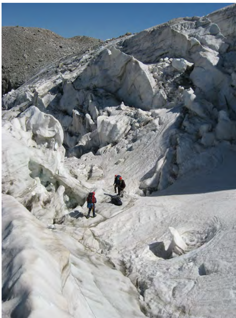
Фото 64. Движение в разломах.