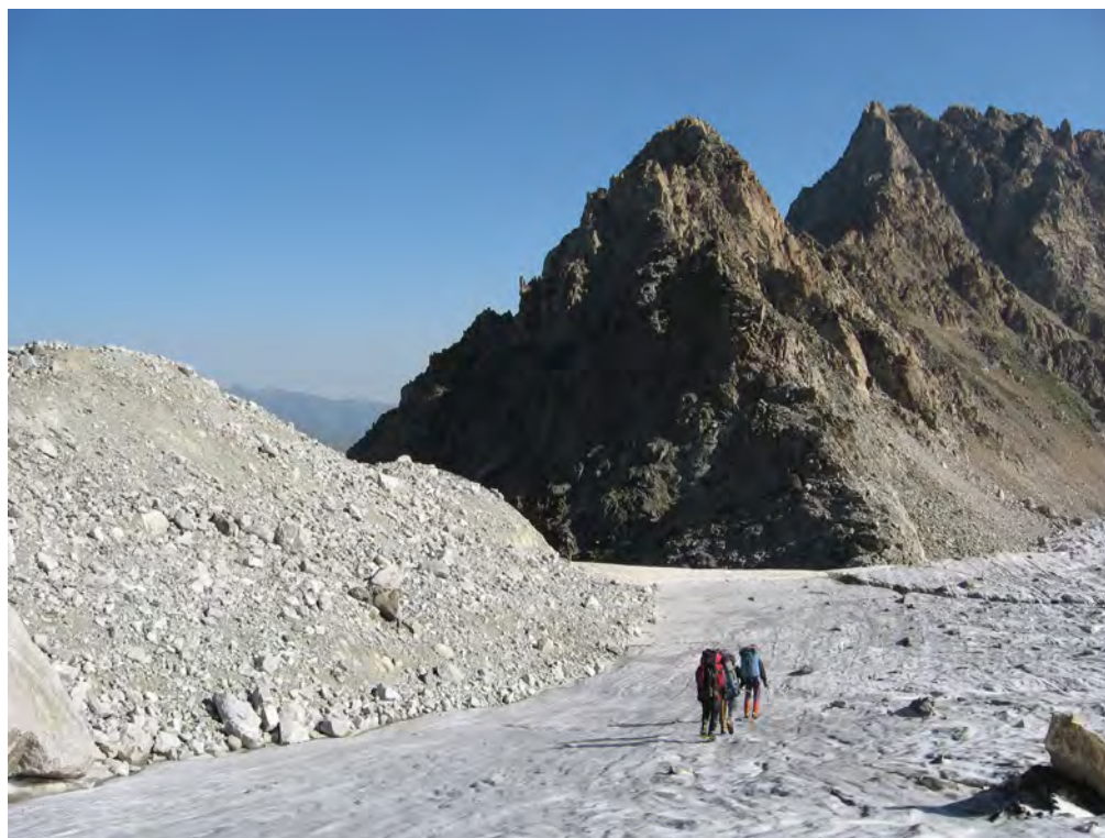
Фото 68. Пер. Осыпной (1Б). Спуск по лед. Суган Сев.