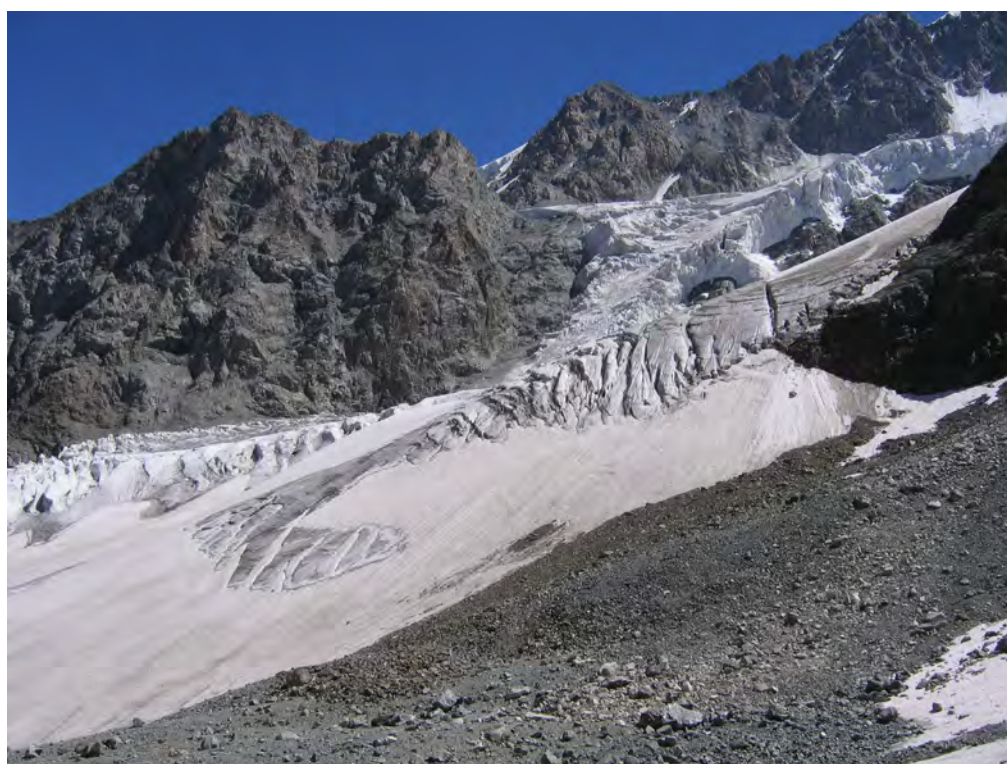
Фото 56. Путь подъема к пер. Шести (2А) ( ) с места ночевки (см. фото 55).