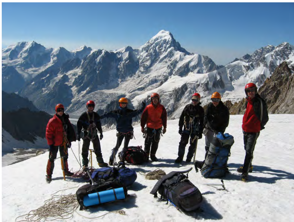
Фото 37. Группа на пер. Камнепадный (2Б, 4100).