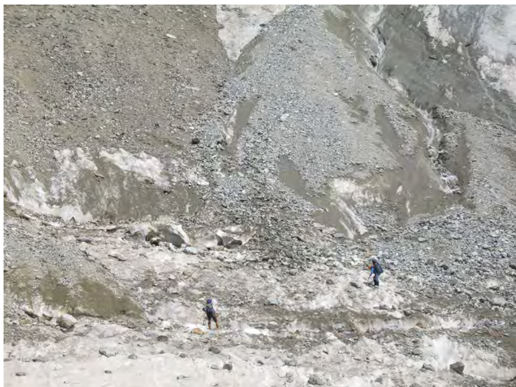
Фото 17. Спуск с пер. Шаургу В. Участок 1-2 на фото 18.