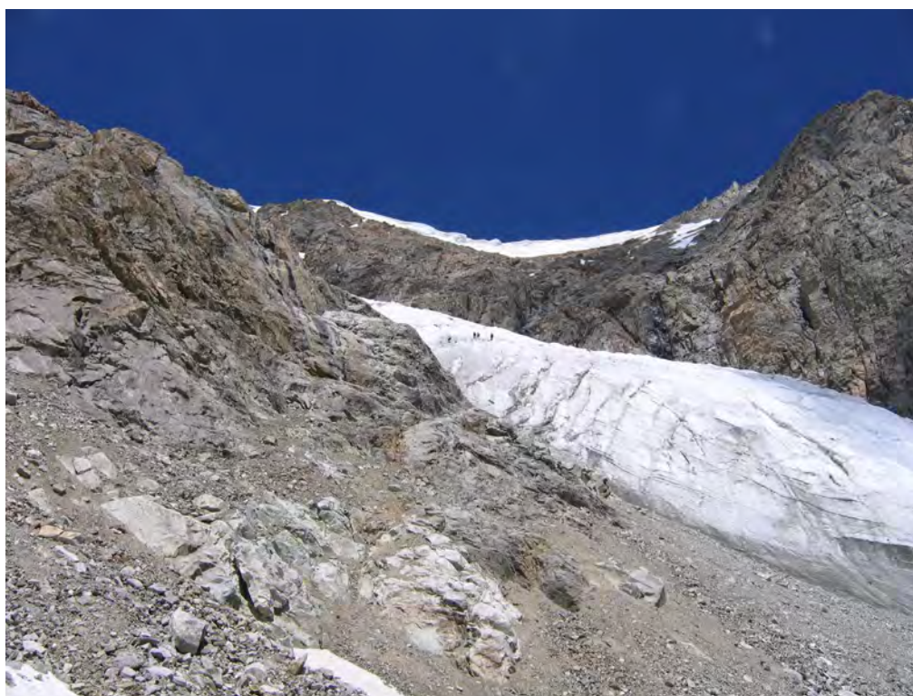
Фото 30. Пер. Спортивной Дружбы (2Б*) (↓) с места обеда (т. 3 на фото 23).