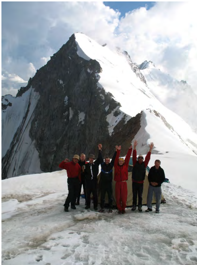
Фото 21. Группа на пер. Спортивной Дружбы (2Б*, 4100).