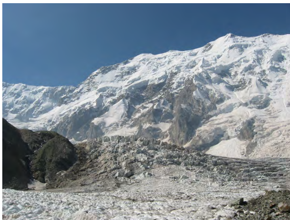
Фото 32. Путь выхода на левобережную морену лед. Безенги.