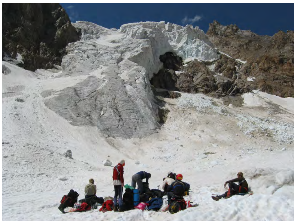
Фото 42. Пер. Камнепадный (2Б) с лед. Башхауз (т. 1 на фото 30). 1-2 – участок перил на бараньих лбах.