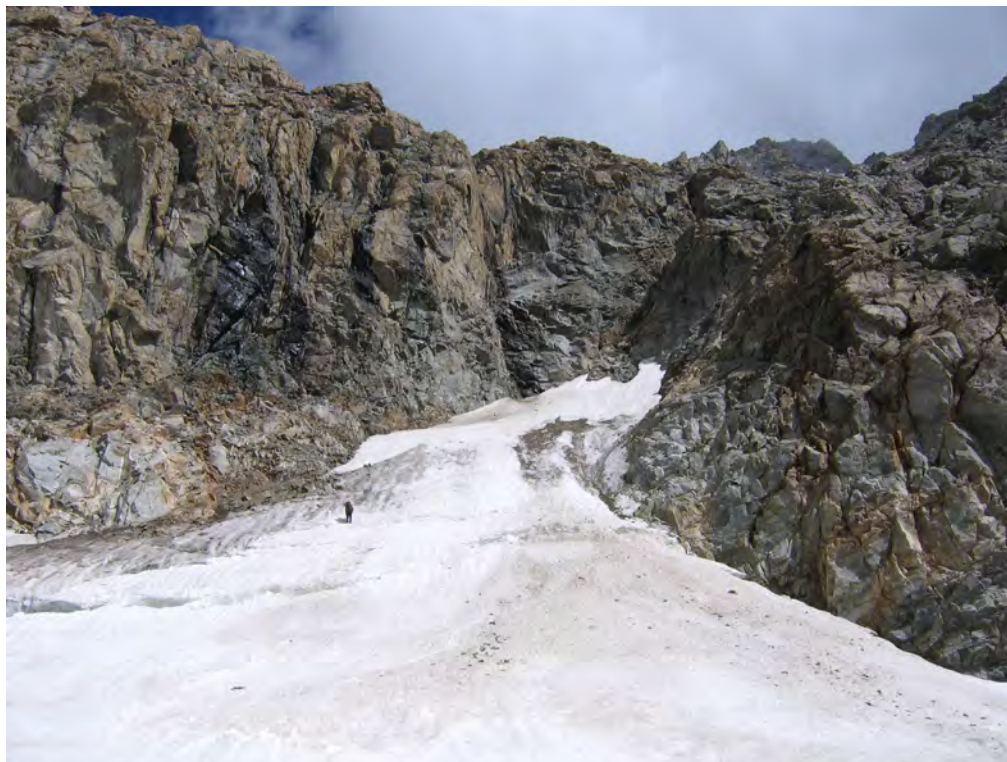
Фото 29. Выход на каровый ледник. Фото с т. 2 (см. фото 23).