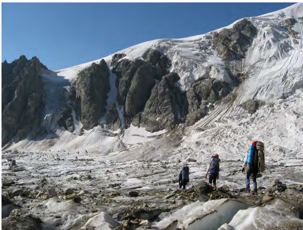
Фото 45. На лед. Дыхсу.