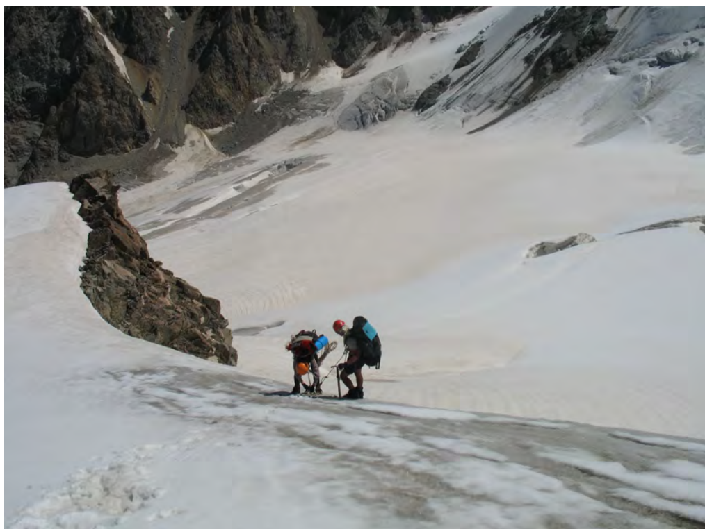
Фото 13. Выход на отрог (т. 2 на фото 10). Путь подъема по лед. Тютюргу.