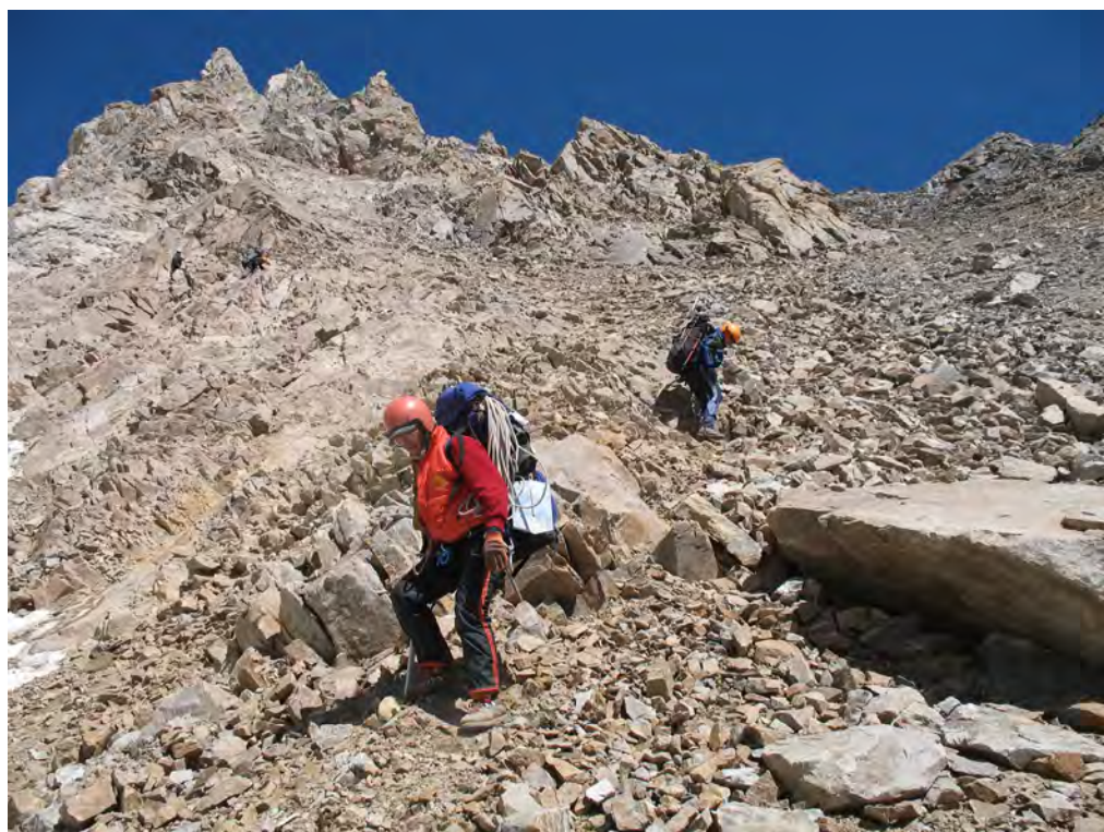
Фото 40. Траверс к бараньим лбам.