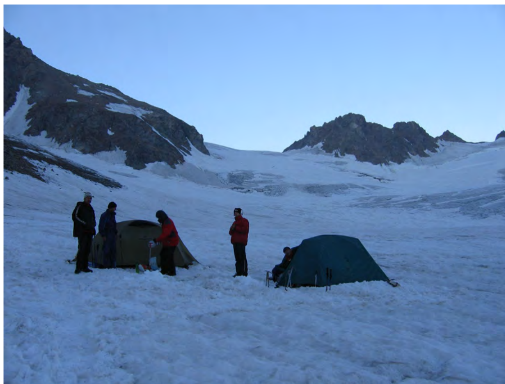
Фото 36. Ночевка в верхнем цирке лед. Безенги. Путь подъема к пер. Камнепадный (2Б) ( ).