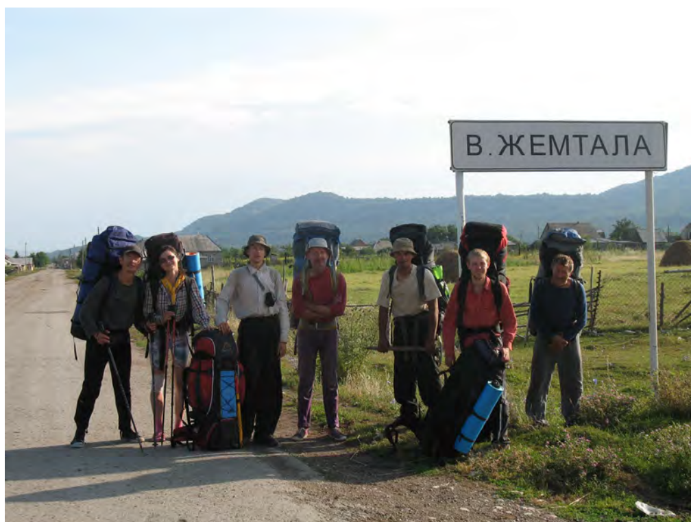
Фото 74. Группа на окраине поселка В. Жемтала.