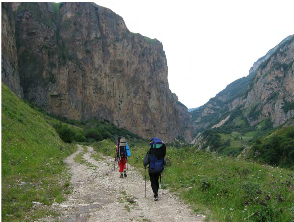
Фото 73. Каньон в д.р. Псыгансу.