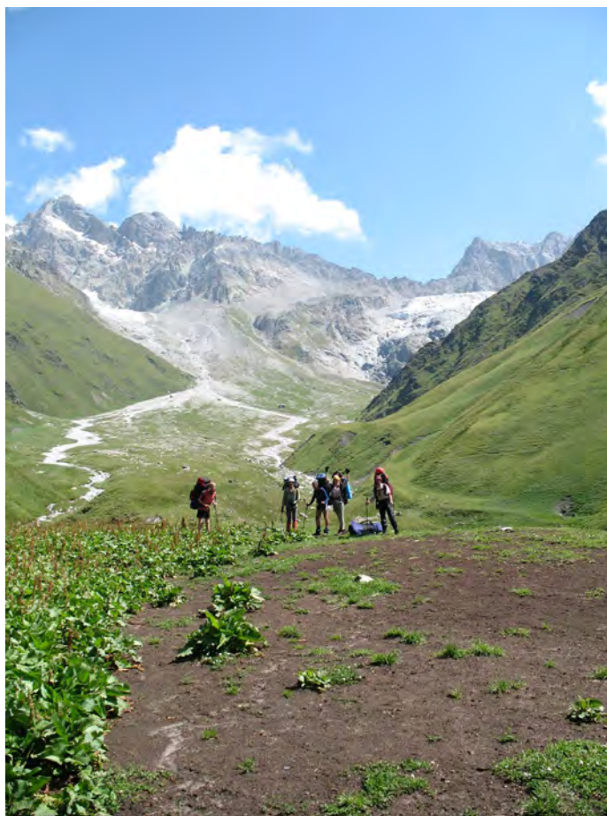
Фото 50. Верховье д.р. Ахсу. Путь подъёма к пер. Рцывашки (1Б) (↓). 1 – место обеда, 2 – место ночёвок (фото 51).