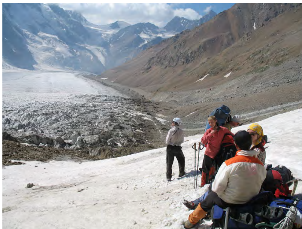
Фото 34. Лед. Безенги. Путь подъема к пер. Камнепадный (2Б).