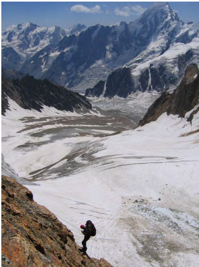
Фото 41. На бараньих лбах. Путь спуска по лед. Башхауз. 1 – место обеда (фото 31)