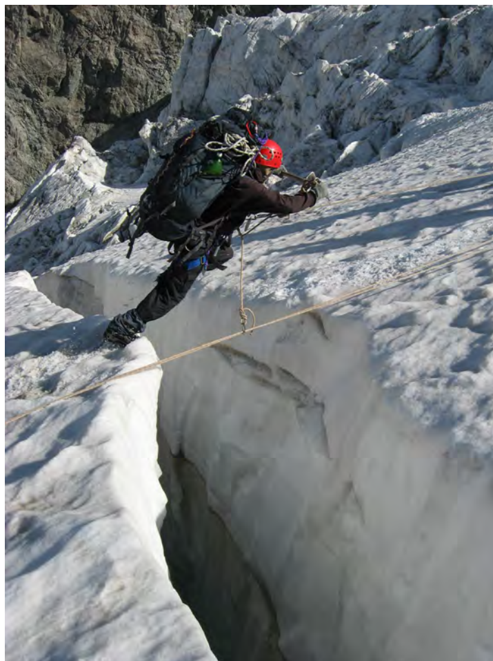
Фото 62. Преодоление трещины в ледопаде.