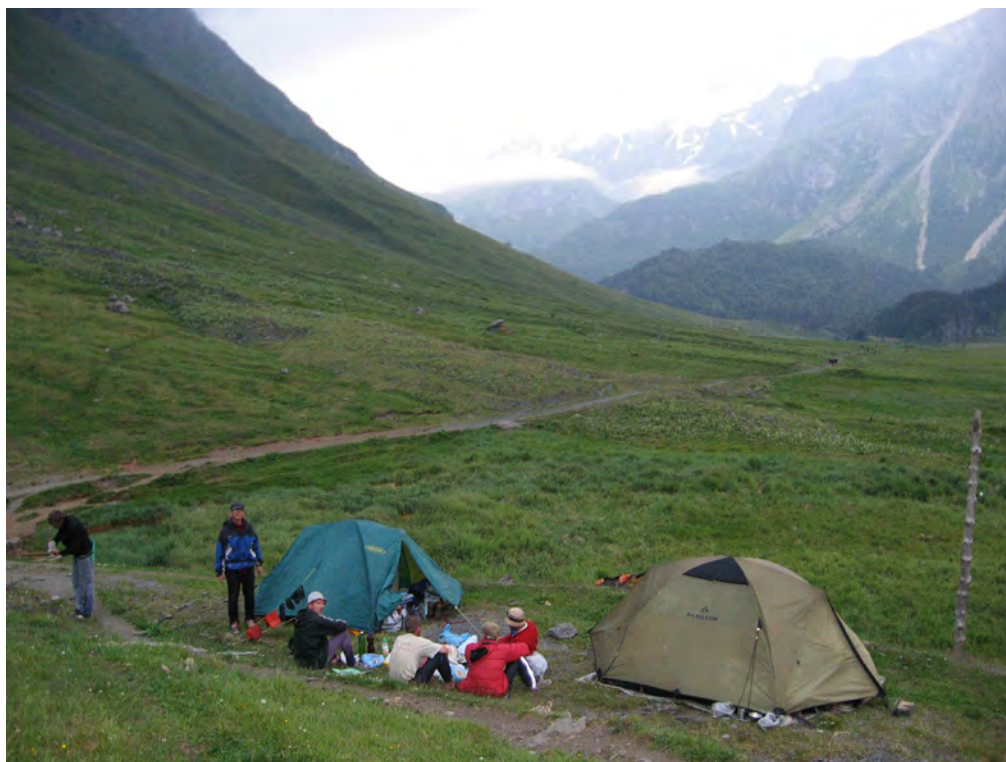
Фото 49. Д.р. Карасу. Ночевка у нарзанного источника.