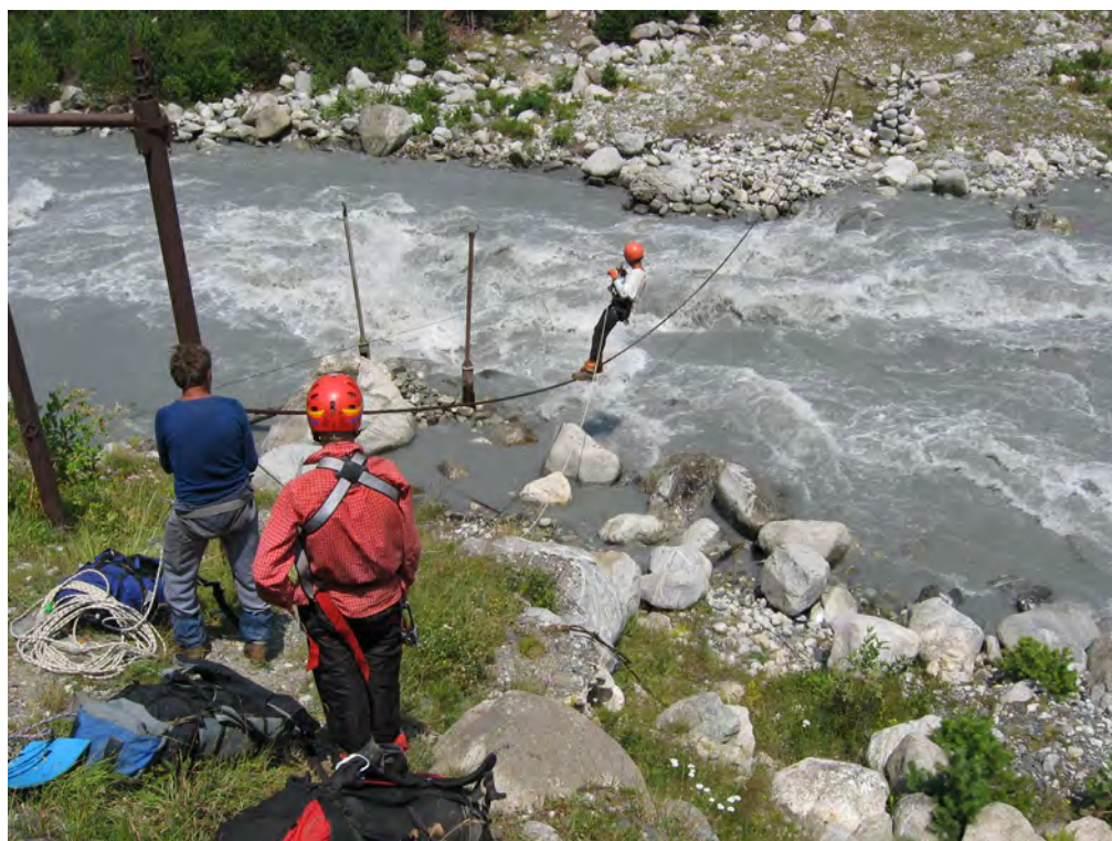
Фото 48. Переправа через р. Карасу.