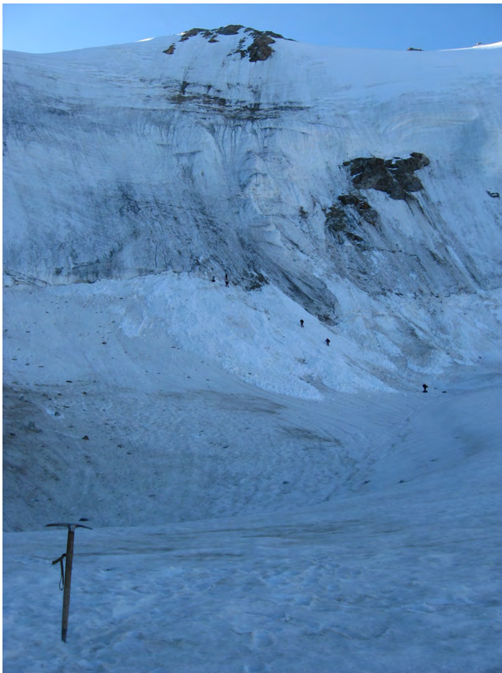
Фото 19. Путь подъема на пер. Спортивной Дружбы (2Б*) ( ). Фото с места ночевки.