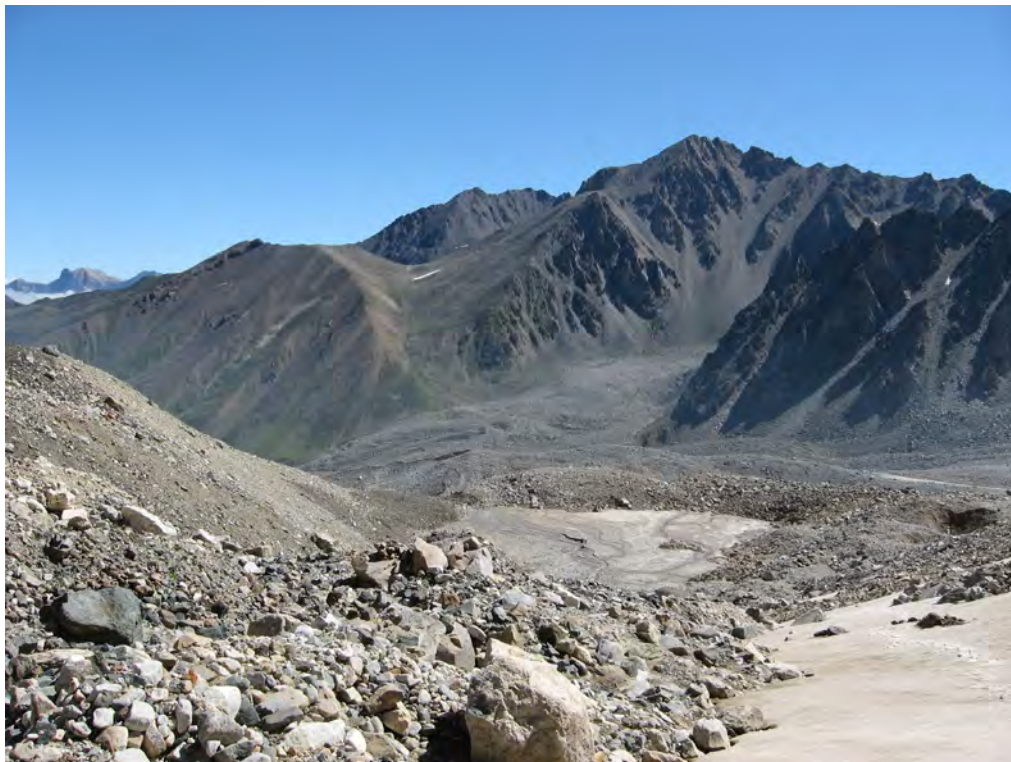
Фото 1. Верховья д.р. Булунгу. Путь подъема к пер. Тютюргу Вост. (1Б).