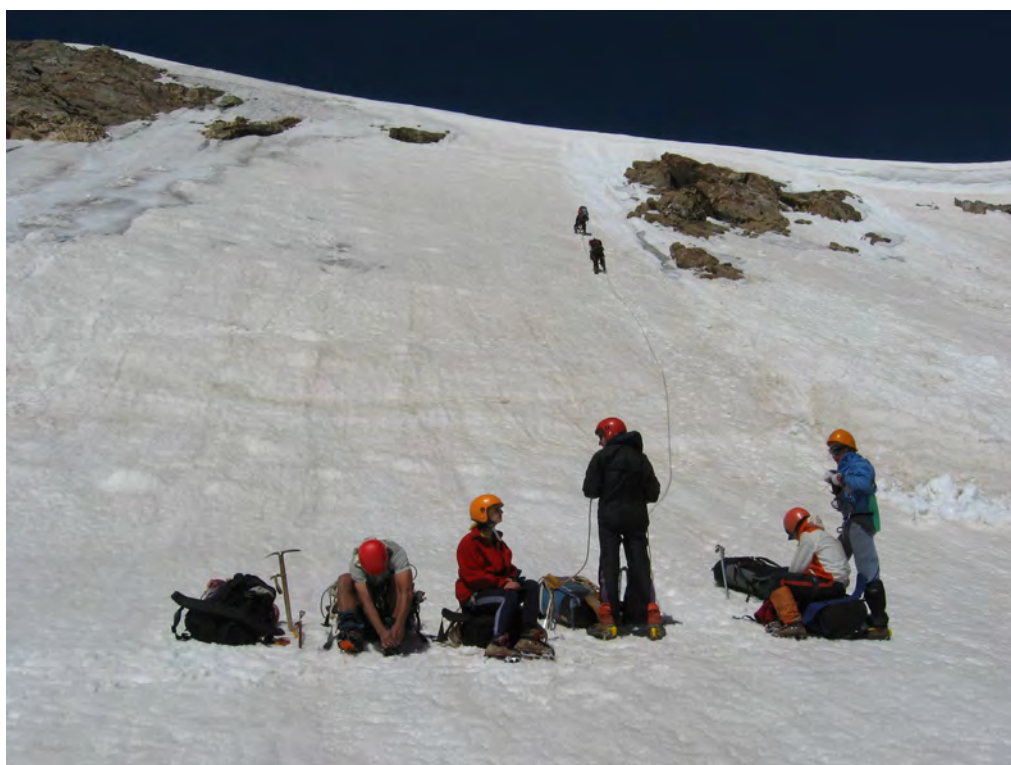
Фото 12. Подъем на отрог. Навеска перил.