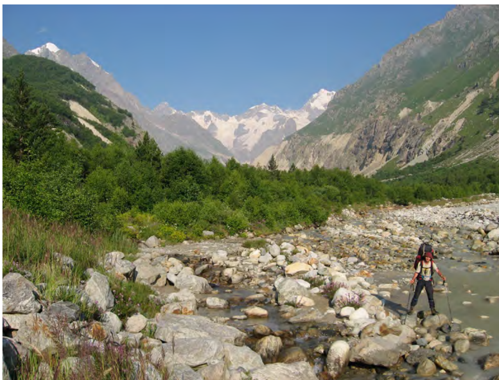
Фото 46. В д.р. Дыхсу.