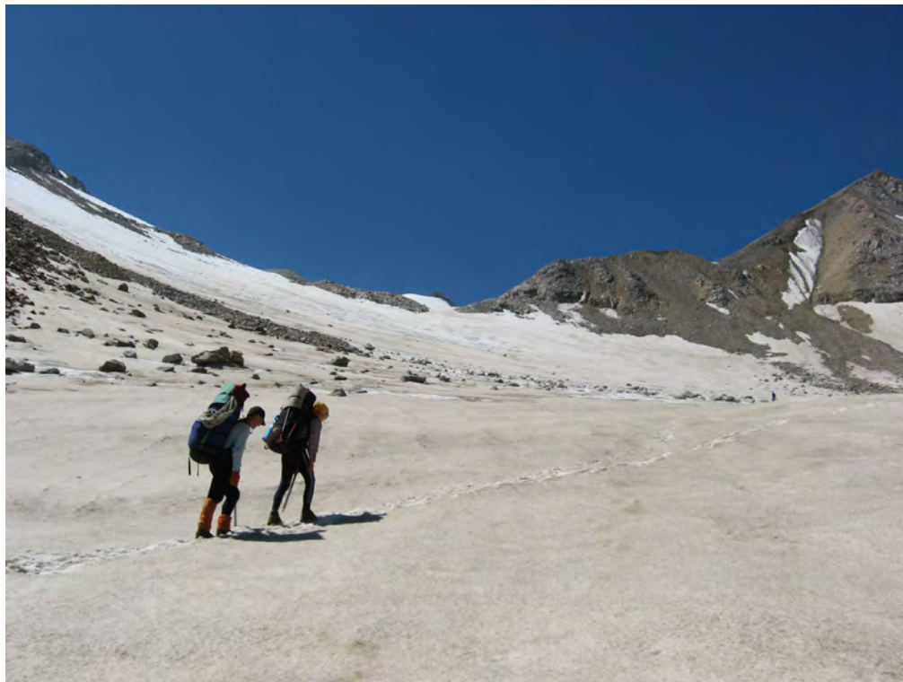
Фото 3. Лед. Булунгу. – к пер. Тютюргу Вост. (1Б).