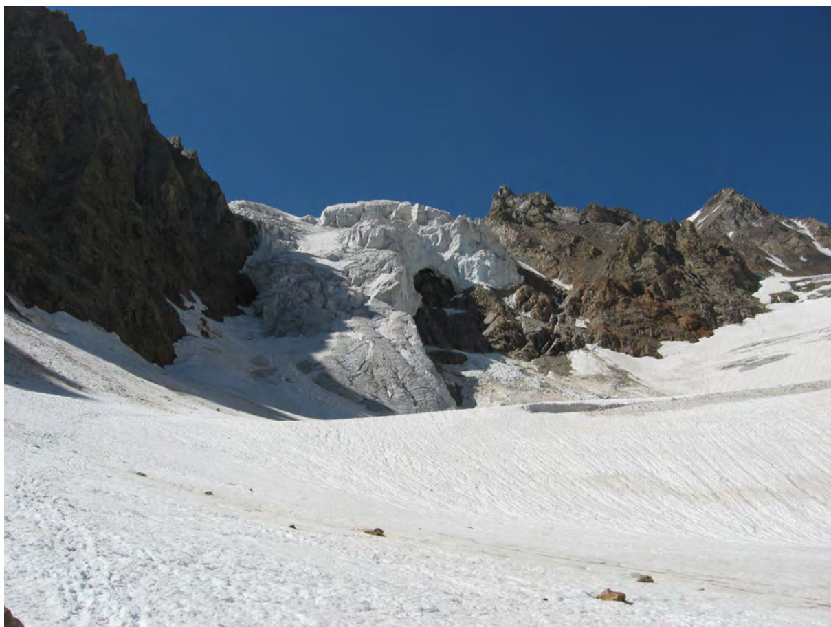
Фото 43. Путь спуска с пер. Камнепадный (2Б) ( ) на лед. Башхаауз.