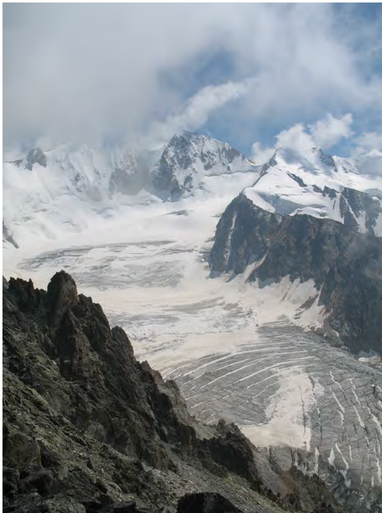
Фото 7. Верховье лед. Тютюргу. 1 – вер. МВТУ, 2 – пер. Шаурту Вост. (2А). Путь подъема к пер. Шаурту Вост. (2А). Фото с пер. Тютюргу Вост. (1Б).