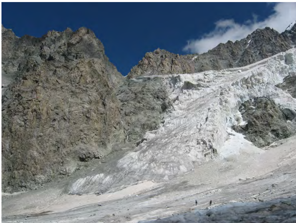
Фото 57. Подъем на пер. Шести (2А) ( ).