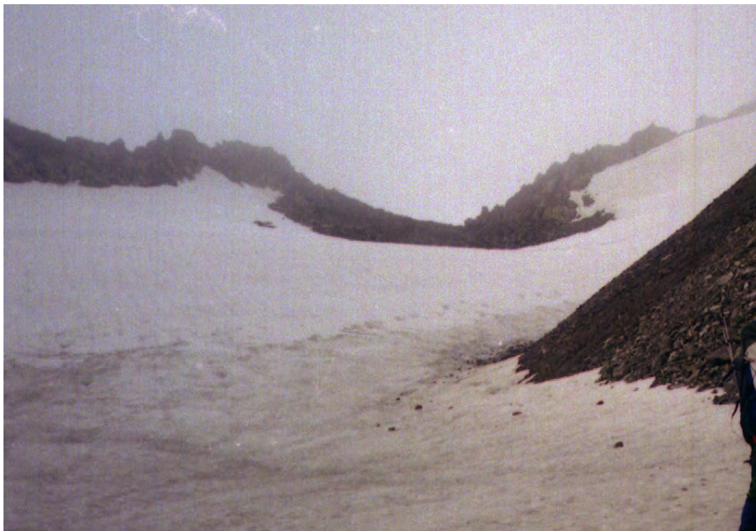
Фото 53. Пер. Рцывашки (1Б, 3540). Фото с лед. Рцывашки.