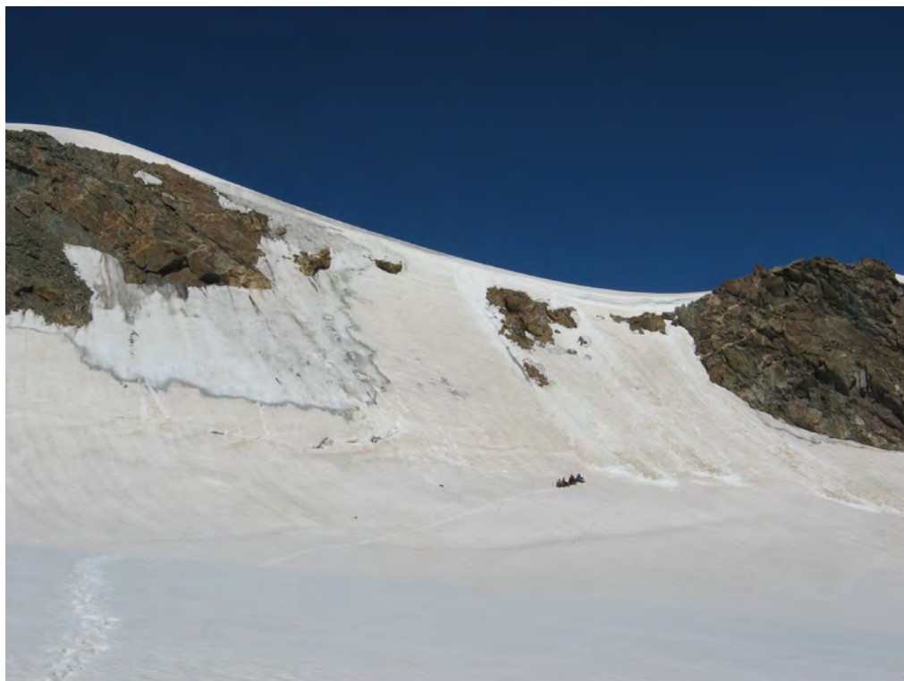
Фото 11. На лед. Тютюргу. Група под отрогом (т. 1 на фото 10).