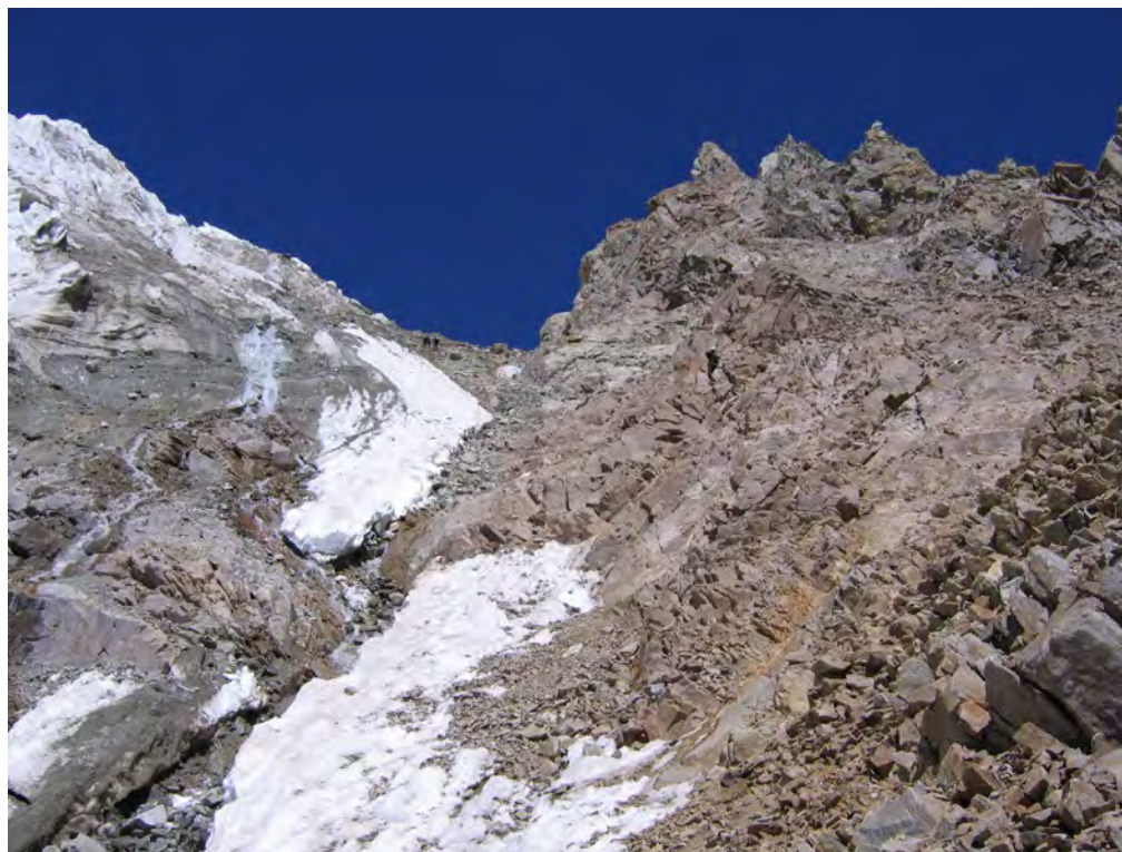
Фото 38. Путь спуска с пер. Камнепадный (2Б).