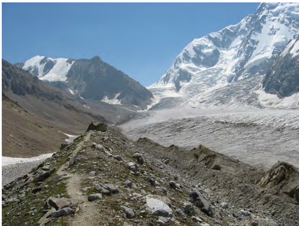
Фото 33. Подъем к Джангикошу (Δ). Путь подъема к верховьям лед. Безенги. – к пер. Дыхниауш (2Б).