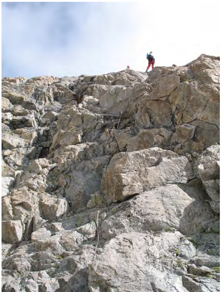
Фото 27. Первая веревка на спуске по скалам.