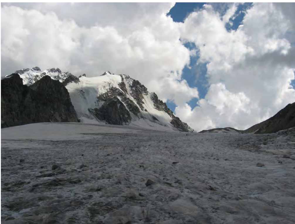
Фото 66. Пер. Шести (2А) с лед. С. Суган. Путь спуска.