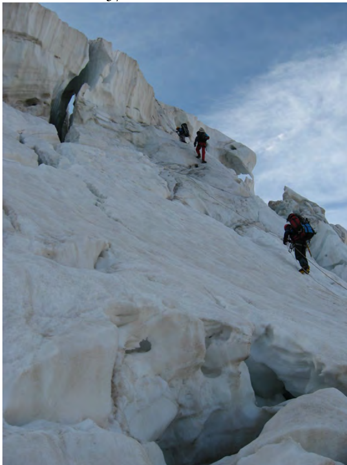
Фото 61. Подъем по навешенным с вечера перилам.