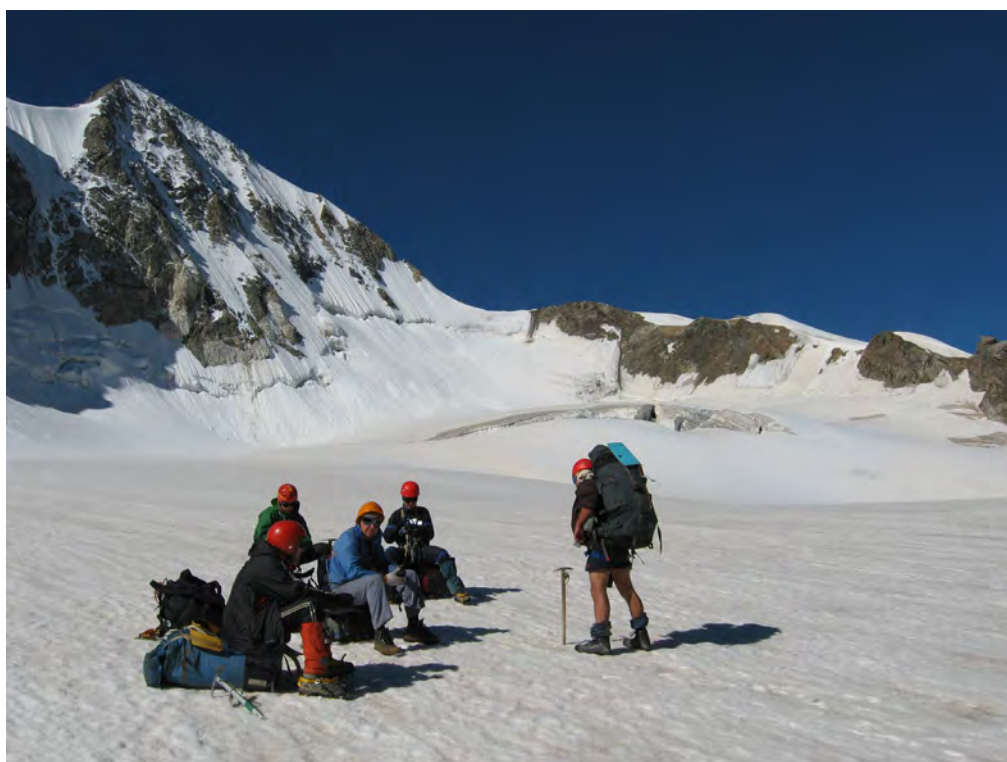
Фото 10. На лед. Тютюргу. Путь подъема на пер. Шаурту Вост. (2А) (↓). 1-2 – участок перил (фото 11).