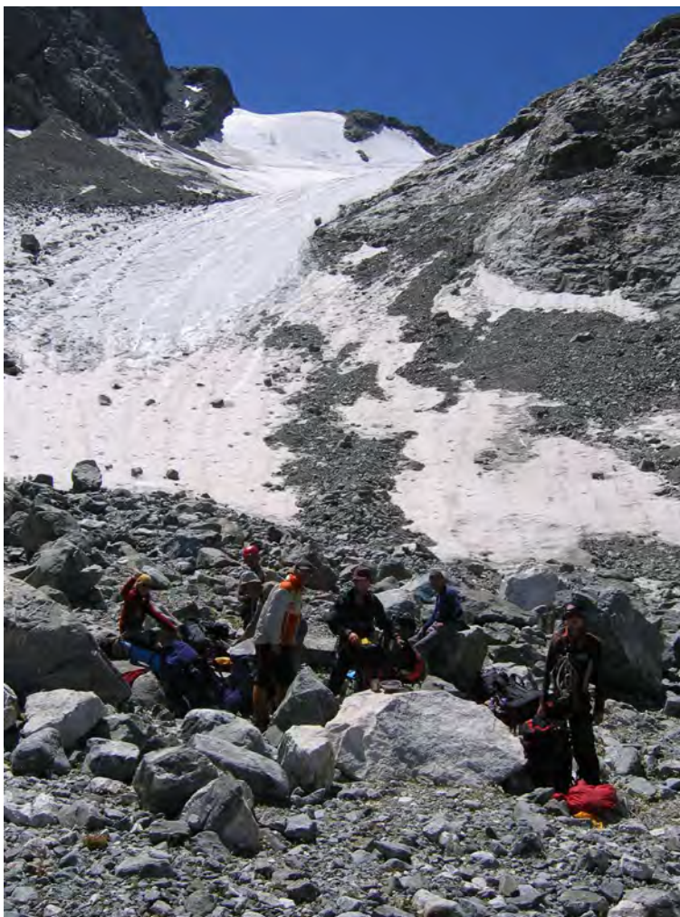
Фото 55. Место ночевки на лед. Рцывашки.