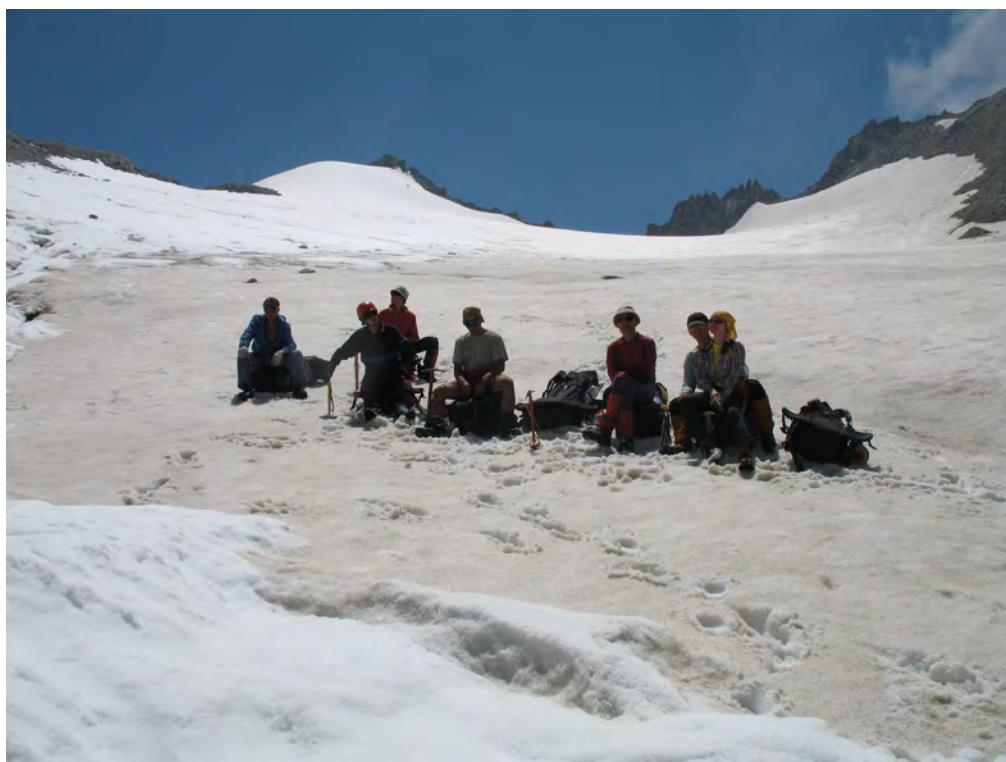
Фото 4. Верхний цирк лед. Булунгу. ↓ – пер. Тютюргу Вост. (1Б).