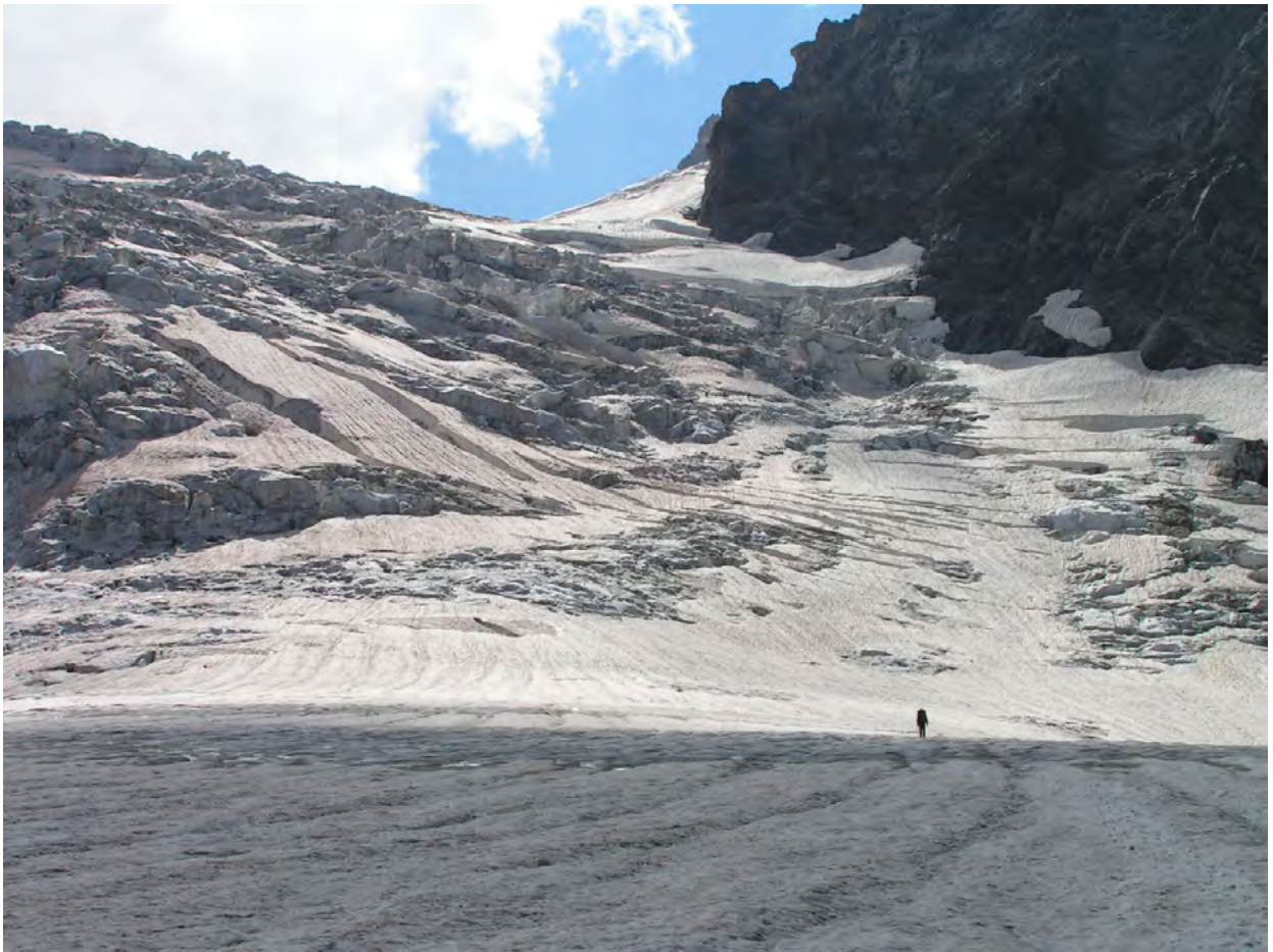
Каракайський льдоспад зі спуску (з льодовика Башиль)

На правосторонній морені Східного Башиля є чудові місця для наметів. Але ми, за звичкою, вирили свої, не менш зручні та великі. Вода є на льодовику. Нижче розташувалась бачена нами раніше група з Санкт-Петербургу. Вони ідуть практично такий-же маршрут, тільки назустріч. Група складається з молодих та зелених... ☺, під керівництвом двох дуже приємних інструкторів. Провели експрес-засідання по обміну враженнями та знаннями з пройдених перевалів. Для продовження нашої приємної традиції (по здобуттю спорядження) вони залишили нам на перевалі Кітлод мотузочку, так метрів на 30. Дякуємо, буде дуже приємно, як встигнемо забрати ☺.