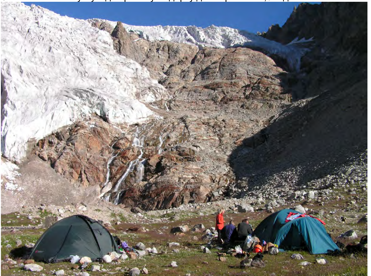
Ночівля біля великого крижаного озера, позаду льодовик Бадорку

Подальший спуск з перевалів Бадорку та Чат в долину Гараузсу співпадає. Спочатку йдемо по центру, а потім беремо вліво до краю некрутого льодовика. Внизу добре проглядається велике крижане озеро (на жаль, його назву не знайшли), температура води +5. Спускаємось до нього по неприємній рухливій сипусі. Недалеко від озера є багато місць під намети. Тут і стаємо на ніч. Загальний час спуску від перевалу Бадорку до озера — 4-4,5 години.