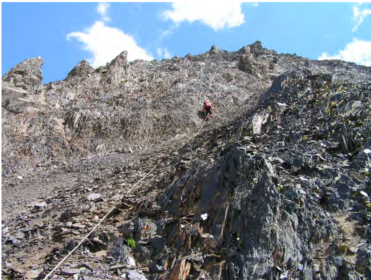
Маршрут по сипучих скелях на пер. Кітлод

нього. Льодовик відкритий, ідемо без кішок. Необхідний нам перевал знаходиться зліва по ходу. Посеред льодовика є класна чорна сипуха. Перевальних сідловин декілька. Найбільш простий шлях лежить через трапецевидну вершину, розташовану на широкій ділянці (до 1км) гребня, інші шляхи більш складні.