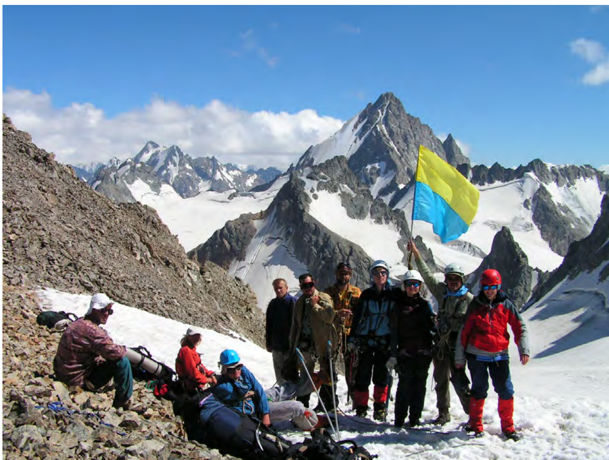
на пер. Грановського, справа пер. Башильаузи, по центру в. Башиль

Перевал Грановського 3759 м, 2 А, на перевалі є руді скелі, тур на скелях. Піднялись о 15 год. Зняли записку харківчан від 31.07.06. Погода чудова.