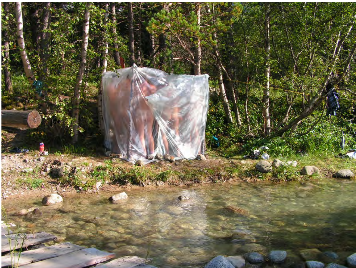
Баня на дньовці