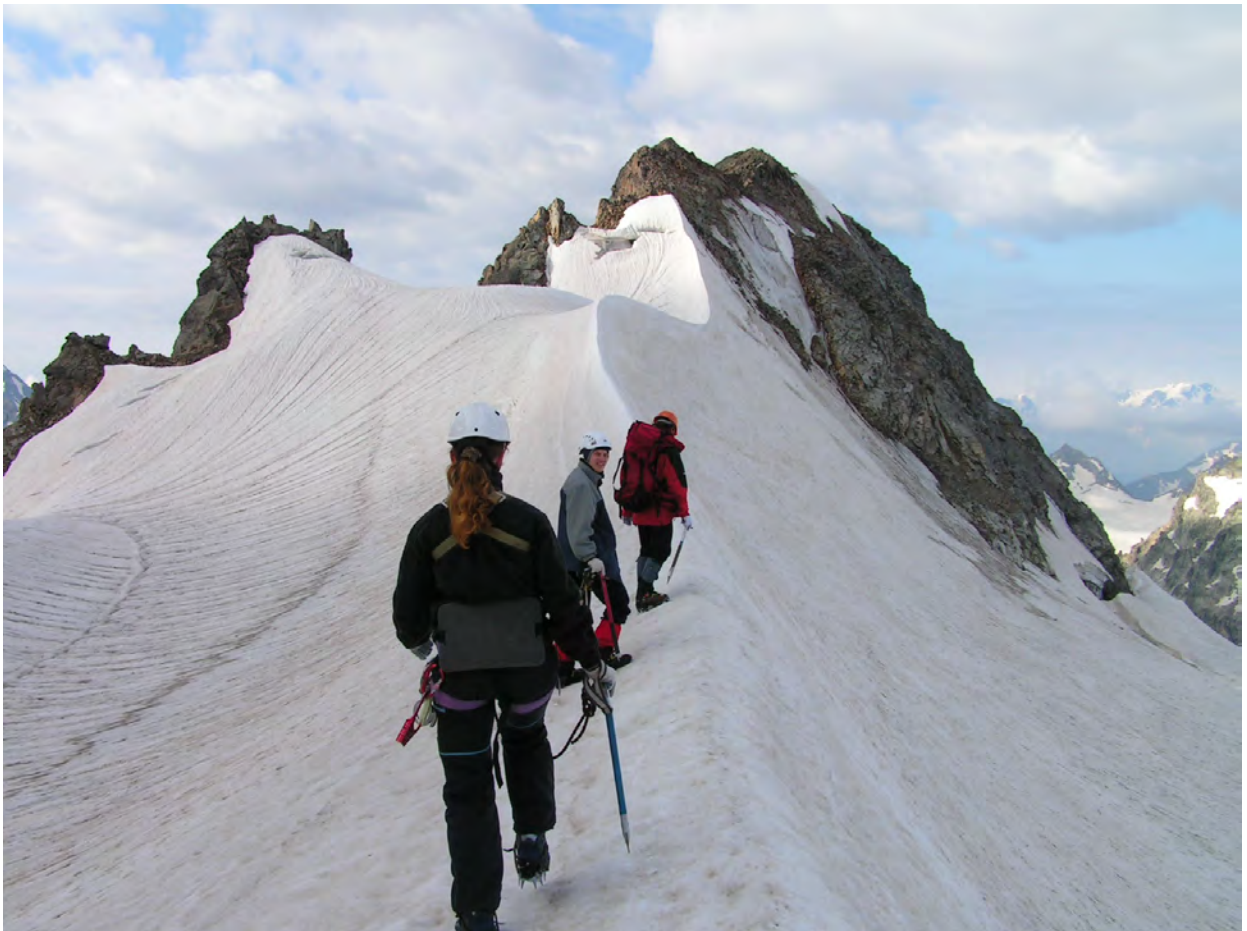
Розвідка, зліва по ходу камнеопасті кулуари правого контрфорсу пер. Україна

Рухаємось до місця суттєвого зниження хребта (від табору близько 700-800м), лівим краєм плато. Ідемо в кішках, без зв'язок. З перемички (тут їх дві) правого контрфорса відкрився чудовий вид на грузинське поселення Местіа, що розкинулося далеко вниз. З протилежного боку добре проглядався маршрут групи, яка на той час штурмувала вер. Джантуган, та невдовзі була вимушена спускатись на плато. У одній із скелястих сідловин знайшли записку групи туристів-географів м. Санкт-Петербург від 17.08.03. (в записці сідловину назвали "предположительно Джантуган Восточный".)