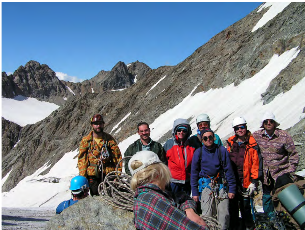
На пер. Джантуган зах., позаду пер. Гумачі

передпривальний бергшрунд, розірваний в багатьох місцях. Висота 3-5 м. Перший за допомогою 2-х льодорубів долає перешкоду і закріплює перила. Підйом з рюкзаком важкий, тому учасники піднімались без багажу. Для прискорення процесу, все таки 11 чоловік, провішують 2-у паралельну мотузку перил. Після подолання перешкоди рух продовжуємо у зв'язках. До перевалу 200м по снігу. Джантуган східний (3480, 2Б). На перевал піднялись о 16 годині. Зняли записку туристів тур-клубу МГТУ ім. Баумана від 19.08.05, а також групи альпіністів-розрядників альпініади Кубані від 15.07.06 (цій записці перевал названо "Ложные Гумачи"). Сідловина перевалу скельна. Тур справа по ходу. Вид з перевалу обмежений. Добре видні перевал Гумачі та водоспад з нього, що знаходяться набагато нижче, з іншої сторони — вершина та перевал Башкара, плато Джантуган. Огляд зверху показує розумне поєднання проходження 2-х перевалів (Гумачі — Джантуган східний). Зі сторони спуску(на плато Джантуган) до перевалу прилягає глибока мульда. Спуск займає 5-7 хв. по границі скель та льодовика, в ній розбиваємо табір. Вода є на схилах, на ніч замерзає.