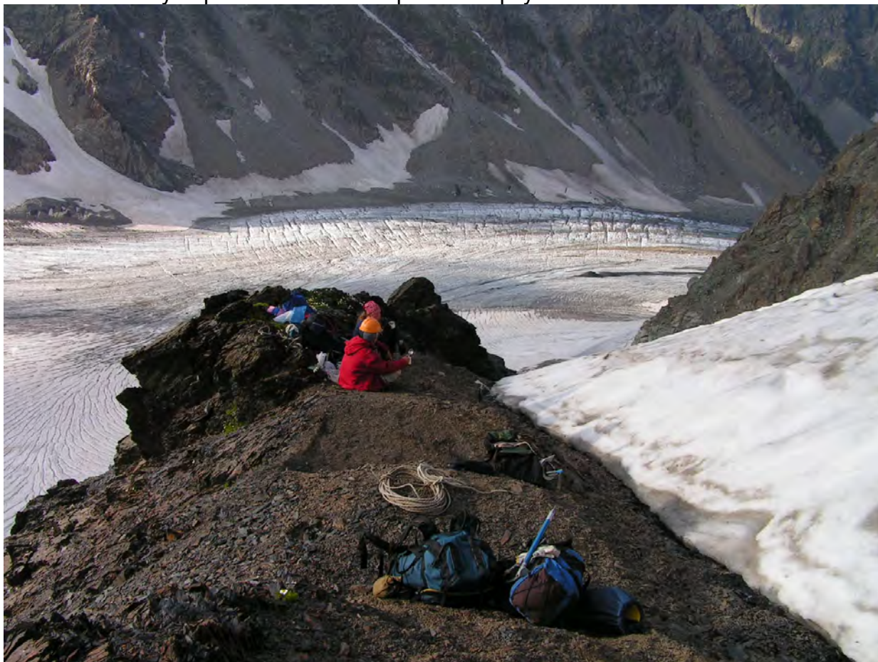
Ночівля на гребні під перевалом Кітлод

мотузок до виполажування. Кріпимо на петлях та швелерах. Тут іде межа лівого сніжного схилу вершинки та скель правого борту.