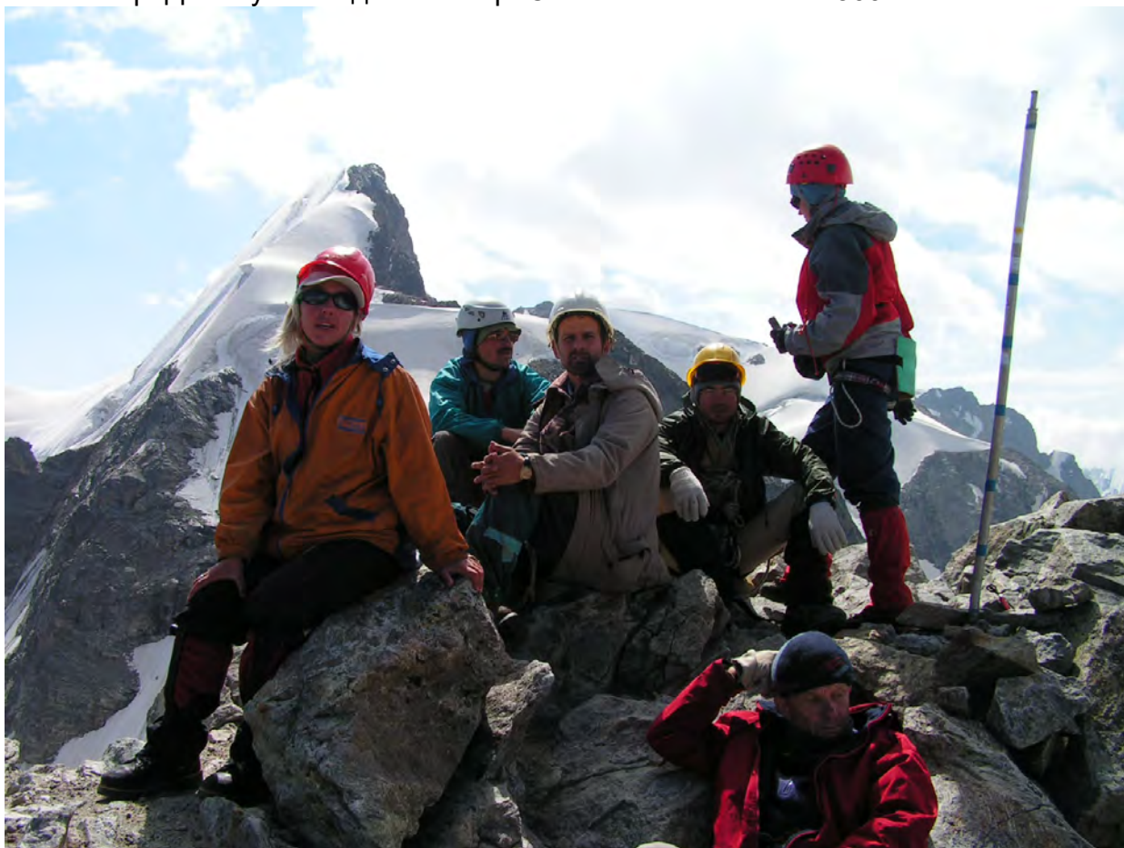
На вершині Гумачі, позаду вершина Чегет-Тау-Чат

підрізані бергшрундами, особливо зі сторони пер. Україна. На пер. Джантуган східний фотографувалась група, ще одна підходила до бергшрунда. Перепад висоти пер. Джантуган східний — пер. Оптимальний близько 300 м.