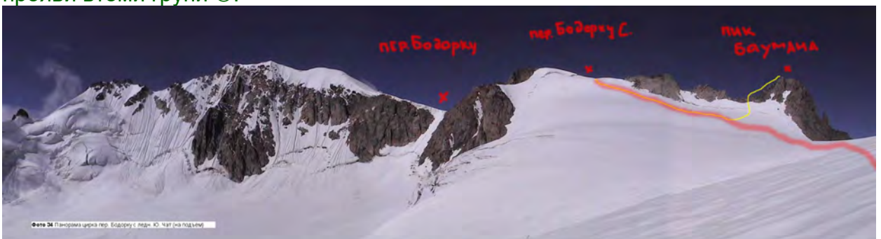
Спуск з пер.Бадорку північний, правіше піка Баумана пер. Чат