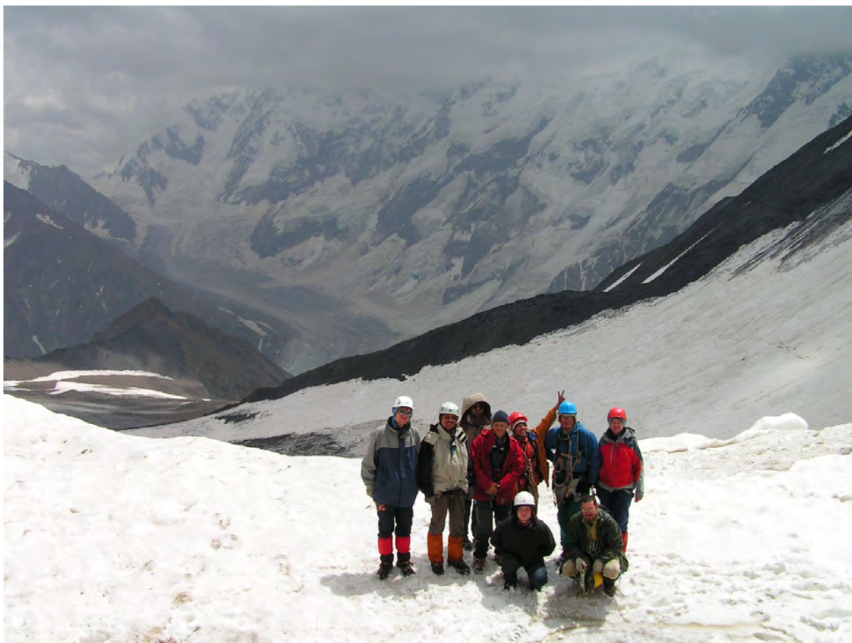
На пер.Верх. Цаннер, зліва внизу пер.Кель, справа Безенгійська стіна

09.08.06 середа. Перевали Верхній Цаннер (3990, 2А) і Кель (3600, 1А)