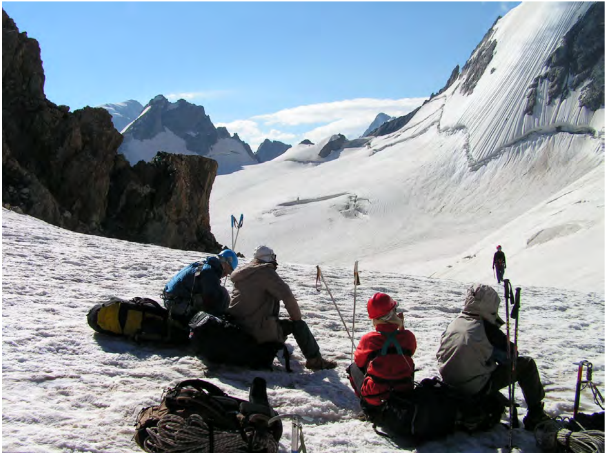
на пер. Каракая, справа в. Башиль

Спуск розпочали о 9:40. На сніжній частині сідловини гарний ранклюфт, обходимо його біля скель по сніжному мосту. Рухаємось у зв'язках. Через 10 хв. виходимо на плато, з якого можна підніматись на перевали Ласхедар та Лекзир. Спуск в долину Башиля розпочали з лівого краю Каракайського льодоспаду.