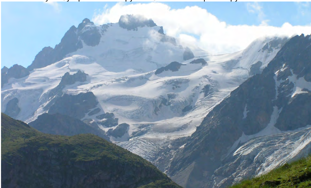
в. Сарикол, Кіт(з Местійською хіжиною), пер.Местійський з ночівлі під Гумачами

На виході з табору фейсконтрол. Стежка до хатини стелиться по правому березі р. Адирсу. На початку плавний набір висоти. Попереду світиться білосніжна Уллутау. Дерева закінчуються практично відразу за табором. Далі стеляться альпійські луки. Зустрічаються струмки. Стежина забирає вгору.