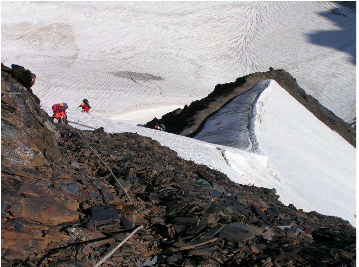
Останні метри підйому на пер. Кітлод