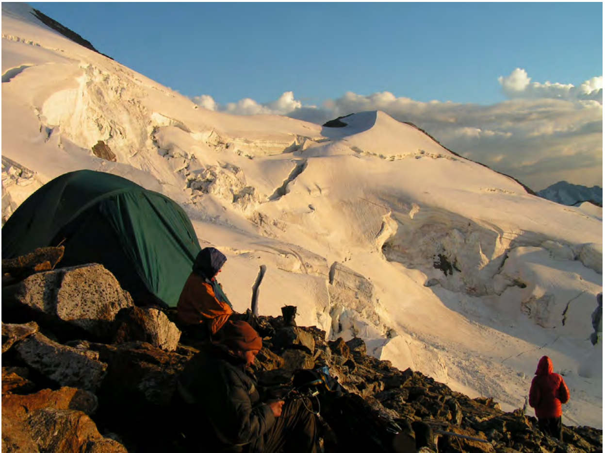
Ночівля під пер. Бадорку на скелях

Риємо плацдарм. Поряд розташувались два 3-місні намети з кухнею. Відтепер і на схилах Бадорку зі сторони долини Башиля є місця для ночівлі ☺, водичка поряд. Перед вечерею провішуємо 3 мотузки по фірну та кризі до перевалу. Середній кут нахилу становить 35-40 гр.