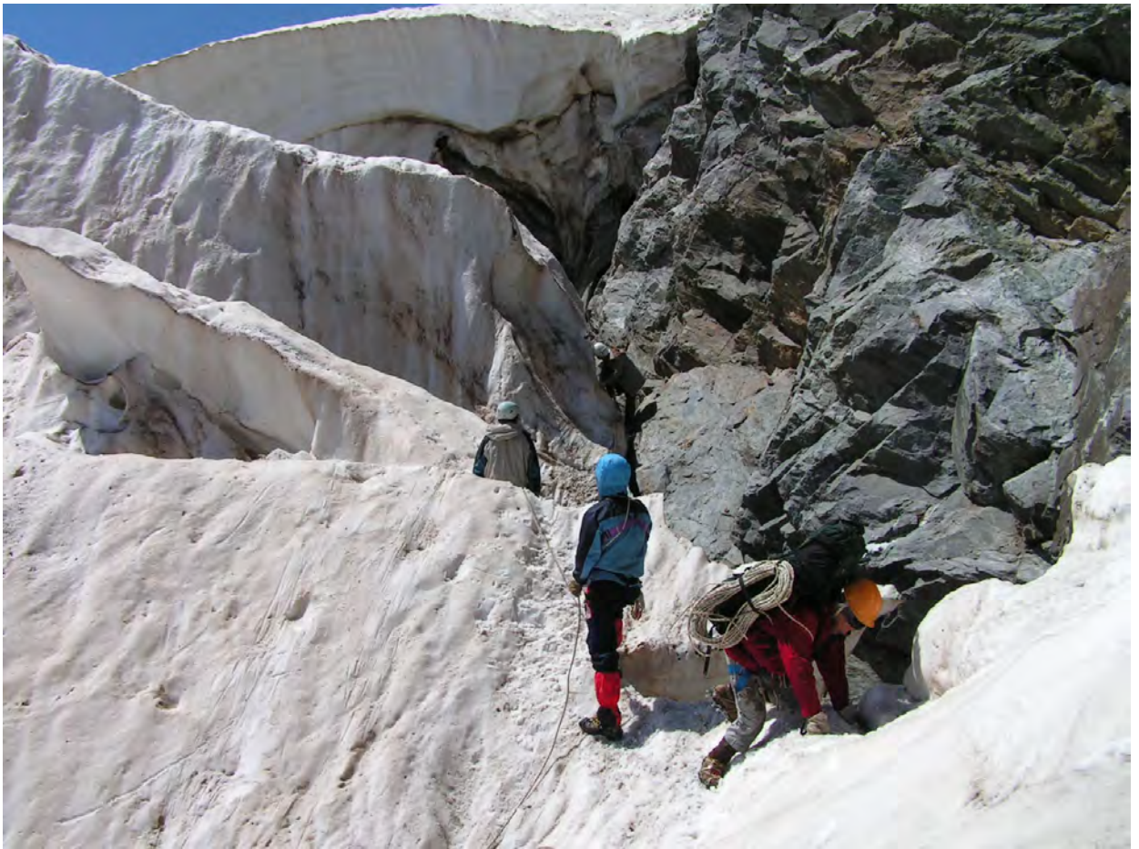
перехід через лівобережні ранткльофти Каракайського льдоспаду