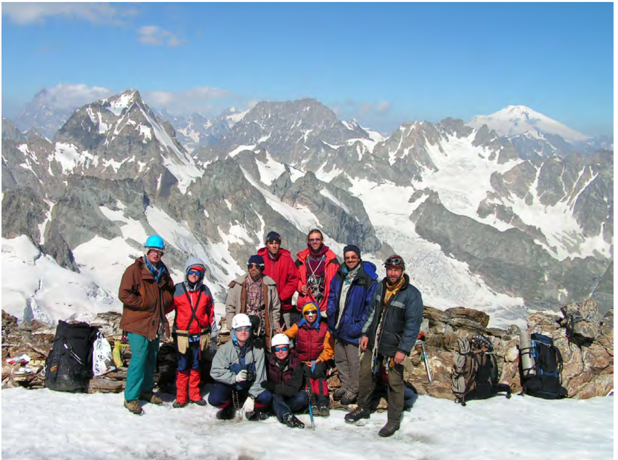
на пер. Бадорку, позаду Каракайський льдоспад