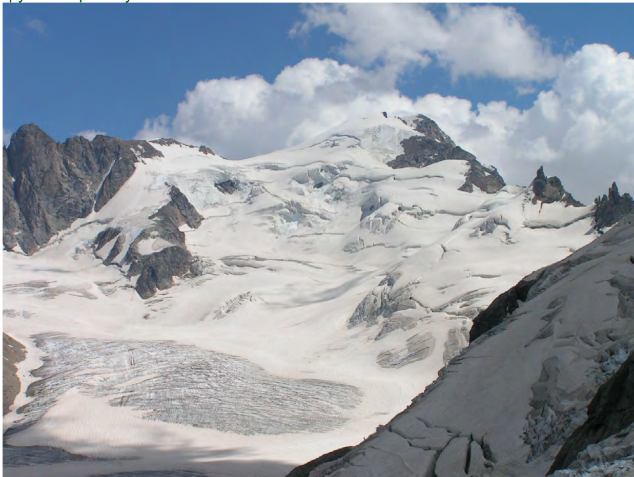
пер. Бадорку північний та південний, в. Бадорку з Каракайського льдоспаду

порваний і прикритий сніжком, що малюнок нашого пересування по ньому напрочуд точно відобразив бігову доріжку довговухого ☺. Спостерігаємо спуск групи з перевалу.