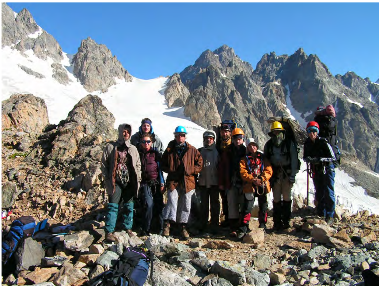
на пер. Башиль-Ауз східний, позаду пер.Грановського

Рух продовжуємо по лівому краю льодовика Башиль Західний в сторону перевалу Башильтау західний. Загальний час спуску у зв'язках 20-30 хв. Льодовик закритий, є тріщини. Підходимо приблизно на середину підйому на перевал. Схил крутий. Східний перевал небезпечний через можливість сходу „чемоданів”, до того ж необхідно скинути висоту, щоб підійти до нього. Вирішили підійматись на західну сідловину (так званий Башильтау несправжній або ложний). Провішуємо 3 мотузки (близько 100 м) траверсу до сипучого схилу, що веде на перевал. По ламаним скелям ще 15-20 хв. ходу.