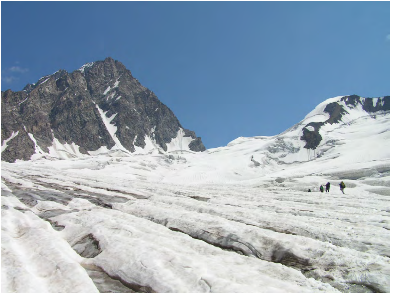
пер. Семи з льдовика Кітлод