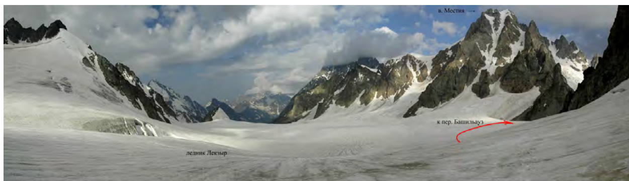
фото 76. Вид с перевала Кара-Кая на запад, на ледник Лекзир.

Перевал Кара-Кая — 3500 м., 2 Б, зі сторони Башильауз, тобто зліва по ходу, до перевалу прилягають пологі скелі. На них вириті невеличкі місця для двомісних наметів, поряд стоїть тур. Води немає. Зняли записку туристів з МГУ від 11.08.04 під кер. Зеленцовой Е. З перевалу чудовий вид на долину Лекзир та вер. Башиль.