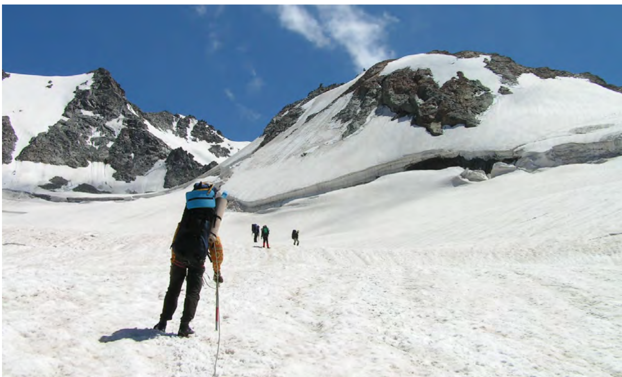
Підйом на пер. Джантуган зах. з долини р.Адил-су