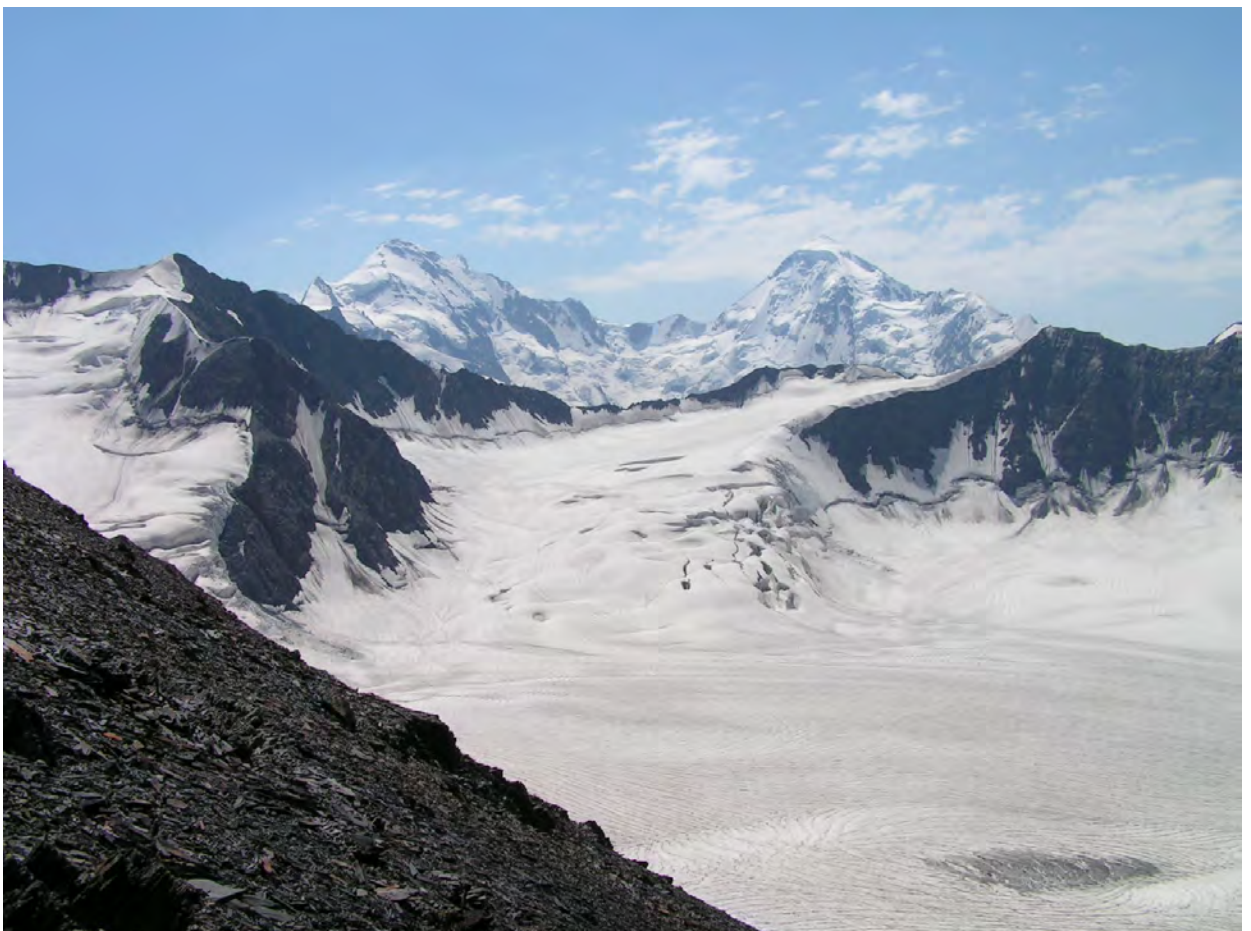
пер. 50 лет Октября, пер.Добровольського та в.Тетнульд (на задньому плані) з пер. Кітлод