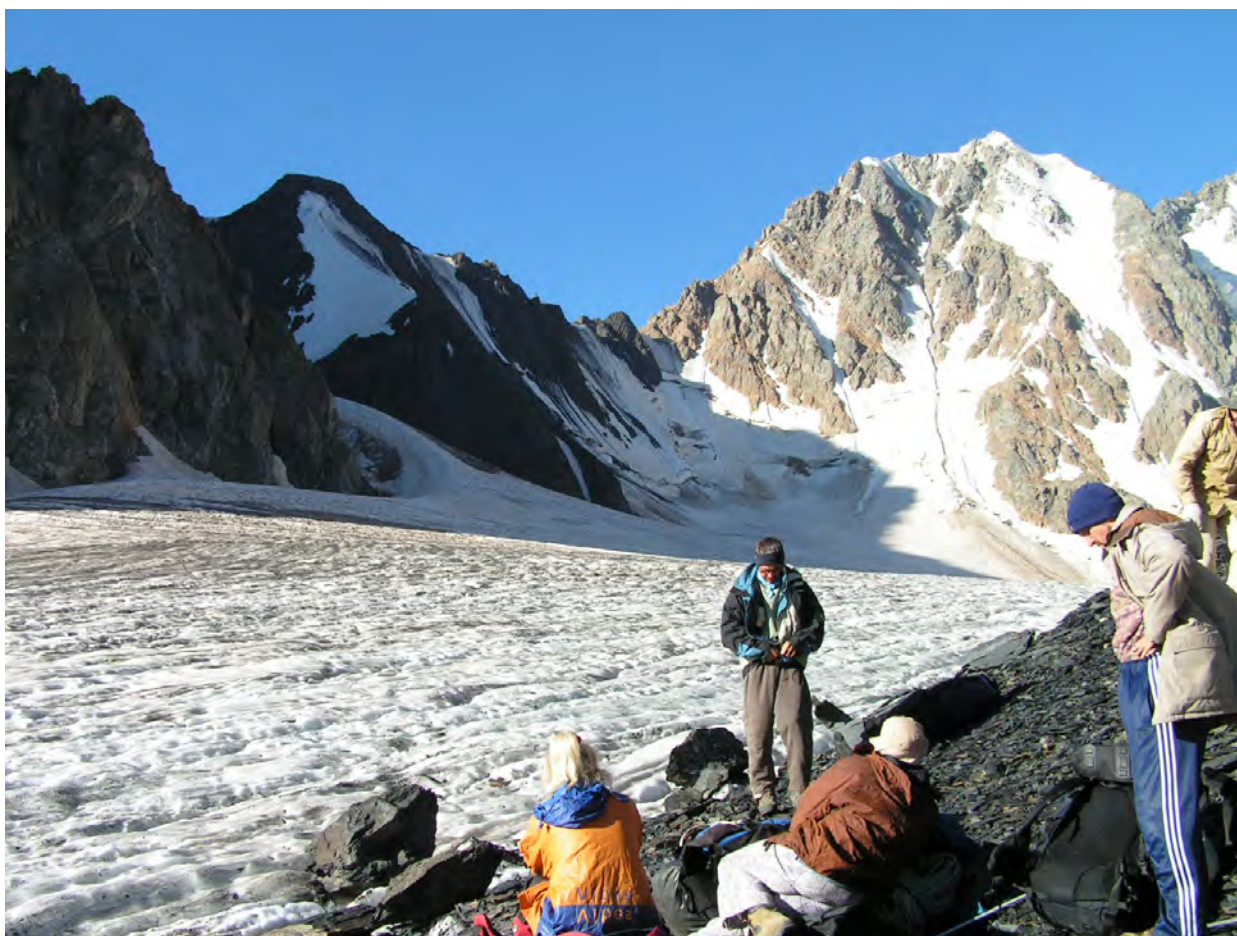
Попереду трапезевідна вершинка пер. Кітлод

07.08.06 понеділок. Штурм пер. Кітлод (3700, 2Б)