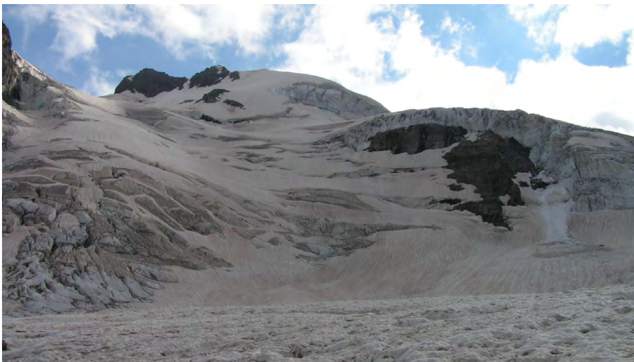
пер. Україна, пер.Оптимальний, в. Гумачі з льодовика Гумачі

Вихід о 8:30. Піднімаємось з мульди в сторони пер. Оптимальний. Далі рухаємось до сніжного моста через бергшрунд, яким проходили вчора. Рух в кішках, без зв'язок. Льодовик покритий фірном. Піднімаємось тим же шляхом, що і вчора. На перевал зайшли за 1 годину ходового часу з місця ночівлі. Поки готується чай, провішуються перила на спуск на льодовик Гумачі, в долину р. Адирсу. З перевалу спуск іде по сніжному схилу 50-55 гр. Далі схил менш крутий, але рух продовжуємо у зв'язках. Ідемо траверсом вліво вниз в сторону невеликого скельного виступу. Паралельно нам з в. Гумачі в сторону перевалу Гумачі рухається група.