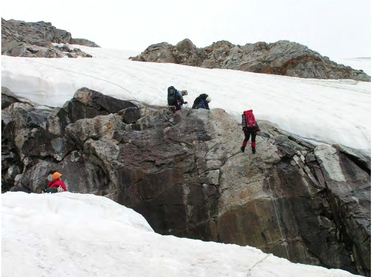
Елемент спуска на льодовик Гумачі

Через 40 хв., після подолання бергшрунда сніжник закінчується, і ми виходимо на лівий сипучий схил. Незабаром проглядається стежка, що виводить на лівобережну морену. По ній і продовжуємо рух. Зустрічаються місця для палаток, але поблизу немає води (це так звані “Ночевки Гумачи”). Приблизно через 30 хв. руху по стежці виходимо на зелений бугор з великою кількістю місць під намети. Тут води немає, але вниз по стежці 3-5 хв. (300 м.) є невеличке джерело. Тут і залишаємо на ніч. Загальний час спуску від останніх перил до місця ночівлі складає 2-2,5 години.