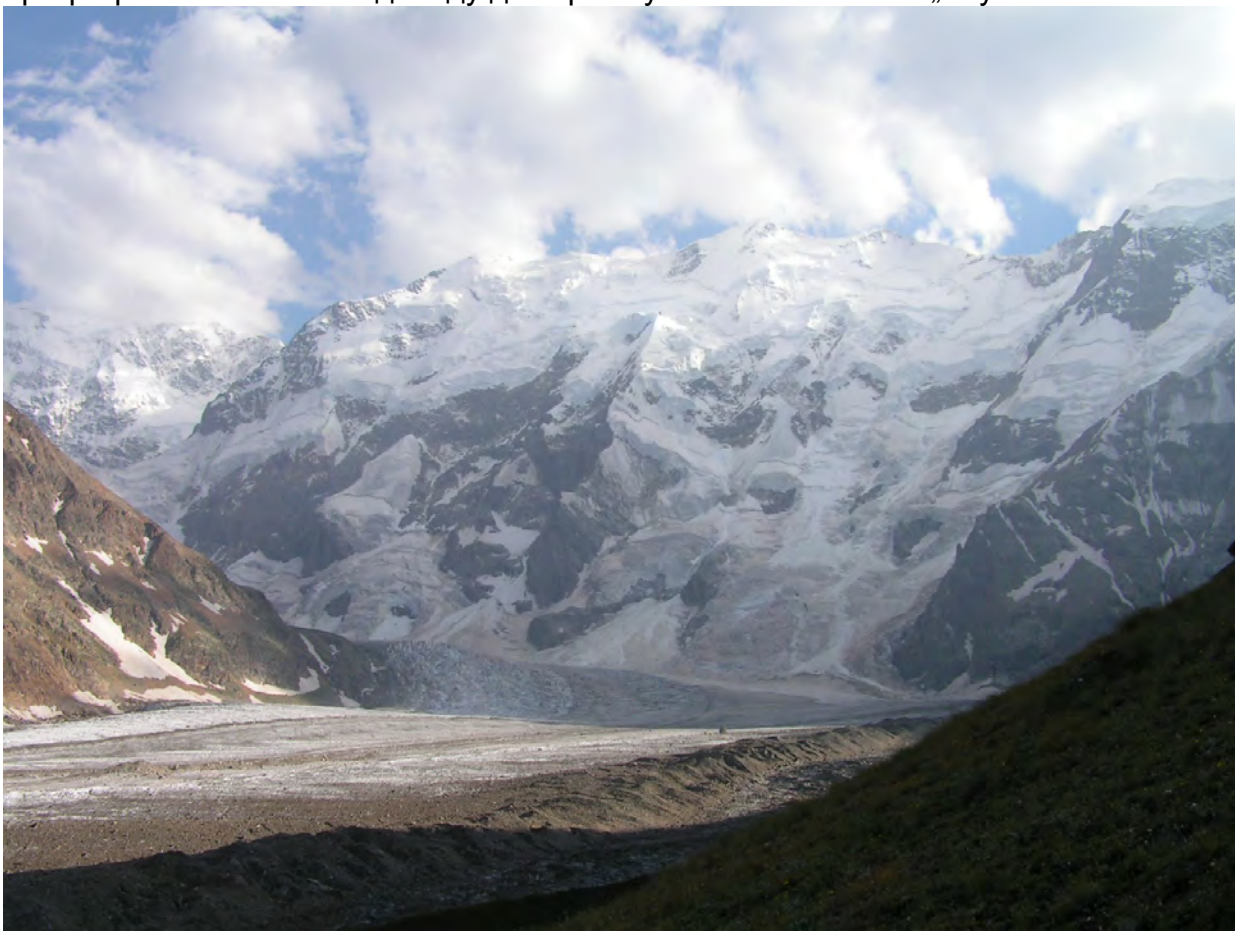
Стіна, та сама

Від площадки вниз веде стежка. Через 7-10 хв. прості сланцеві скелі 10-15 м. Потім знову мілко-дисперсний сипучий схил. По ньому з'їжджаємо на п'ятках в зелений карман, утворений лівобережною мореною льодовика Безенгі та орографічним схилом. Від обіду до карману 40-60 хв. чистого „бігу”.