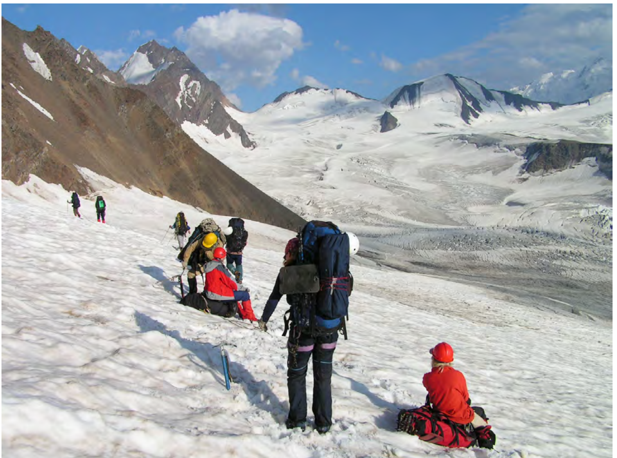
Спуск з пер.Семи в напрямку пер.Верх. Цаннер, зліва внизу місця для ночівлі