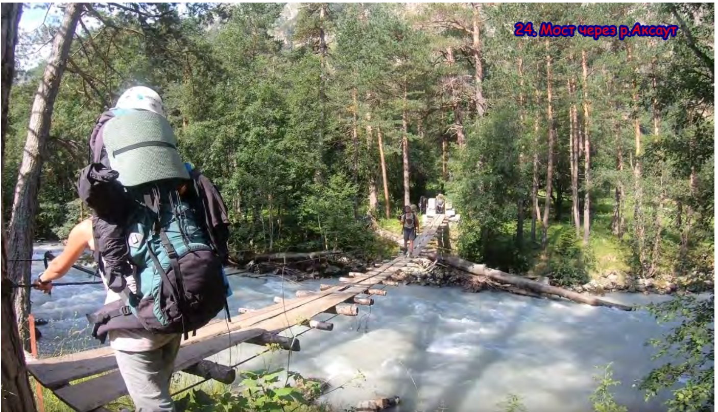
24. Мост через р.Аксаут