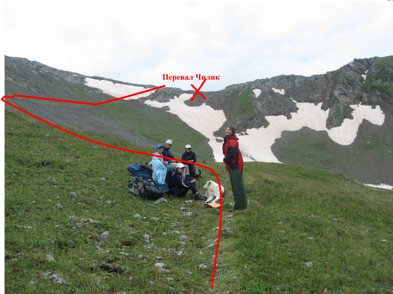
День 7. Подход к перевалу Чилик