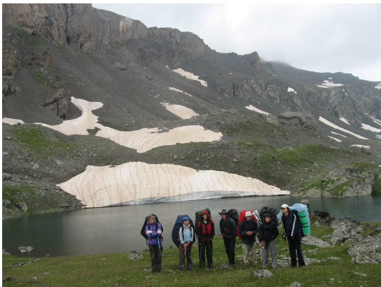
День 2. Озеро под перевалом Малый Кяфарский