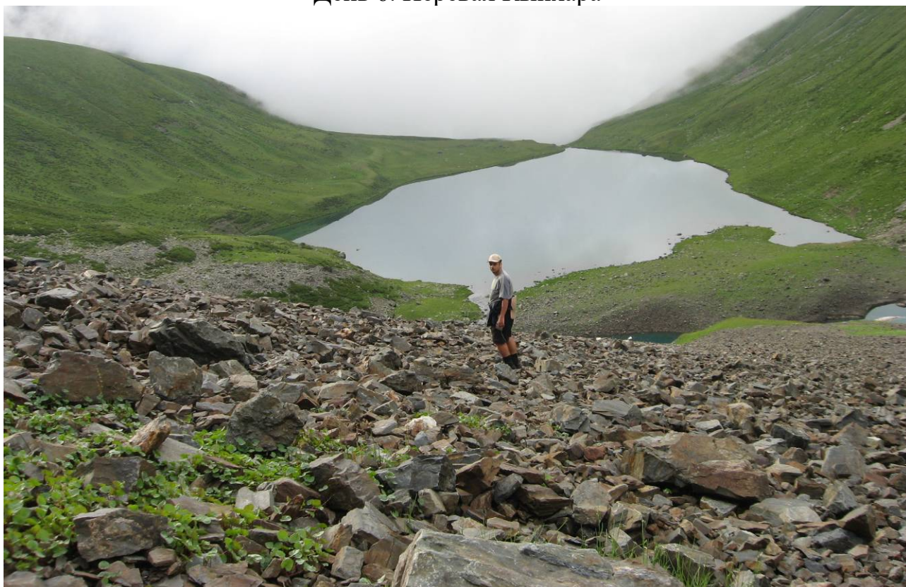
День 6. Озеро Чилик