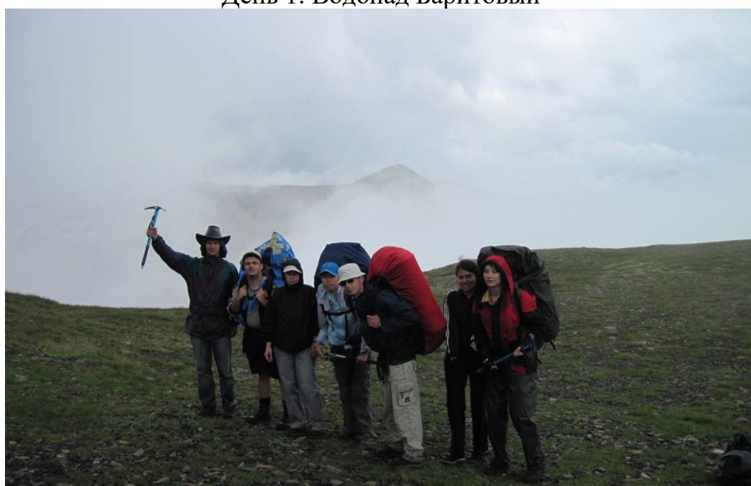
День 2. Перевал Малый Кяфарский