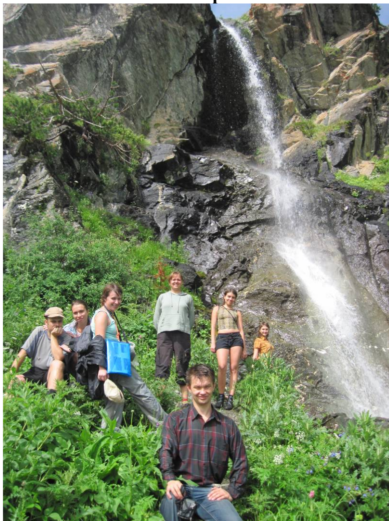
День 1. Водопад Баритовый