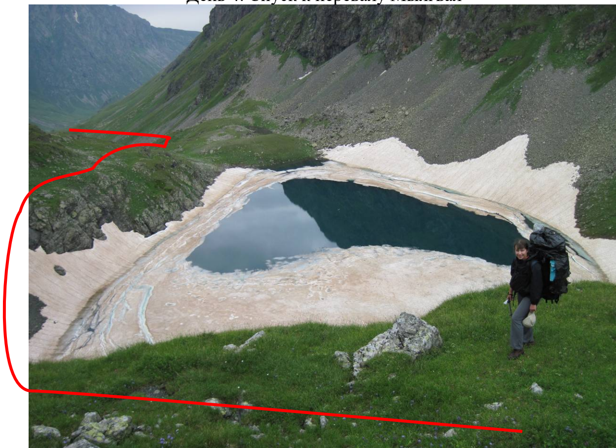
День 5. Спуск с перевала Мылгвал