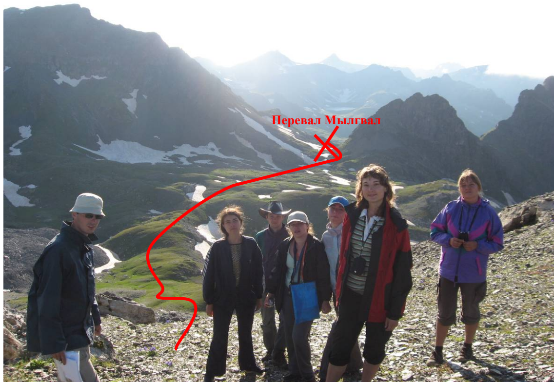
День 4. Вид с перевала Агур на перевал Мылгвал