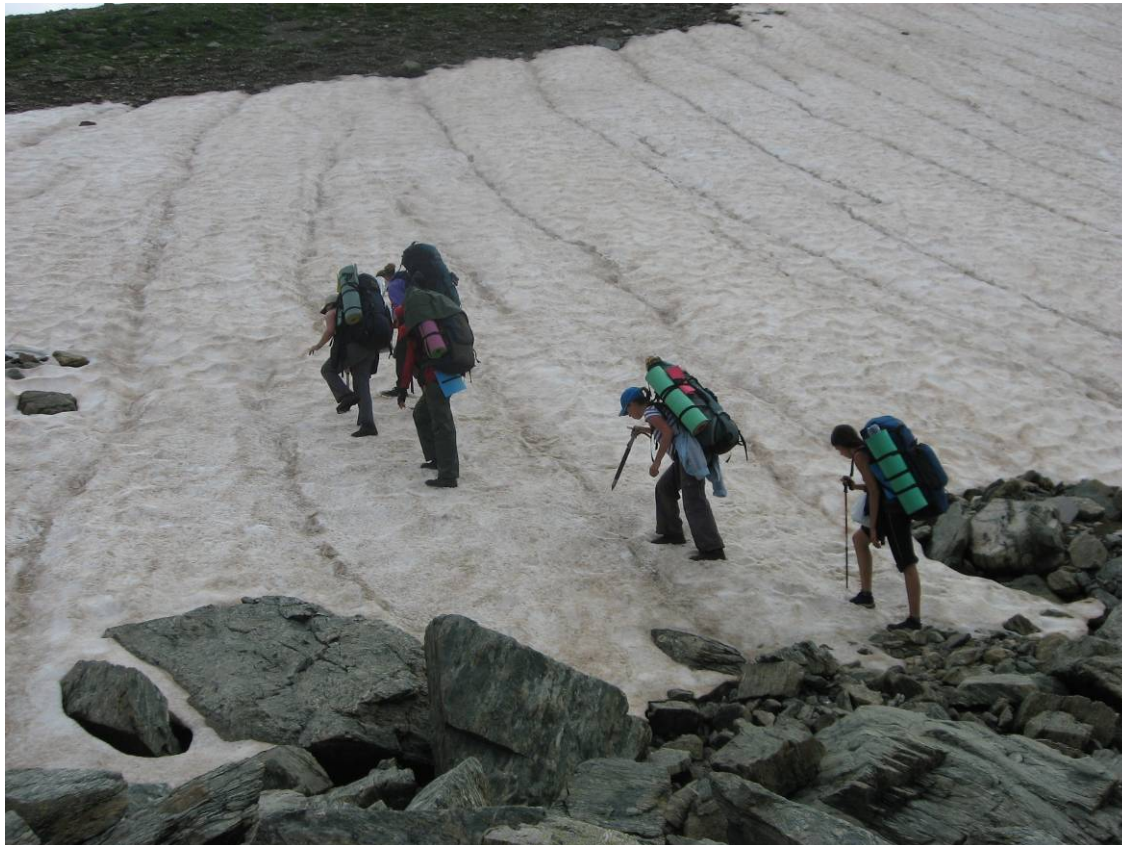
День 4. Движение по снежнику к перевалу Агур.