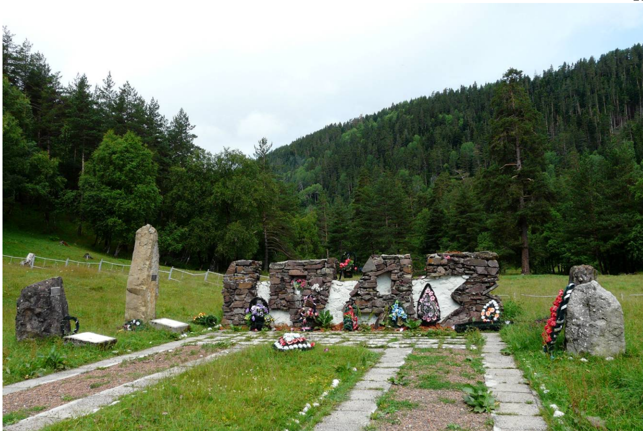
День 10. Памятник военным действиям на Кавказе.