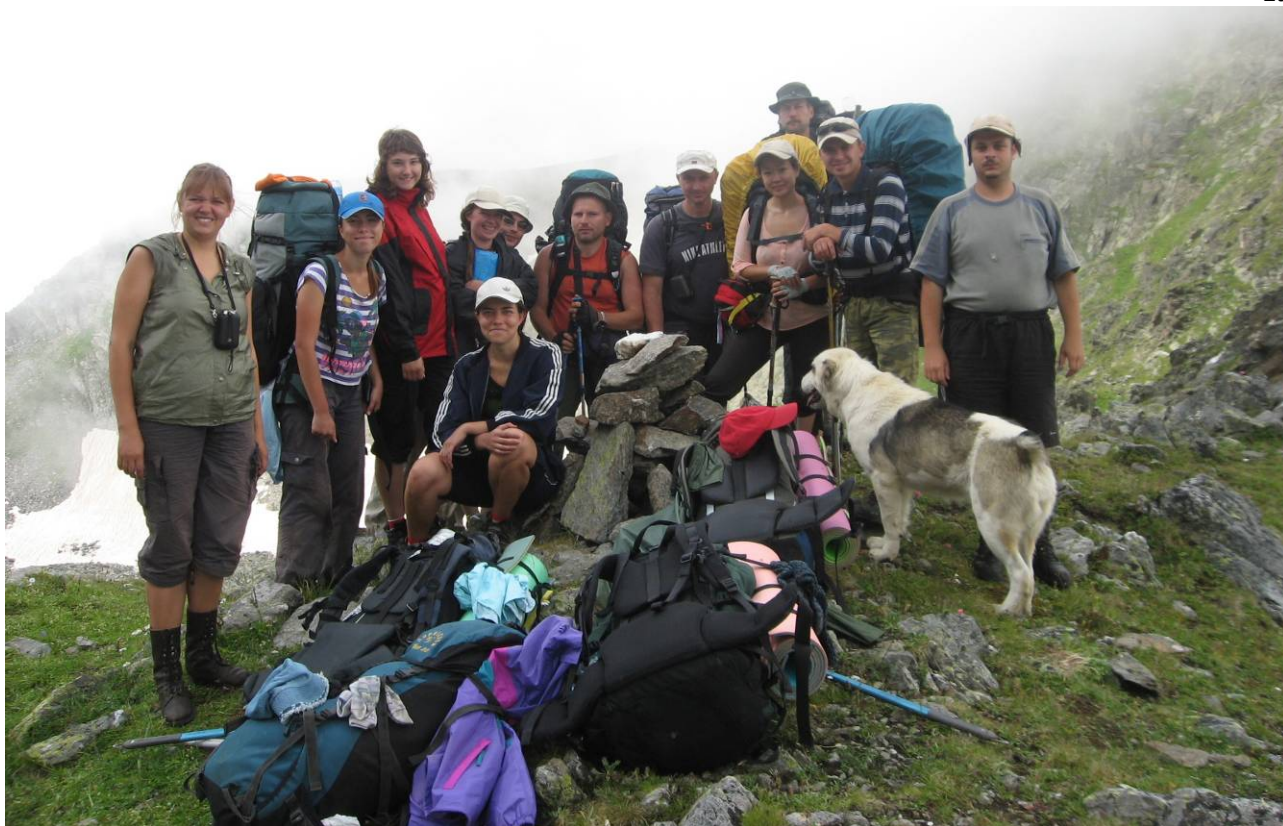
День 6. Перевал Кынхара