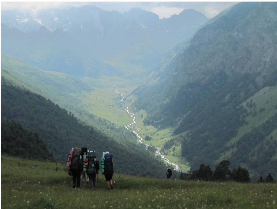
День 3. Спуск к ущелью реки Кяфар-Агур с хребта Кафагурский