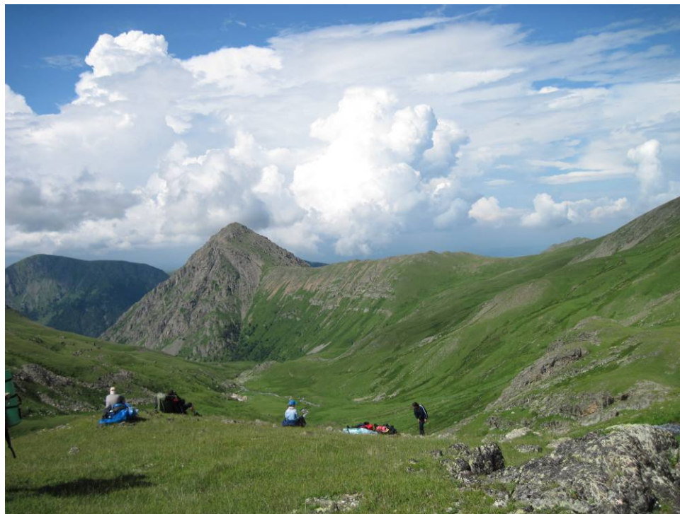
День 2. Медвежье Ущелье