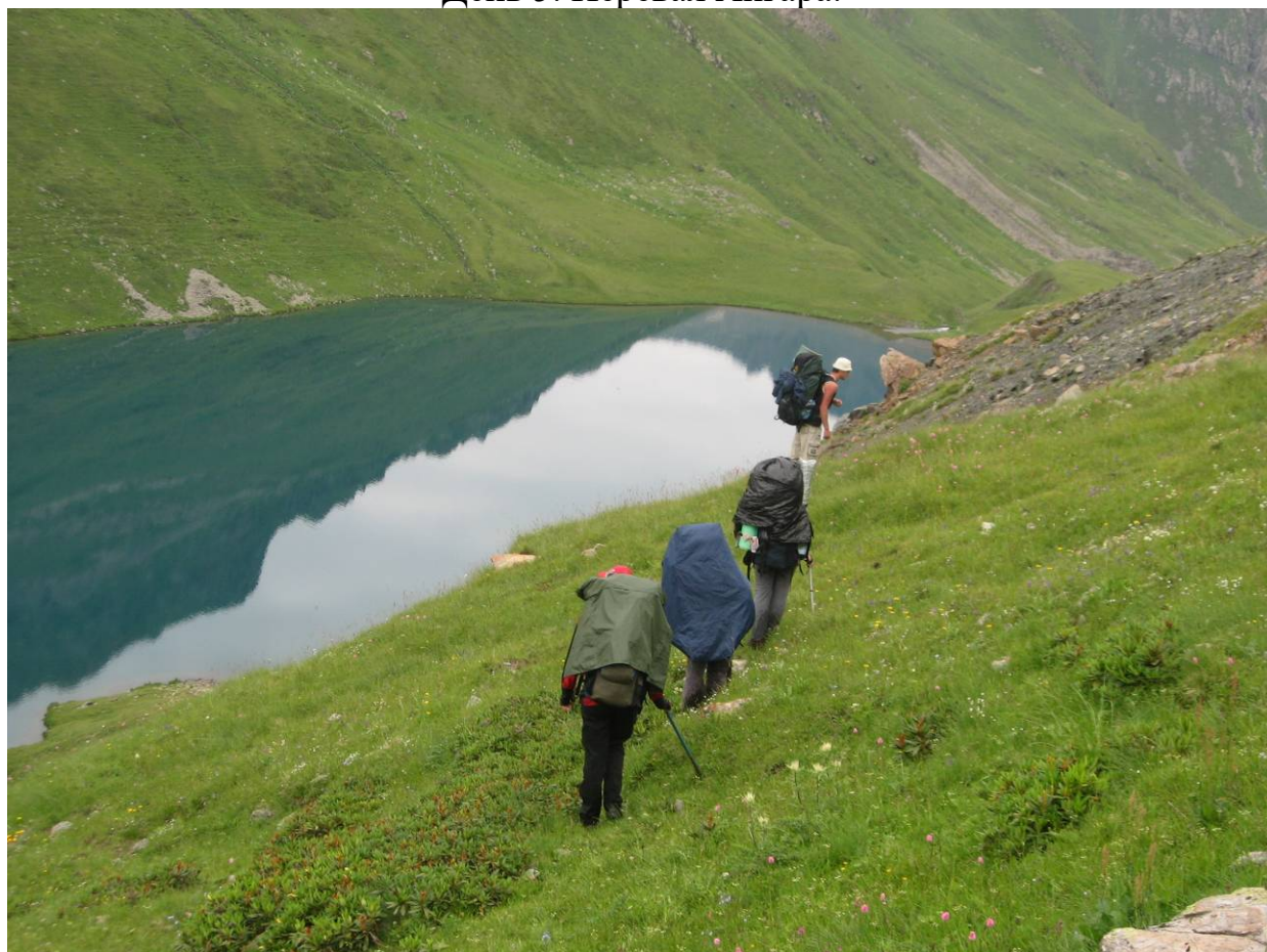
День 5. Озеро Кяфар