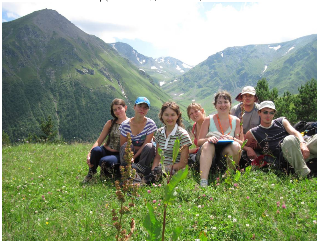
День 3. Вид на перевал Баритовый с Кафагурского хребта.