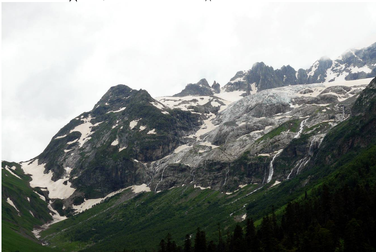
День 10. Ледниковая ферма