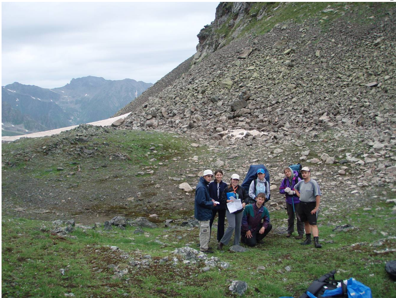
День 5. Перевал Ангара.