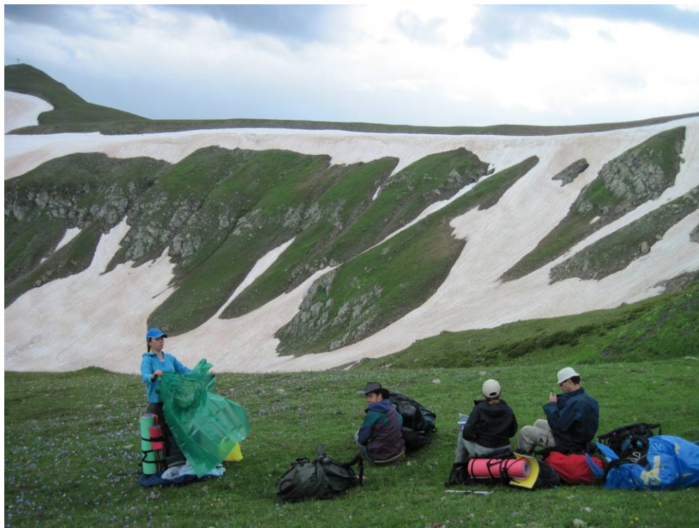
День 2. Седловина Малого Кяфарского перевала