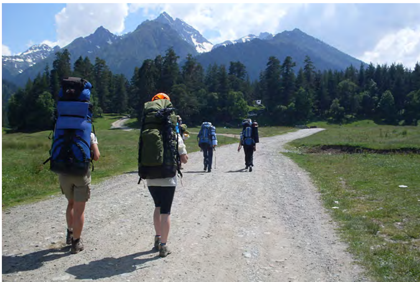
В районе балки Гнилая переходим через Софию по толстому бревну и продолжаем движение вверх. На ночевку встали возле ручья Гаммеш-Чат на благоустроенной поляне, на которой явно раньше обитали лесорубы.