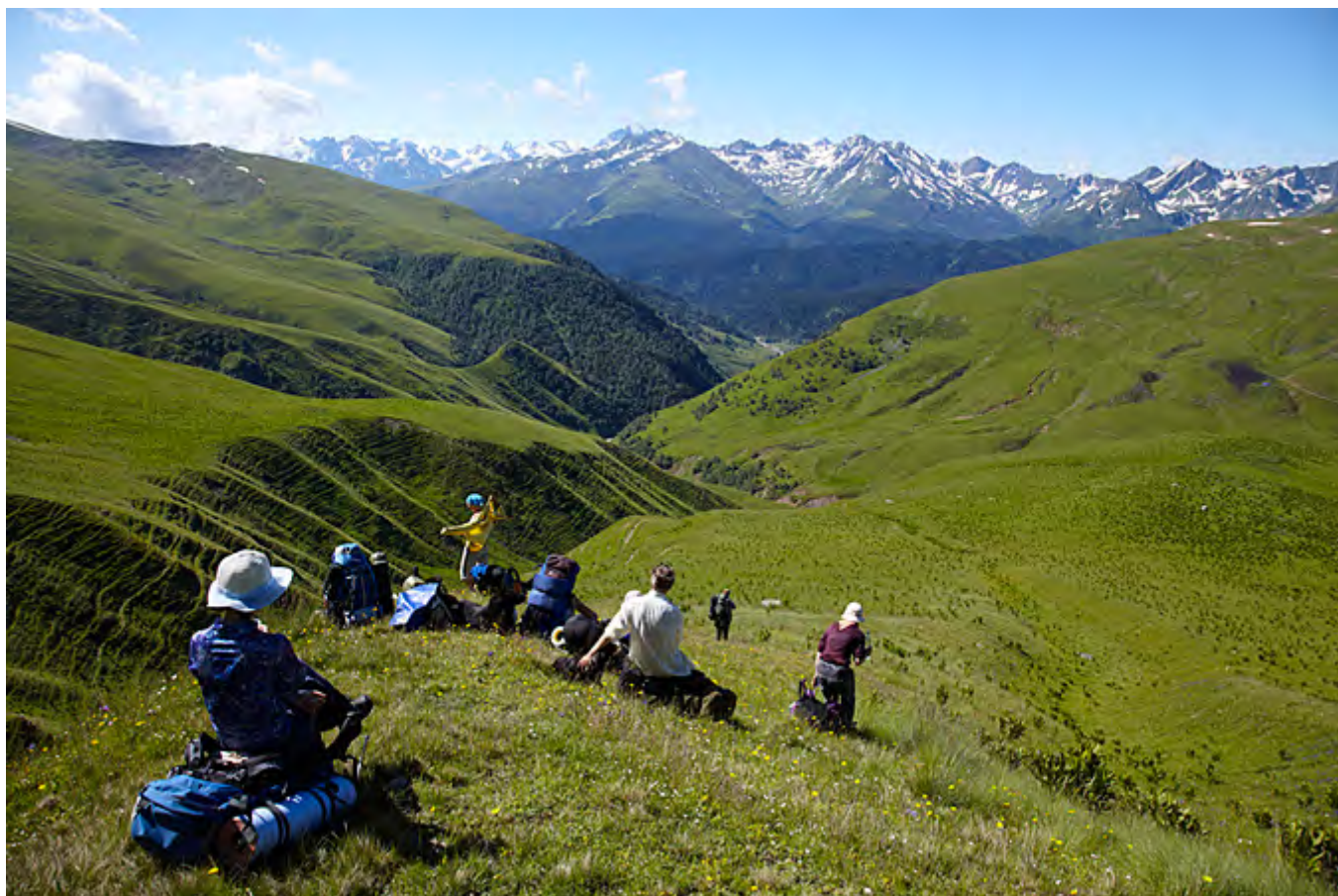
На перевал Речепста сн-ос (1А, 3000м) выходим в 10:30 часов.