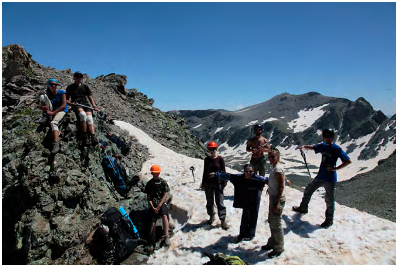
Потом траверсом поднимаемся на перевал Федосеева сн-ос (1А, 2980м) в 12:00.