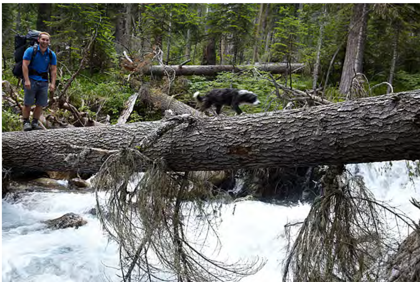
В сосняке тропа расходится, вдоль реки к Белореченскому водопаду, вправо круто вверх - в верховья реки Белая.