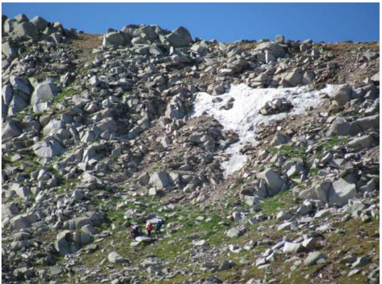
Фото 22 Работа группы на перевале