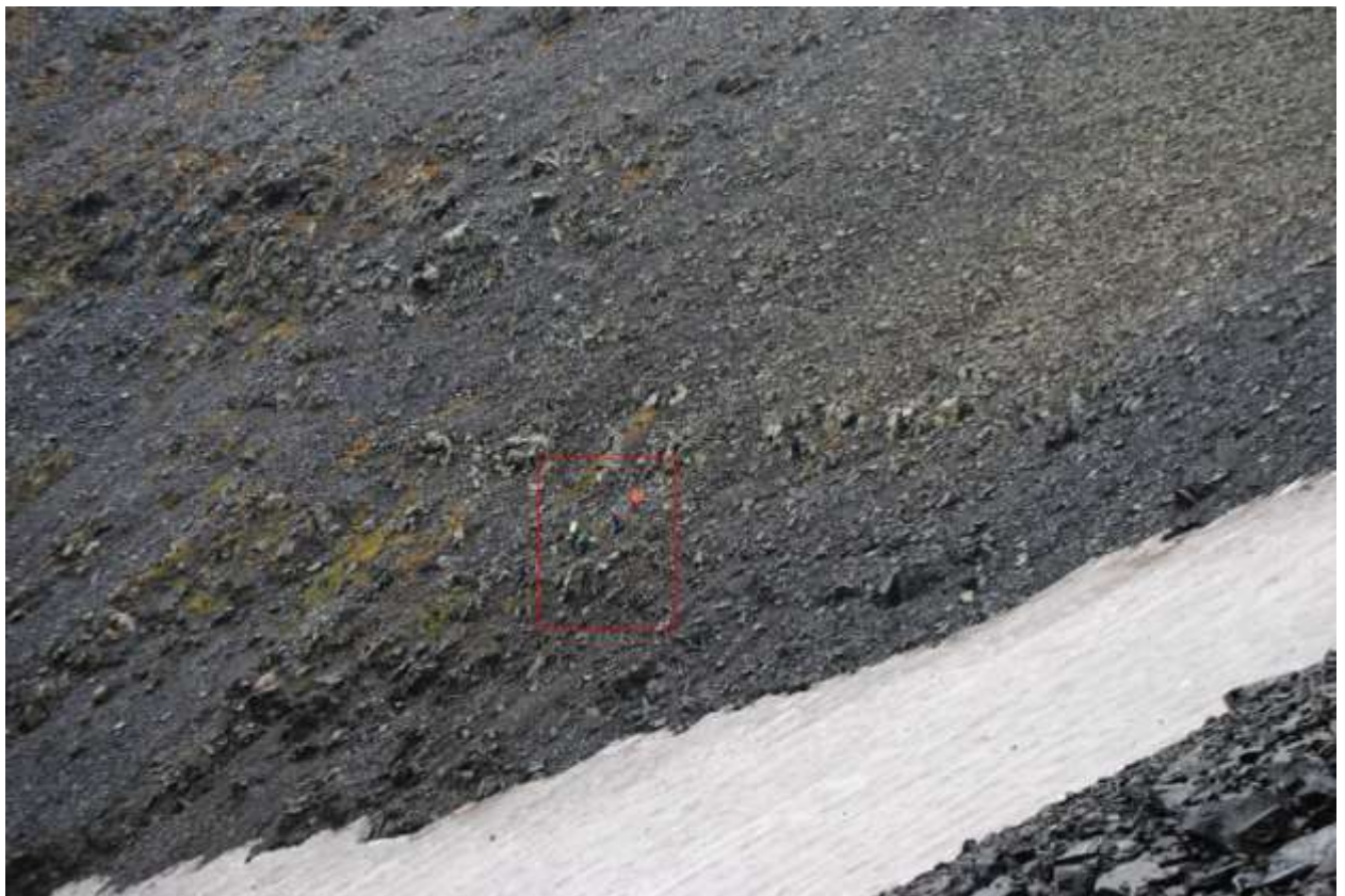
Фото 6 Работа на перевале