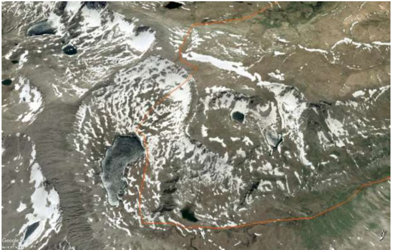
Фото 17 Нитка маршрута оз. Палевского - перевал 43 (1А)-Безымянные озера