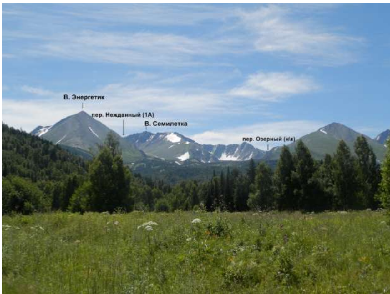
Фото 1 Общий вид