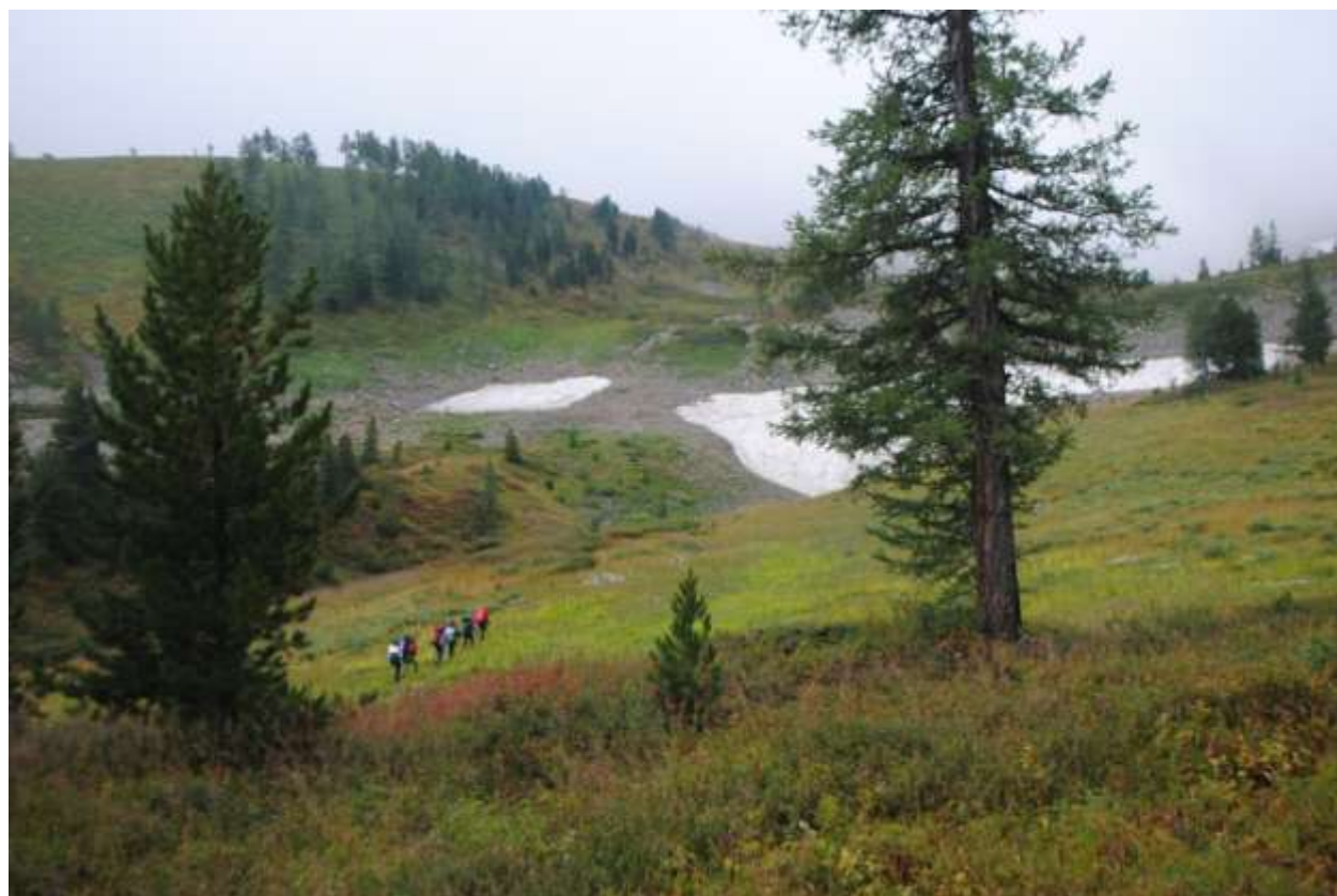
Фото 3 Движение по тропе