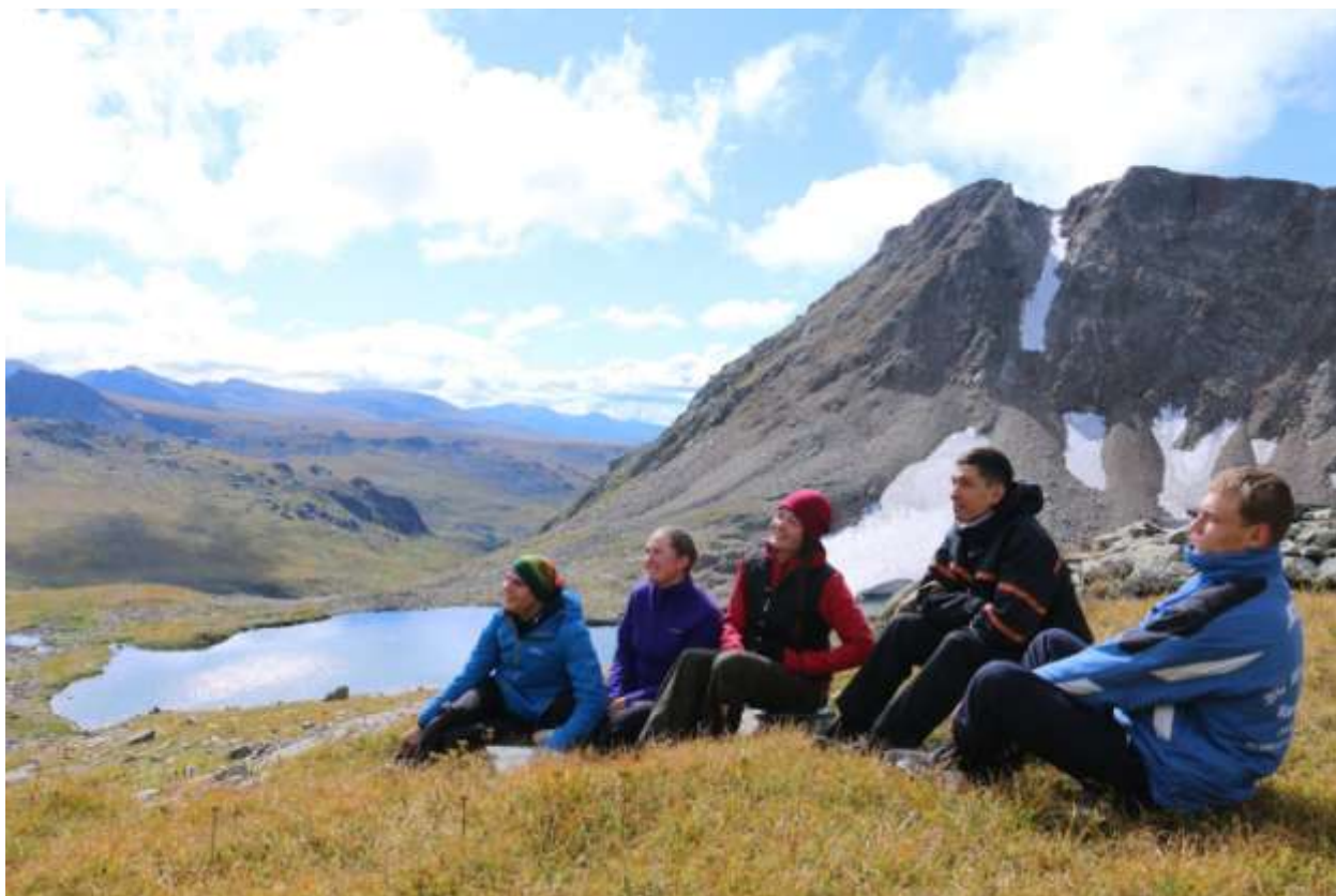
Фото 16 Место бивака под перевалом Метеоритный (3 день утро)