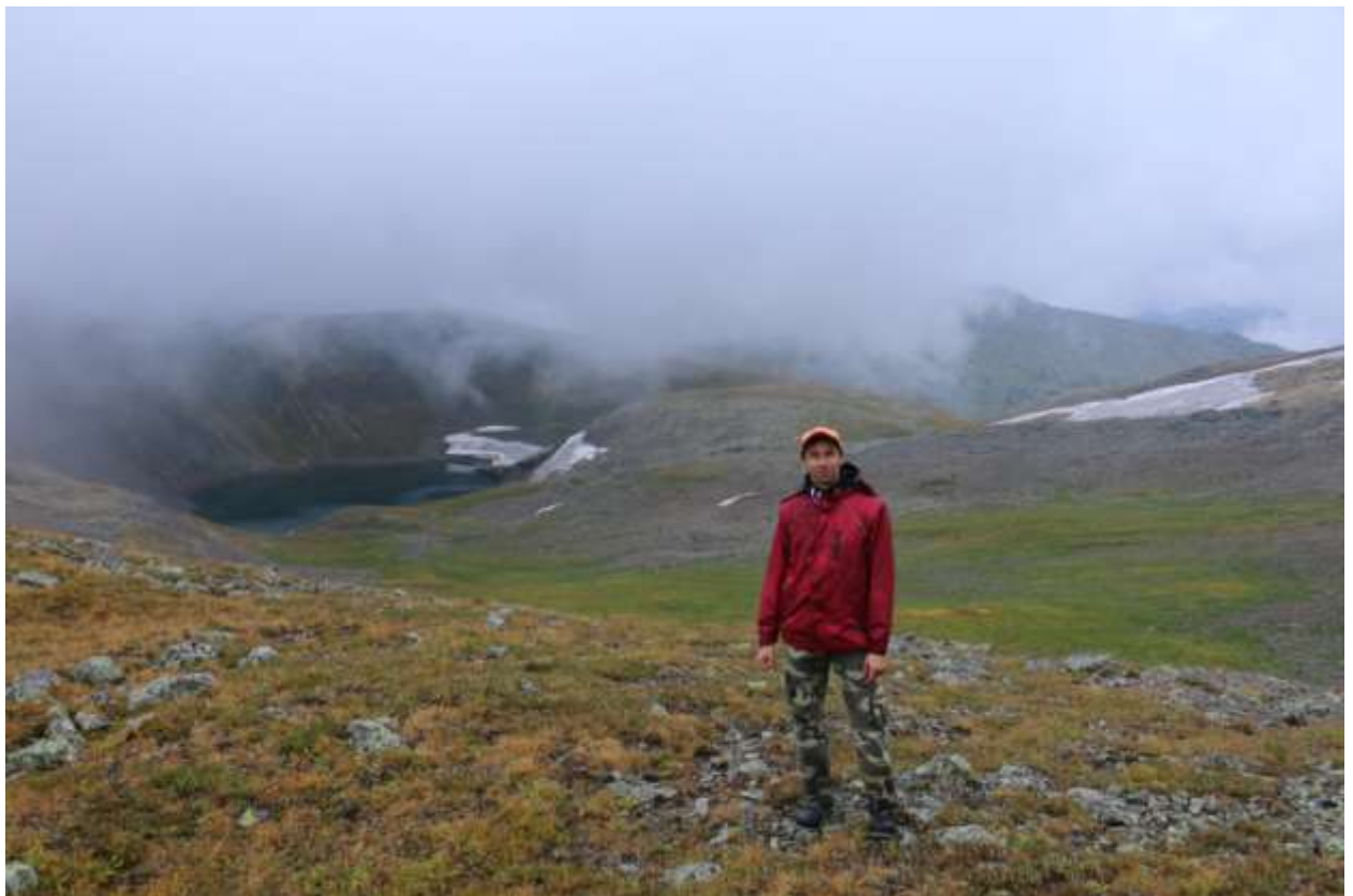
Фото 8 . Вид с перевальной перемычки в юго-восточном направлении