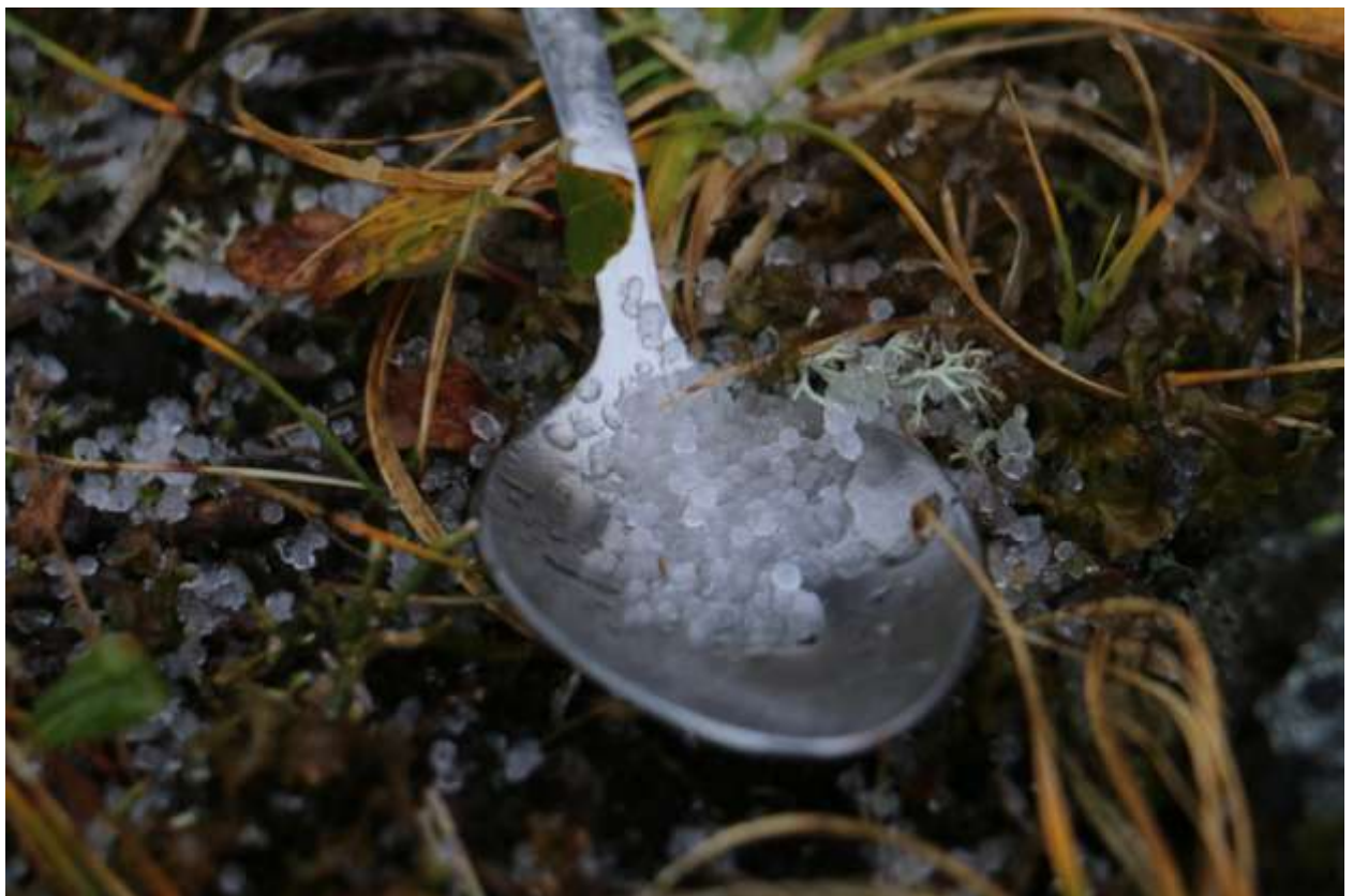
Фото 9 Крупинки града