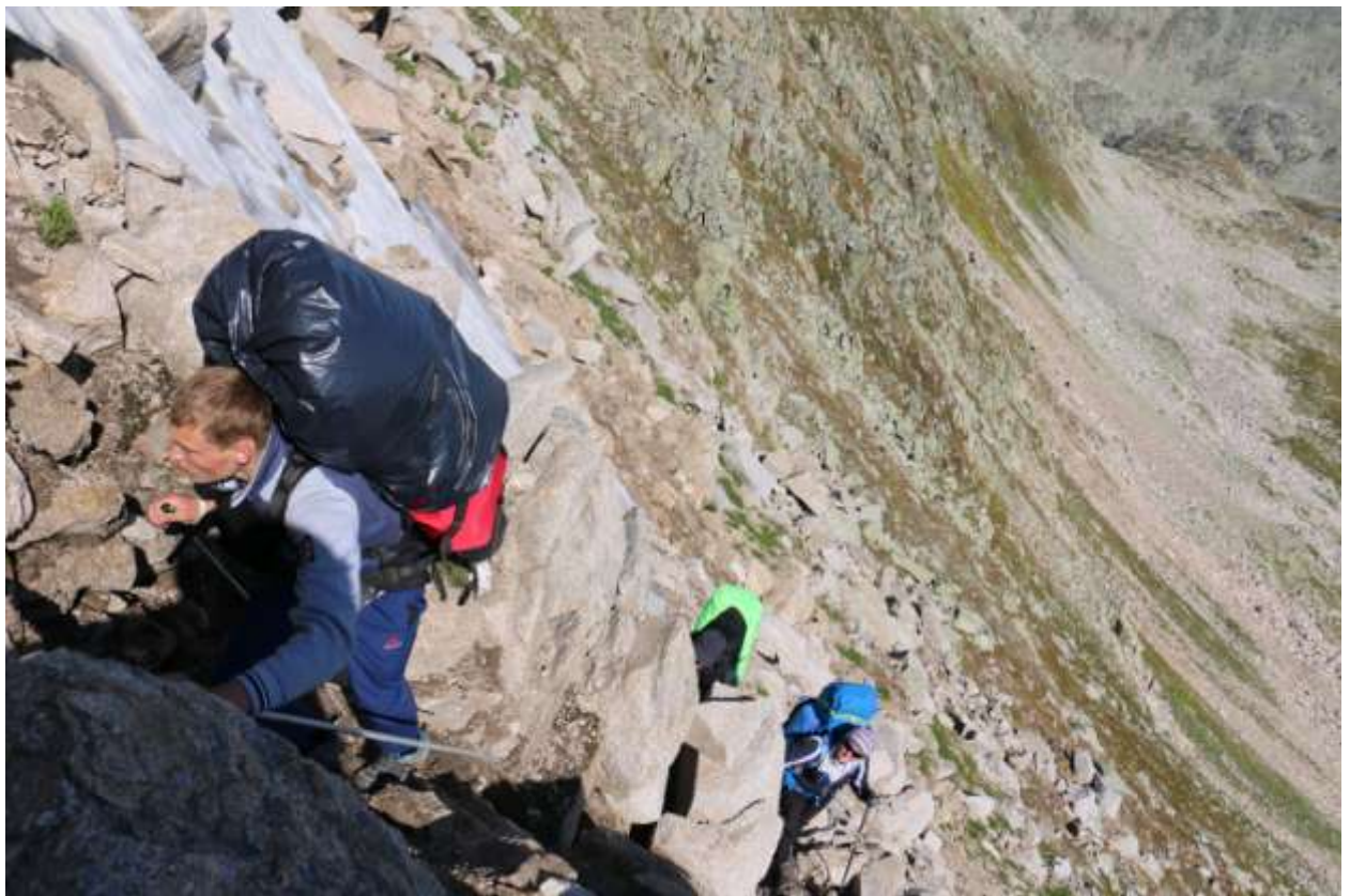
Фото 23 Выход к перевальной перемычке