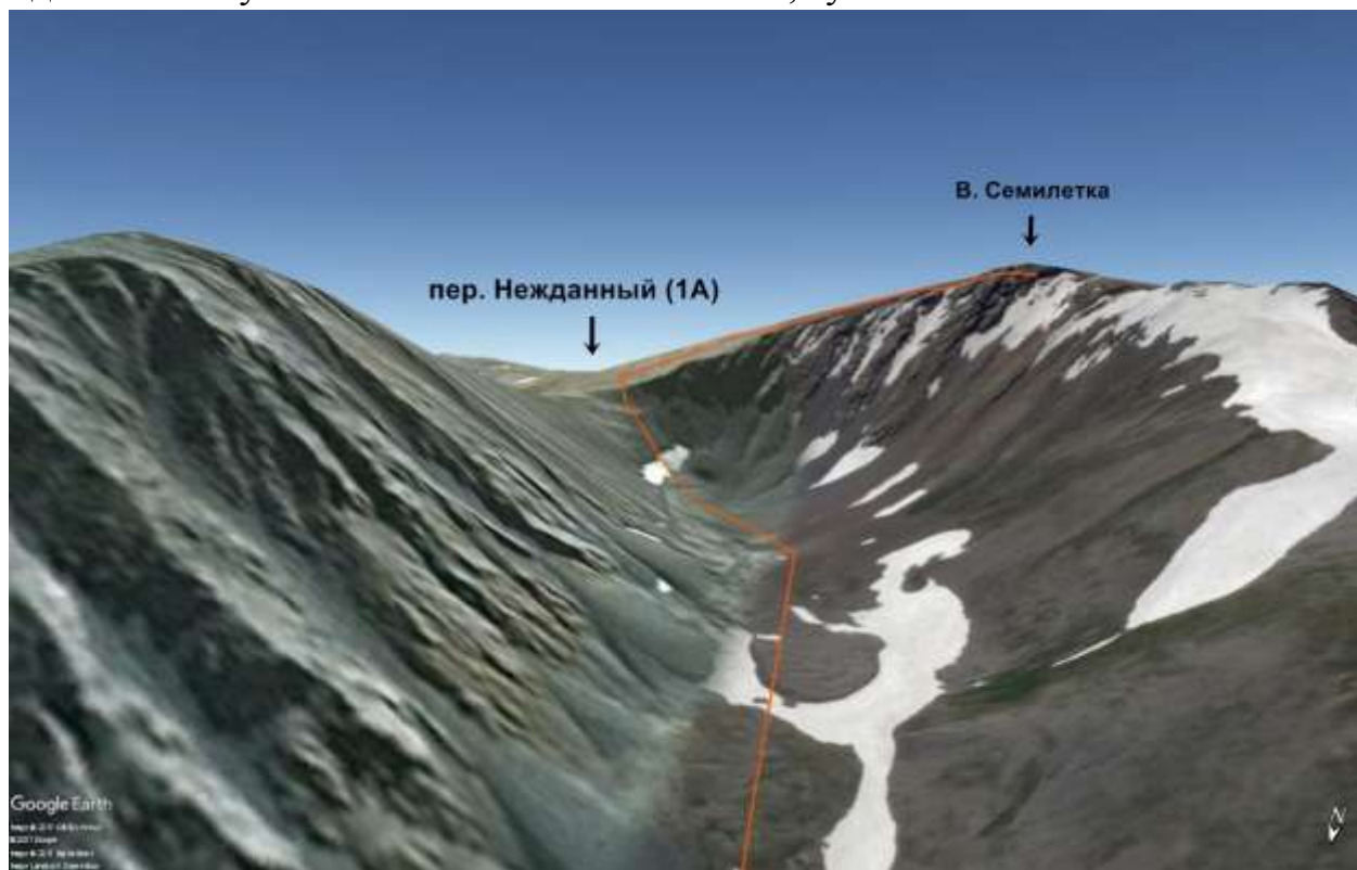
Фото 2 Вид с долины реки.

Погода: Туман. дождь. С северной стороны по долине постоянно поднимается туман. Южный же склон чистый, тумана нет.