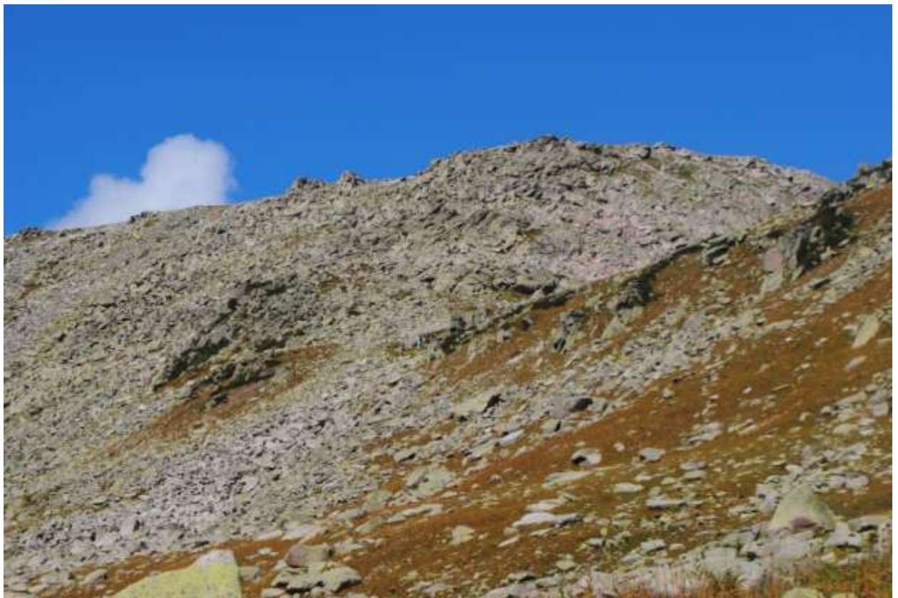
Фото 25 Спуск с перевала 43 (1А)