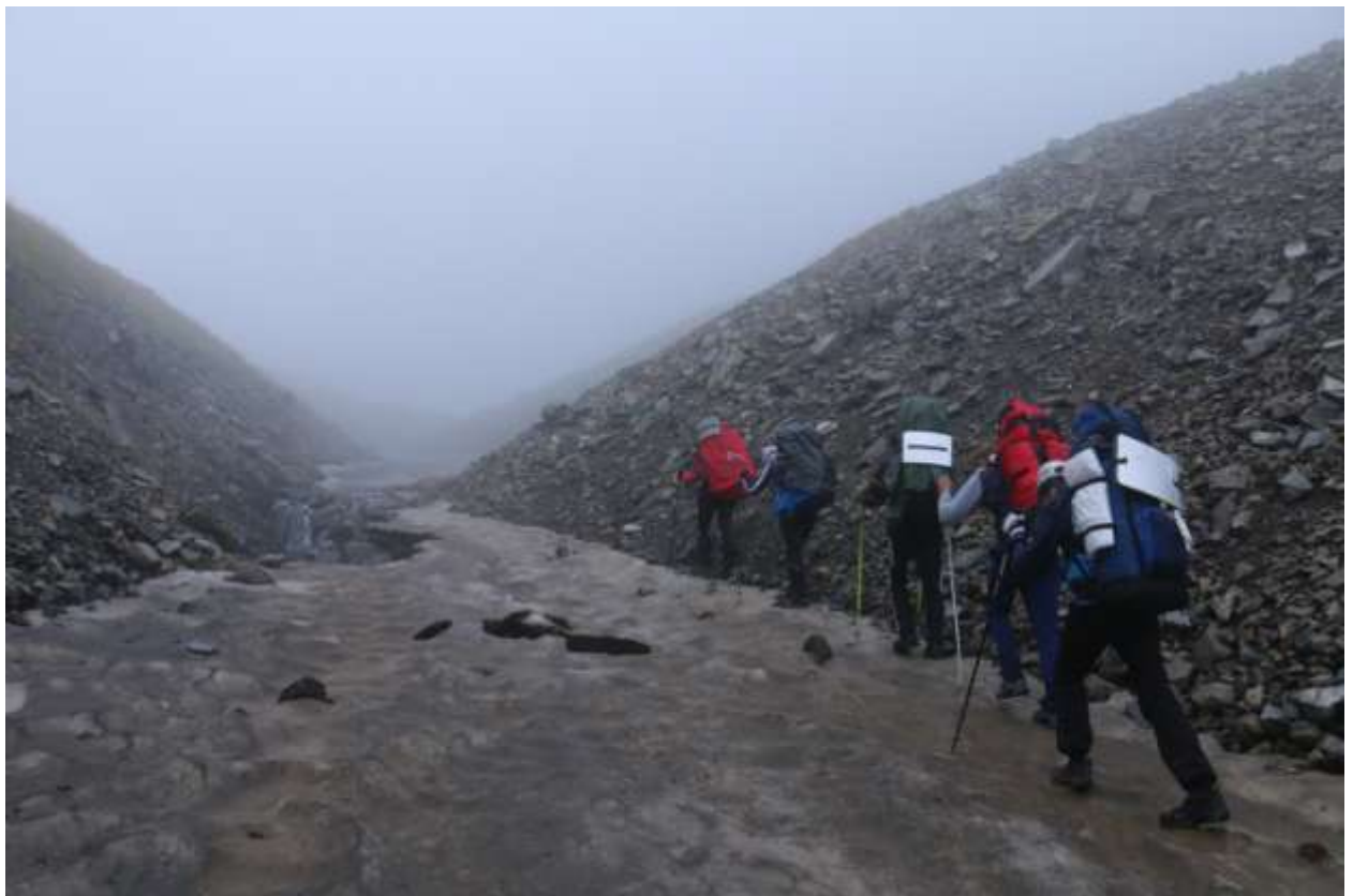
Фото 4 Движение вверх по реке