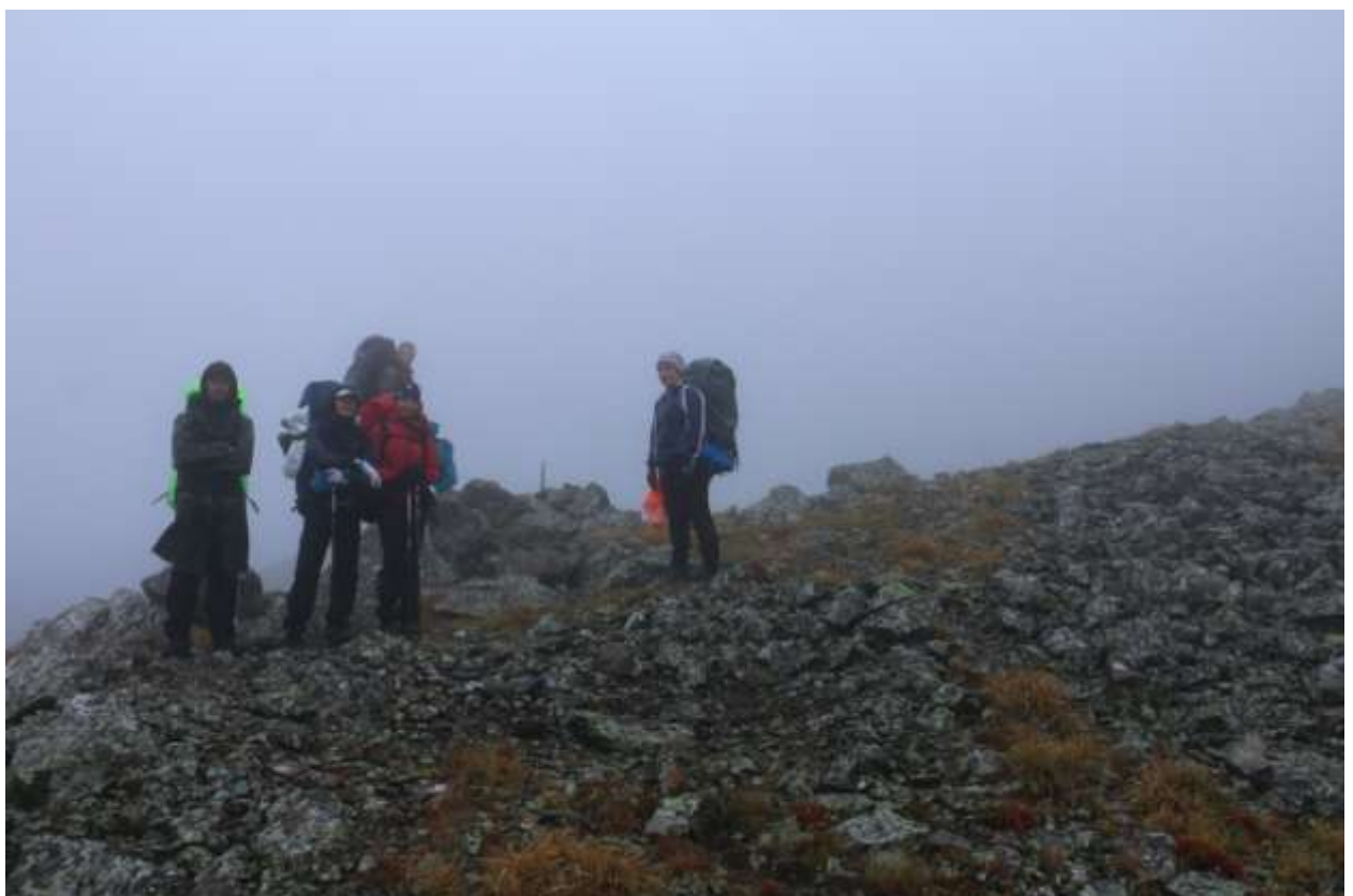
Фото 7 Рядом с туром на перевале Нежданный (1 А)