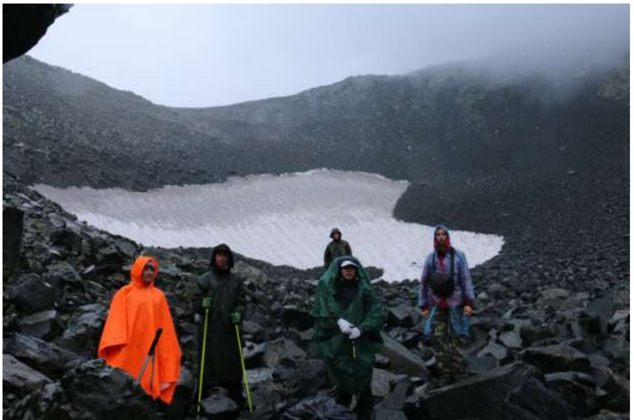
Фото 5 Группа под перевалом Нежданный 1 А