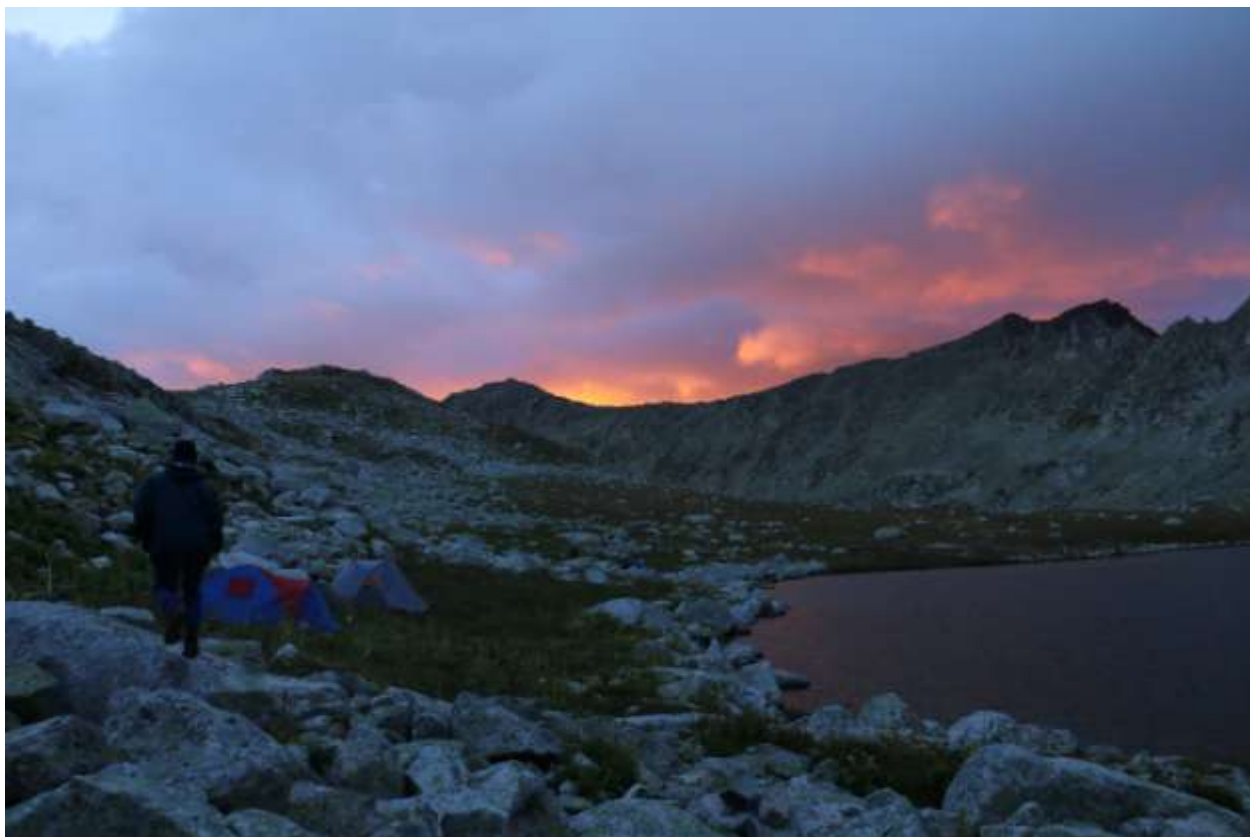
Фото 19 Закат на Палевском озере