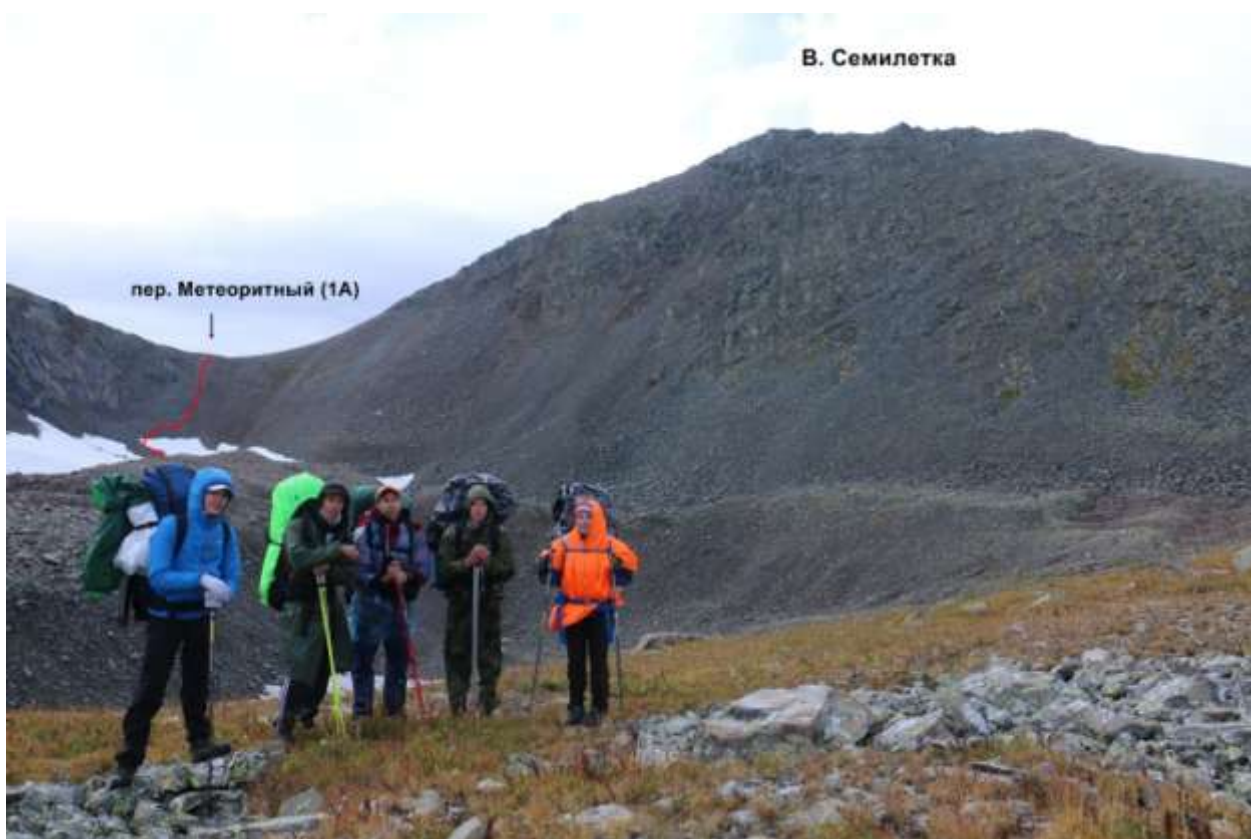
Фото 15 Под перевалом, вид на восточный склон