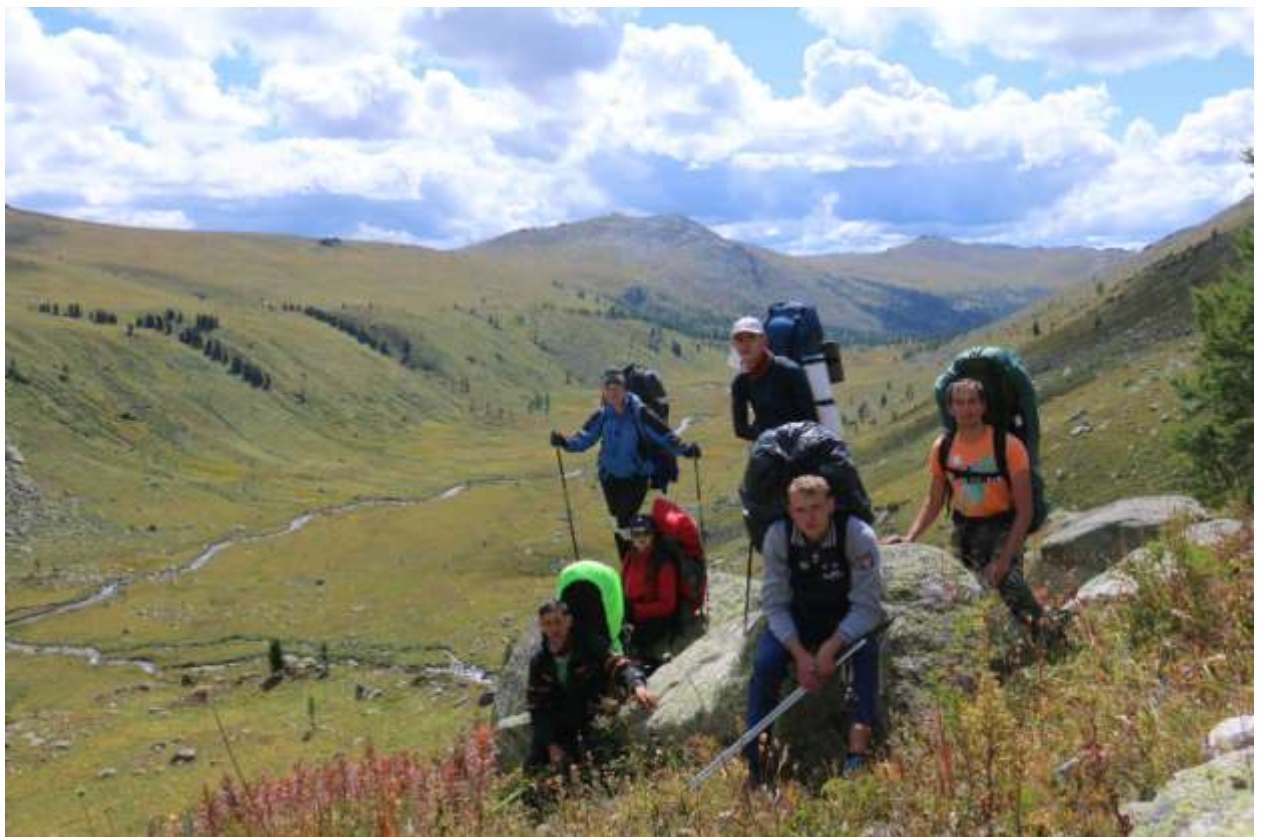
Фото 18 Место впадения правого притока в основное русло реки Правая Громотуха