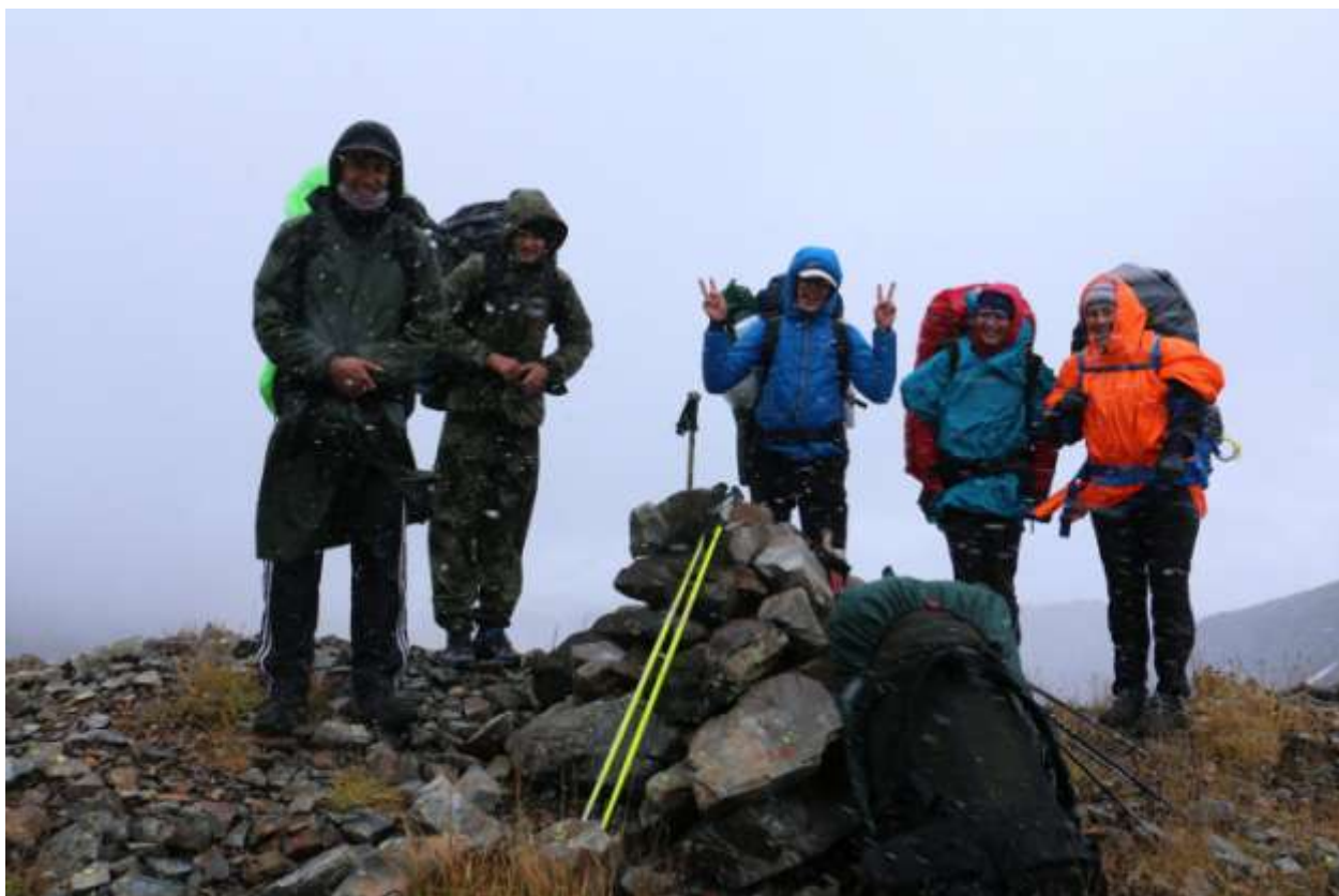
Фото 14 Группа на перевале Метеоритный (1А)