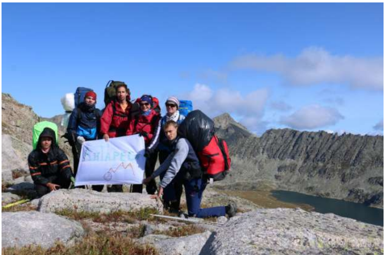
Фото 24 На перевале 43 (1 А) Вид в сторону озера Палевское