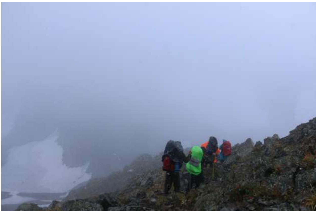
Фото 12 . Спуск по гребню к перевалу Метеоритный (1А)