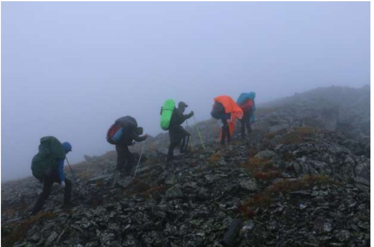
Фото 10 Начало Траверса