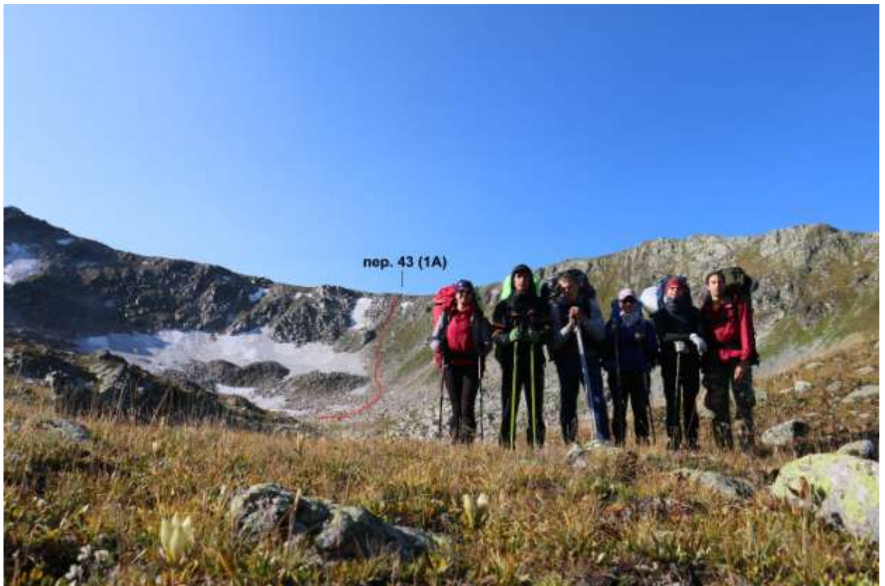
Фото 21 Под перевалом 43 (1А)