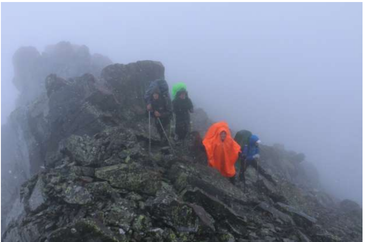
Фото 11 На Гребне (Вид на северный и южный склон)