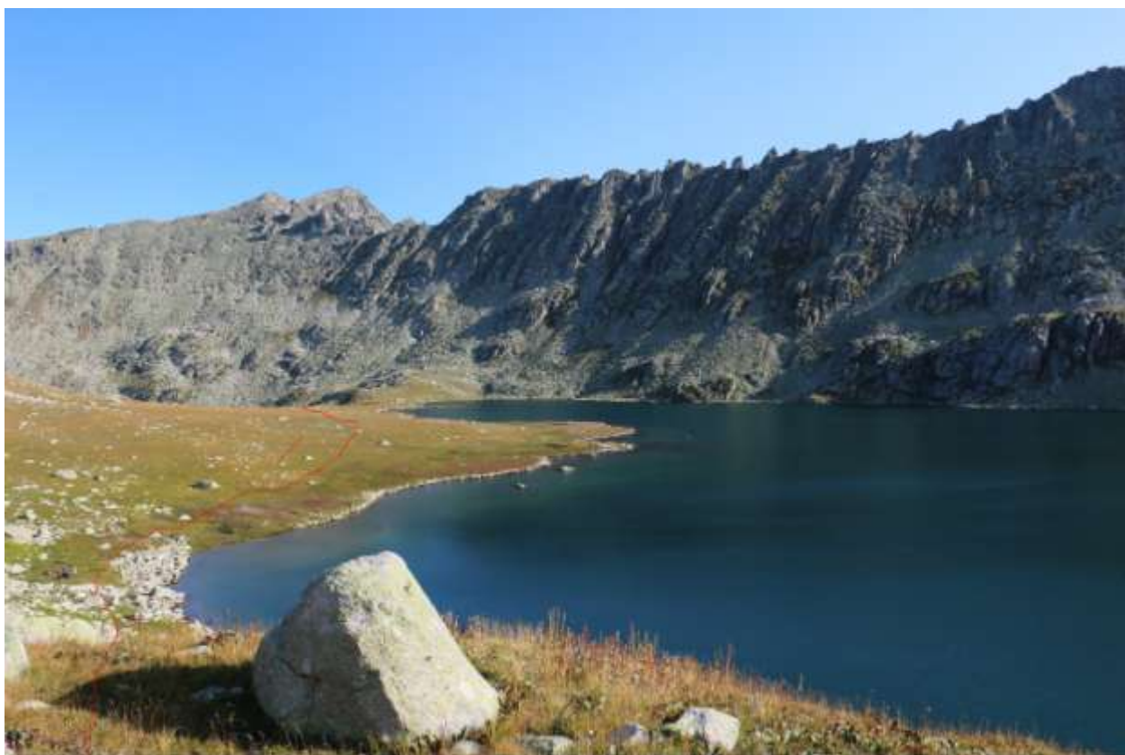
Фото 20 Путь подъема по реке Правая Громотуха к озеру.