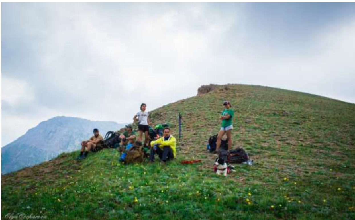
Рис 2. Группа на перевале Трапедия н/к