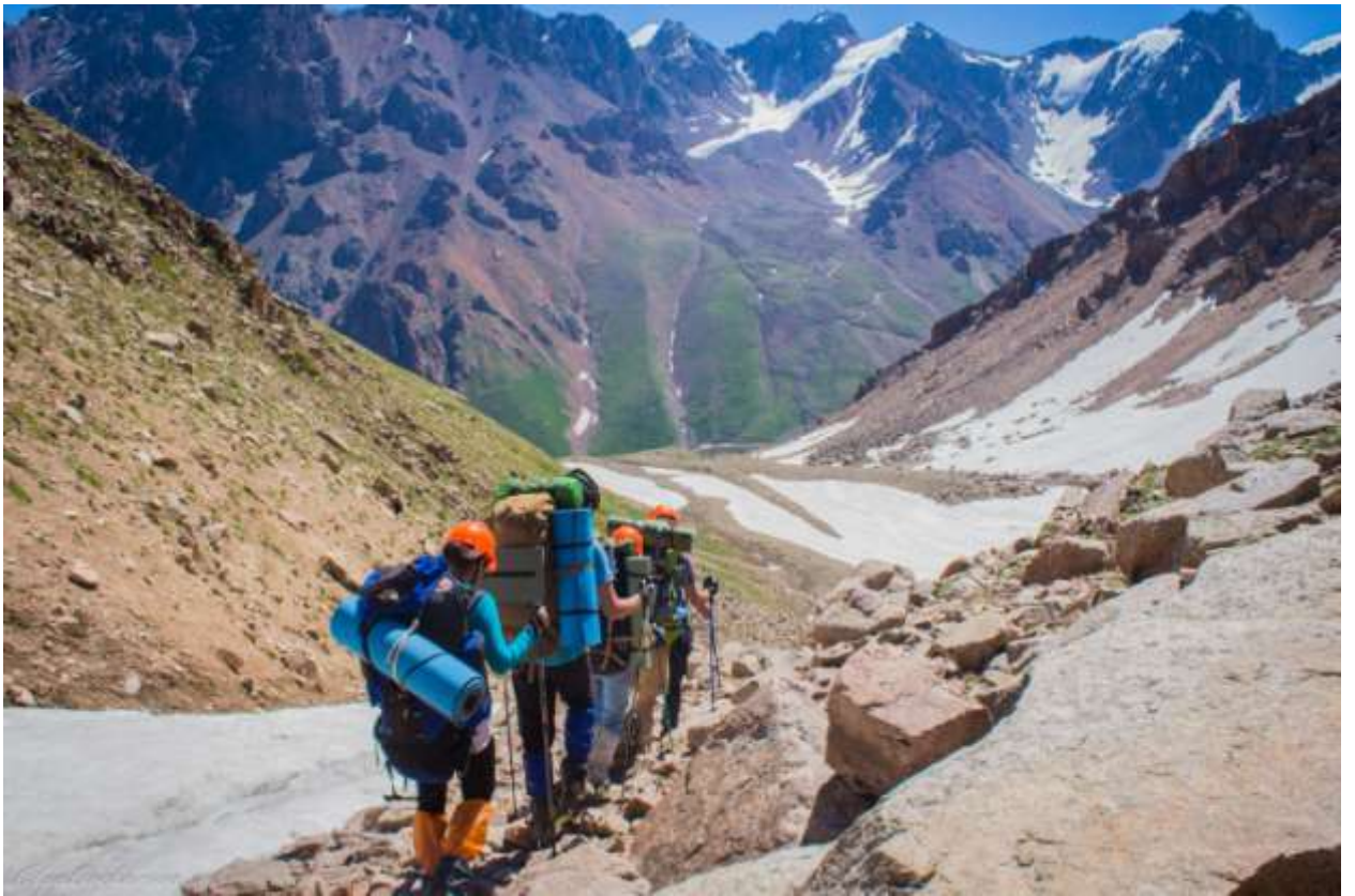
Рис. 5. Спуск с перевала Титова в сторону Мынжылки