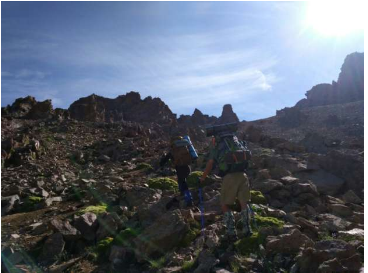
Рис. 7. Подъем на перевал Школьник 1А