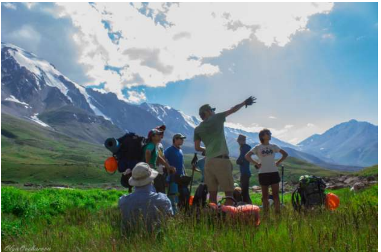
Рис. 15. Слияние рек Сев.-Зап. Ручей и реки Озерная