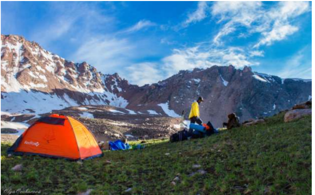
Рис. 3. Лагерь под перевалом Титова 1А