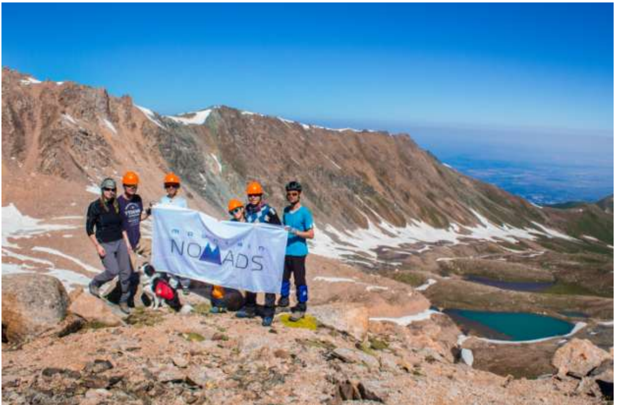
Рис 4. Группа на перевале Титова 1А