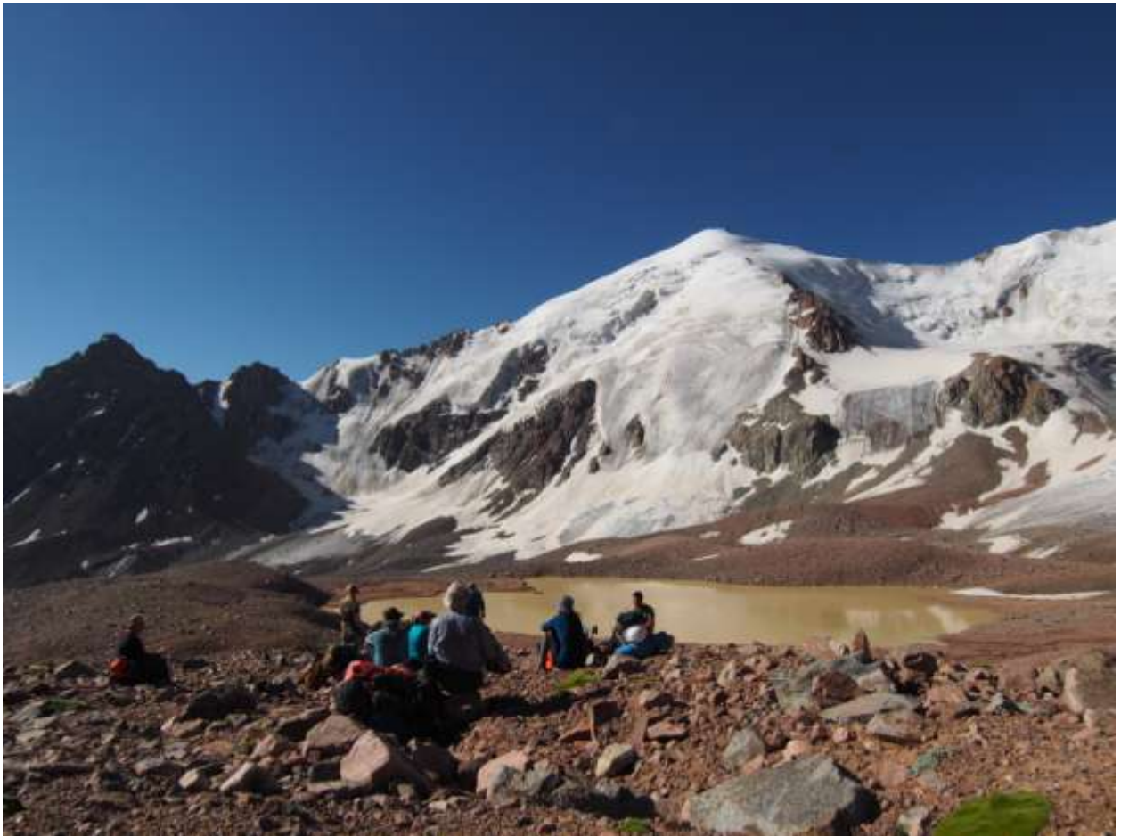
Рис. 12. Группа под перевалом Туристов 1А