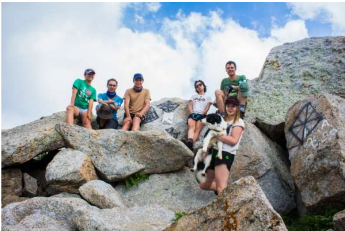
Рис 1. Группа на вершине Кумбель н/к