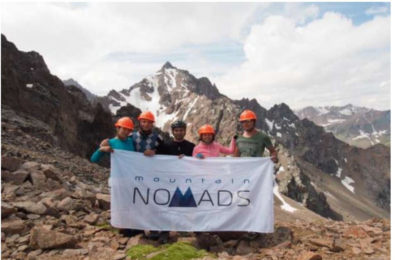
Рис. 8. Группа на перевале Школьник 1А, вид на пик Абая