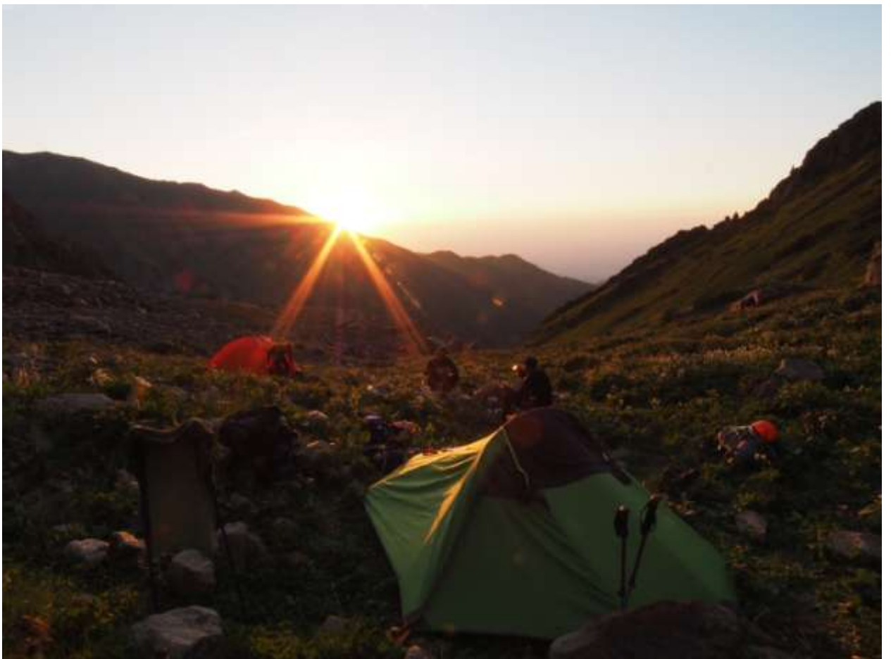
Рис. 6. Лагерь в ущелье Чертово