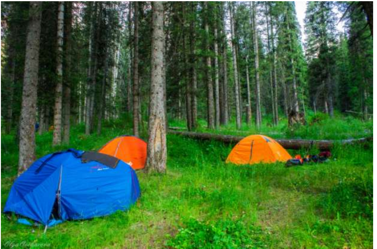
Рис. 10. Ночевка в ущелье Левый Талгар