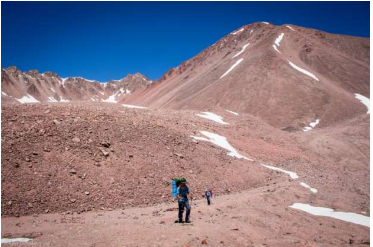
Рис. 14. Верховья ущелья Кызылсай