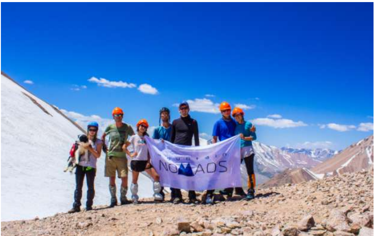
Рис. 13. На перевале Школьник 1А