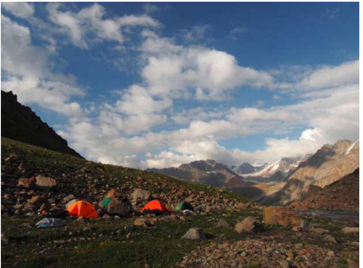
Рис. 11. Ночевка в верховьях ущелья Левый Талгар (перед перевалом)