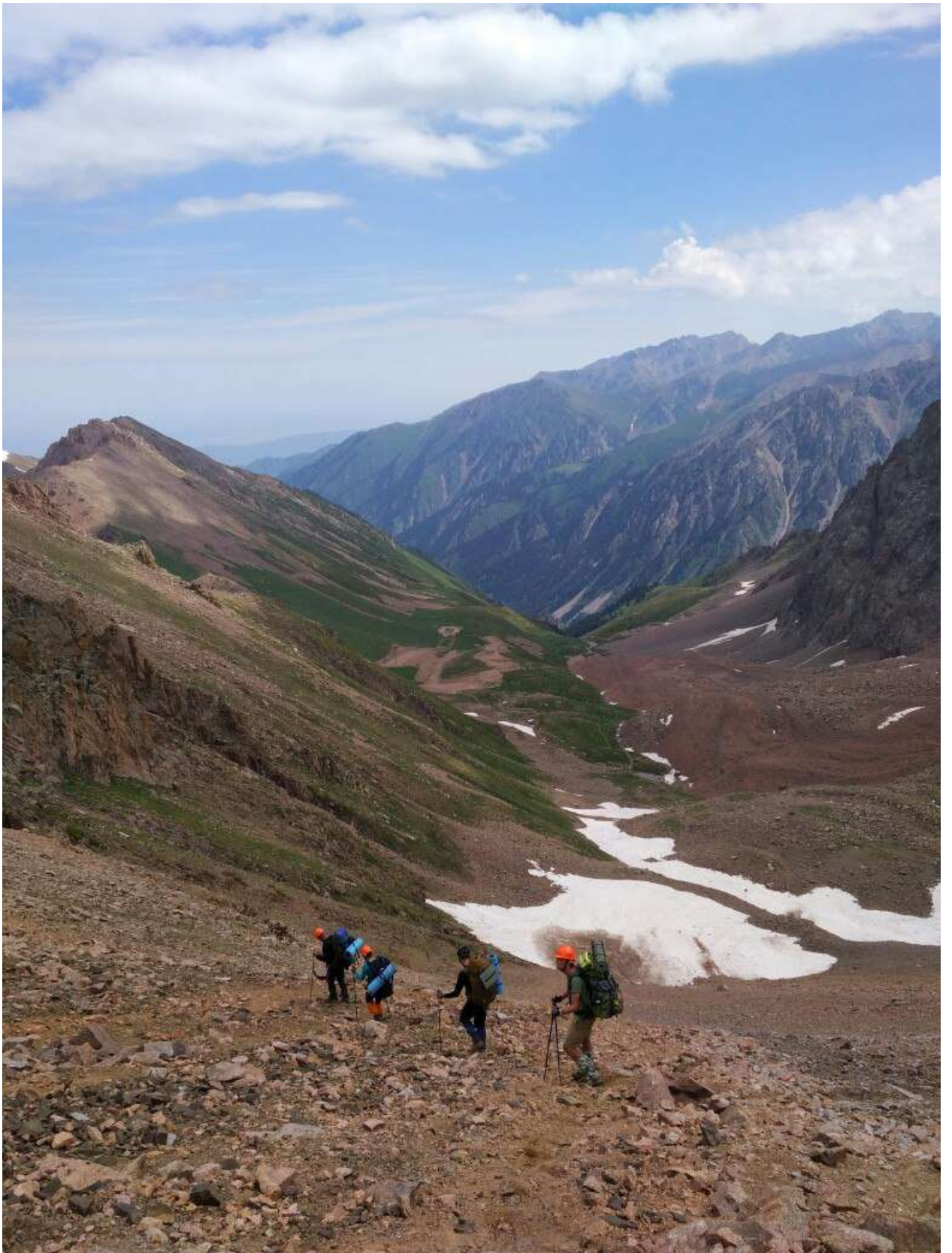
Рис. 9. Спуск группы с перевала Школьник в сторону ледника Богдановича